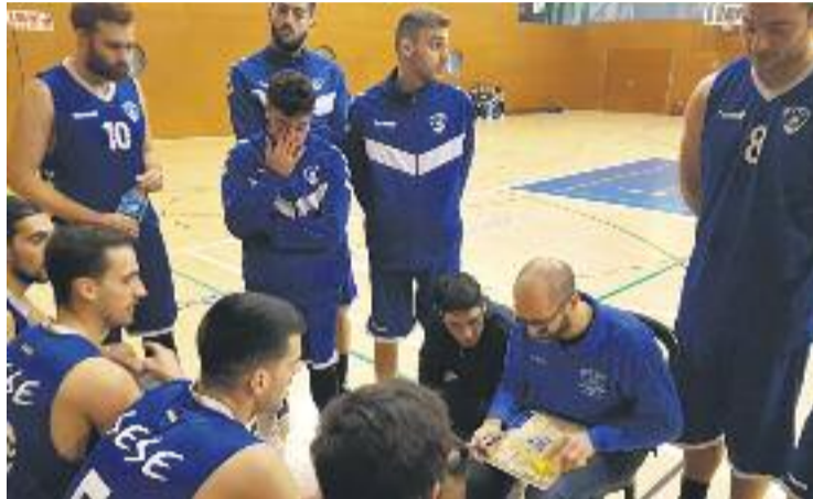
Els de Carlos Espona estan fent una gran temporada.

Ara que ja s'han jugat les primeres 17 jornades, l'equip presenta un balanç de 15-2, el mateix que el Molins, amb tres victòries més que el Sant Cugat, quatre més que l'Alpicat i cinc més que