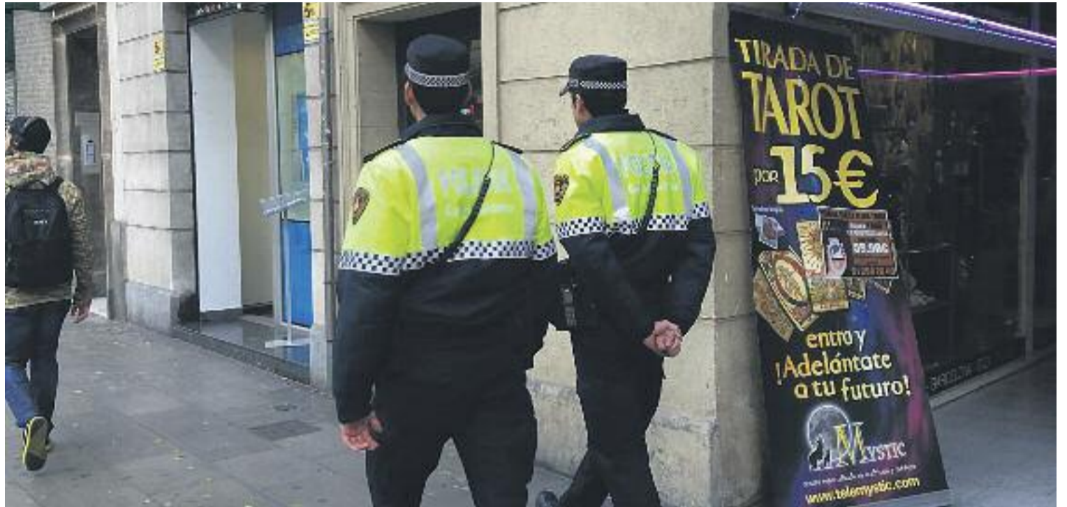
Una imatge de dos agents de la Guàrdia Urbana de servei.

SAPOL no és l'únic sindicat que denuncia aquesta situació des de fa temps. El sindicat CSIF (Central Sindical Independent i Transparent) va reclamar fa pocs dies una convocatòria immedia-