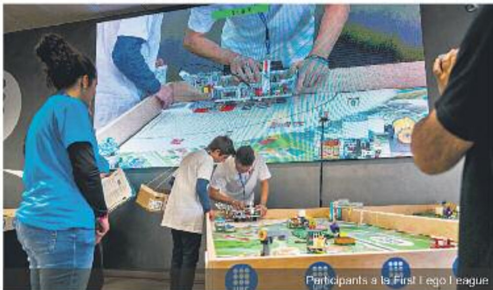
Participants a la First Lego League

Hi ha diferents premis i guardons per als concursants de les diferents fases. Aigües de Barcelona hi col·labora amb el guardó 1r premi al Projecte Científic com a agent coneixedor i impulsor de la gestió eficient del cicle integral de l'aigua. També