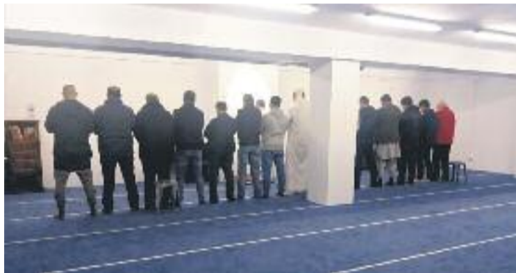
Un moment d'una pregària.

L'obertura d'aquesta mesquita arriba després de mesos de queixes i protestes d'una part dels veïns, que des d'un primer moment es van oposar a la mesquita amb cassolades de rebuig. Ara han canviat les cassolades per vetllades amb espelmes, ja que un cop l'espai ha obert podrien ser multats per odi i xenofòbia. Els veïns sempre han defensat que la seva oposició a la mesquita només és per qüestions legals i d'ideoneïtat de l'espai. Tot i això, grups d'ultradreta i racistes han fet acte de presència al barri en nombroses ocasions. A l'altra banda s'hi va posicionar des d'un primer moment l'Associació de Veïnes i