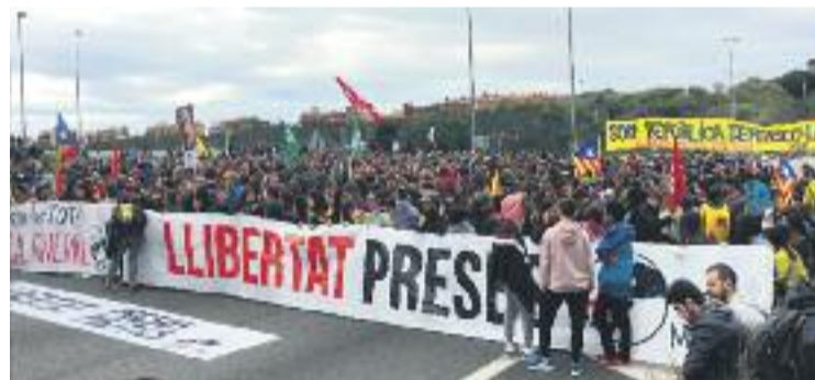
El 8-N hi va haver talls de trànsit a diferents punts.

TRIBUNALS ▶ Tres veïns de Nou Barris, un dels quals pertany a l'ANC i els altres dos al CDR Nou Barris, estan citats a declarar el 27 de febrer per la seva participació en l'aturada de país del passat 8 de novembre.