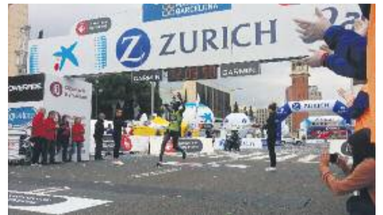
Chesum, en el moment d'aconseguir la victòria l'any passat.

Com és habitual, la prova arrencarà i tindrà la seva fi a la Font Màgica de Montjuïc, i els atletes hauran de recórrer 42 quilòmetres pels punts més emblemàtics de la ciutat. L'organització també posarà a disposició dels participants set llibres que marcaran diferents ritmes.