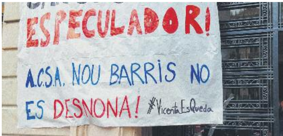
Els veïns van organitzar una protesta a la seu de l'administrador de finques.

HABITATGE ▶ Un grup d'unes 30 persones de diferents entitats es van desplaçar fins al passeig de Gràcia el passat 19 de febrer per ocupar el despatx de l'administrador de finques ACSA.