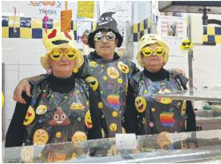
Les emoticones, protagonistes al Mercat de la Trinitat.

El Mercat de Montserrat, però, no va ser l'únic que va celebrar el Carnaval. El de Canyelles va organitzar el dia 10 de fe-