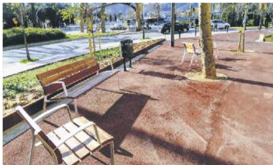
A l'esquerra dues imatges de la festa d'inauguració del 24 de febrer i a la dreta imatges del nou aspecte de la zona.

ESPAI PÚBLIC ▶ El barri de la Guineueta va inaugurar de forma oficial el passat 24 de febrer els nous interiors d'illa en el triangle que formen el passeig Valldaura, la Via Favència i el carrer Guineueta amb una festa ciutadana que va reunir un bon nombre de veïns del barri.