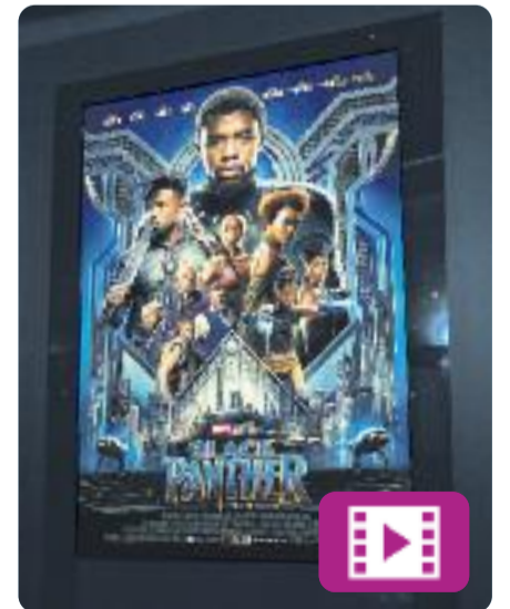
Black Panther Ryan Coogler

Black Panther és la continuació de Captain America: Civil War i explica la història del jove T'Challa, un superheroi negre que torna al seu país, Wakanda, per ser coronat rei.