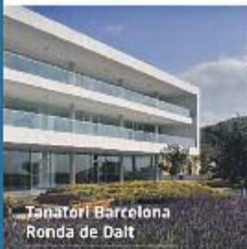
Funerari Barcelona Ronda de Dalt

A ÀLTIMA preparem i dissenyem els serveis funeraris juntament amb les famílies, adaptant-nos als seus desitjos i a les seves necessitats. Per això, a ÀLTIMA sempre és la família qui decideix l'import total del servei contractat.