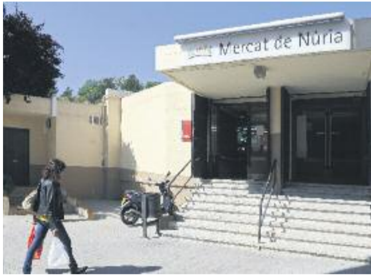
El Mercat de Núria ha tancat les seves portes.

Amb l'adéu d'aquest històric mercat, la part alta de Ciutat Meridiana queda pràcticament sense teixit comercial i ara el mercat