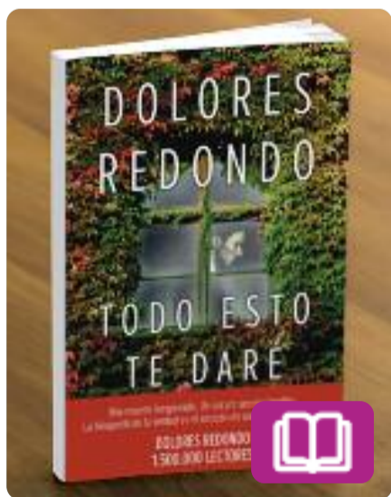
Todo esto te daré Dolores Redondo

Una mort que oficialment és accidental però que podria no ser-ho i la batalla del marit de la víctima amb la seva família política per aclarir els fets.