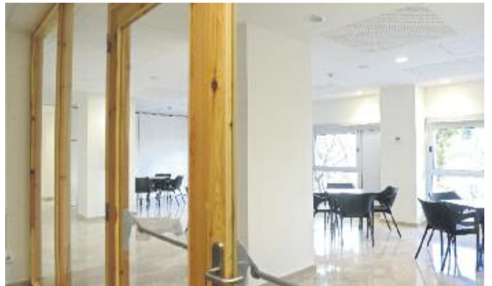
Dues imatges del nou Casal de Barri de Torre Baró (dreta) i una imatge del barri (esquerra).

EQUIPAMENTS ▶ El Casal de Barri de Torre Baró ja funciona des de fa uns dies a les seves noves instal·lacions de la primera planta del número cinc de l'avinguda Escolapi Càncer. Només entrar-hi es pot comprovar com el nou equipament suposa un salt de qualitat respecte de l'anterior edifici, situat fins ara en un espai més petit al mateix carrer.