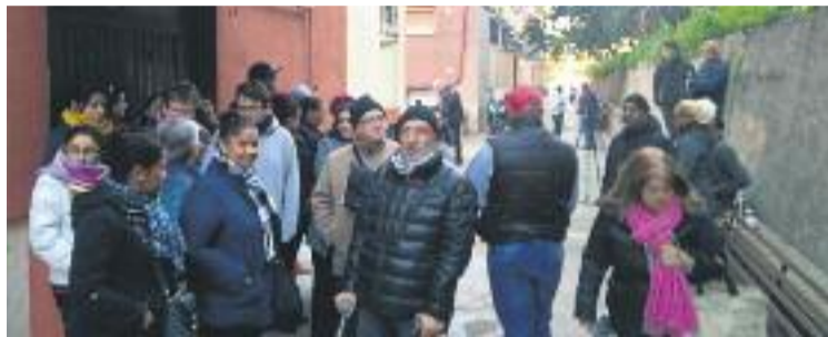
Imatge d'un dels desnonaments que es va ajornar.

A aquesta preocupant xifra, cal afegir que al conjunt del districte, només el passat 29 de gener, hi havia, amb els de Ciutat Meridiana inclosos, 18 de previstos. Finalment, en el que últimament es repeteix en moltes ocasions, es van ajornar tots.