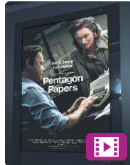
Els arxius del Pentàgon Steven Spielberg

Més d'un mes després de la seva estrena als Estats Units arriba a casa nostra l'últim títol de la factoria d'Steven Spielberg.