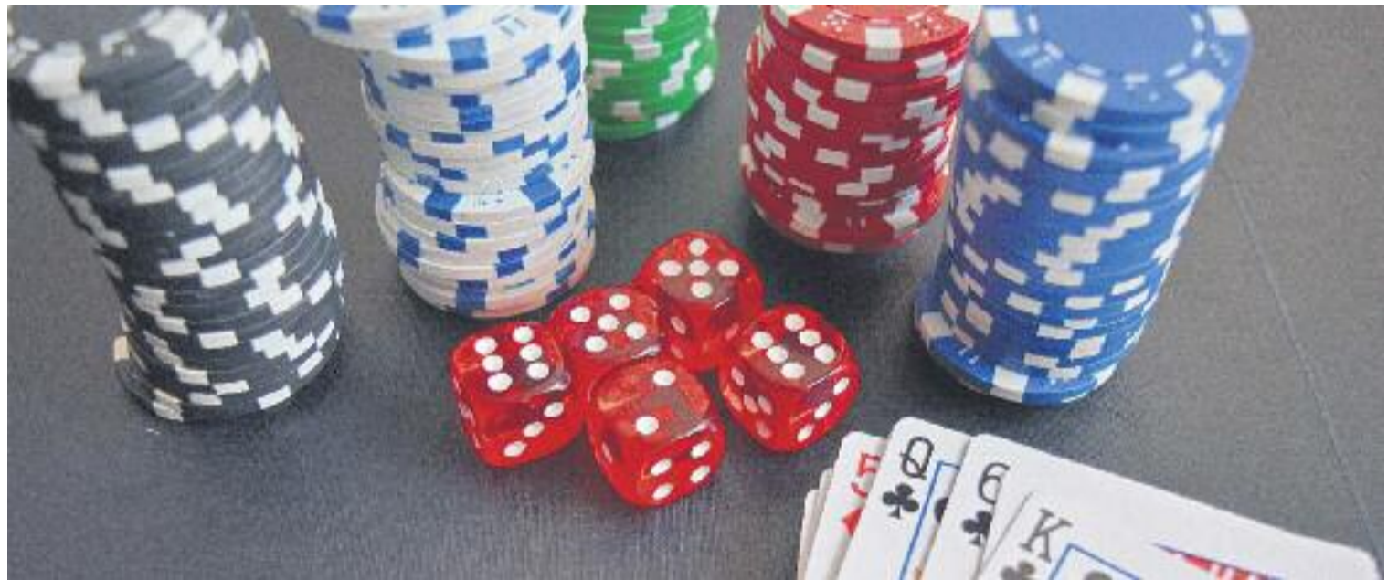
Jugadors Anònims fa trobades amb persones que pateixen ludopatia per ajudar-los a frenar la malaltia.