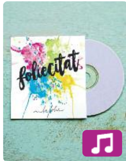
Folietat La Folie

Premi Enderrock a Artista Revelació per la Crítica, amb Folietat el grup La Folie reivindica el somriure, la llum, l'optimisme i la vitalitat, així com les ganes d'agradar i de transmetre bona energia.