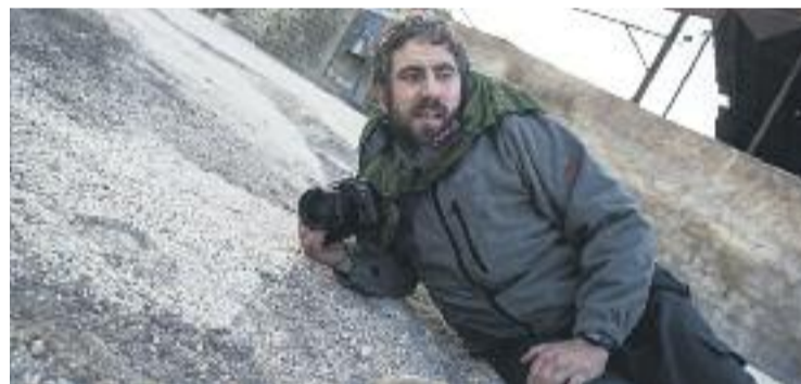
Lubaki, en un dels destins on s'ha desplaçat.

EXPOSICIÓ ▶ El centre cívic Can Basté acollirà a partir del pròxim 30 de novembre, i fins al 20 de gener de l'any que ve, l'exposició fotogràfica 'Un món convuls', que mostra el treball del fotògraf basc Andoni Lubaki en els cinc conflictes armats més importants de l'última dècada.