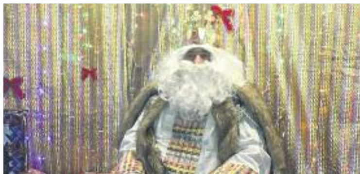
Els Reis Mags, uns dels protagonistes de la fira.

Tot i que la Fira de Nadal i Reis inaugura oficialment la campanya nadalenca del districte, es pot dir que la celebració del Black Friday del passat 24 de novembre va ser la gran jornada prèvia als dies de Nadal. Des