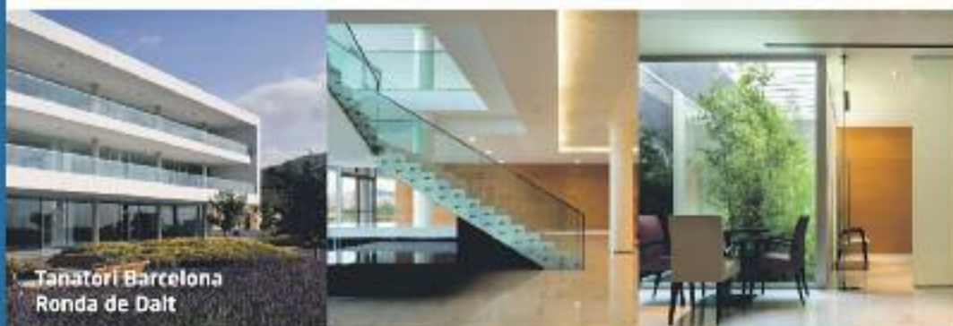
Tanatori Barcelona Ronda de Dalt

A ÀLTIMA preparem i dissenyem els serveis funeraris juntament amb les famílies, adaptant-nos als seus desitjos i a les seves necessitats. Per això, a ÀLTIMA sempre és la família qui decideix l'import total del servei contractat.