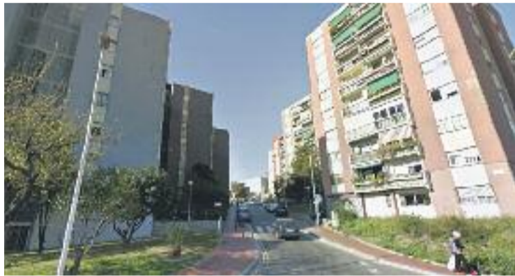
Ciutat Meridiana és el barri més pobre de la ciutat.