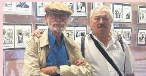
Ferrer, a l'esquerra, en una imatge d'arxiu.

Ferrer també va dirigir la revista juvenil Strong i va ser l'encarregat de descobrir al públic català personatges com Lucky Luke, els Barrufets, Spirou o Jano i Pirluit, entre molts altres.