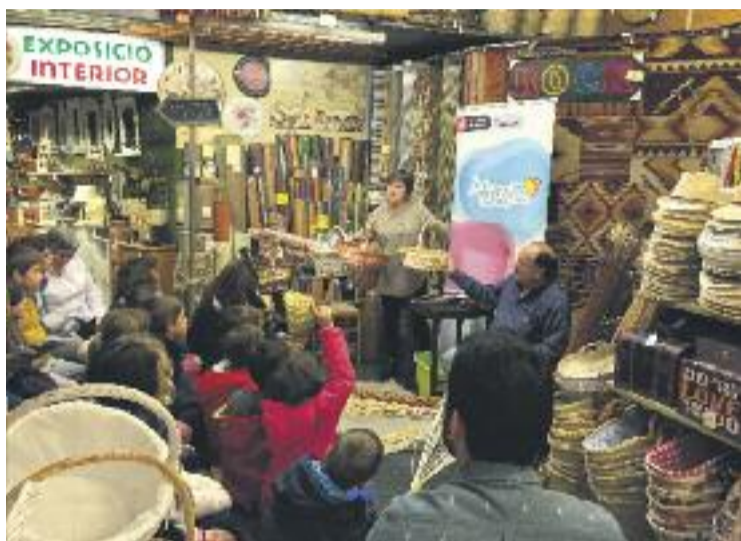
Una imatge de l'edició de l'any passat.

Aquesta experiència subratlla el valor que els comerços emblemàtics representen per a la ciutat, “un element diferenciador” que transmet “una