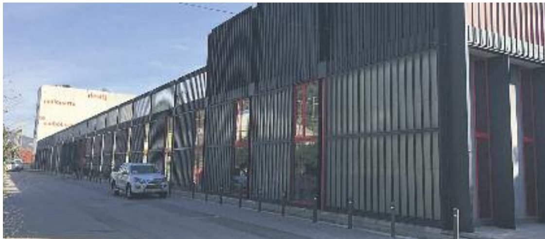
Les jornades se celebraran a l'Ateneu Popular 9 Barris.