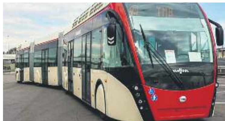
La D40 tindrà busos biarticulats.

L'Ajuntament, amb l'objectiu que la circulació de les noves línies sigui el màxim de fluida possible, pintarà més carrils bus i instal·larà semàfors prioritaris en diferents cruïlles. I és que, actualment, la mitjana diària de velocitat dels busos de la ciutat només és de 12 quilòmetres per hora.