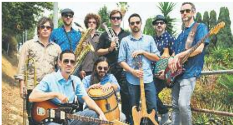
Els Jungle Fire seran un dels protagonistes del Say it loud.

CONCERTS ▶ El desè cicle de música negra Say it loud, que se celebra arreu de la ciutat, arriba a Nou Barris, concretament a l'Ateneu Popular 9 Barris, els dies 27 i 28 d'octubre.