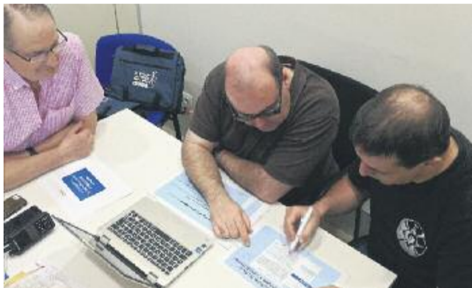
Algunes imatges de les sessions informatives que el Districte ha organitzat amb les entitats.

TECNOLOGIA ▶ El Districte de Nou Barris ha posat en marxa recentment el projecte Nou Barris Digital, que té per objectiu assessorar el teixit associatiu de tots els barris en el procés d'obtenció del Certificat Digital. Es tracta d'un pas necessari per fer avançar les entitats cap a la seva plena autonomia digital, totalment indispensable avui en dia.