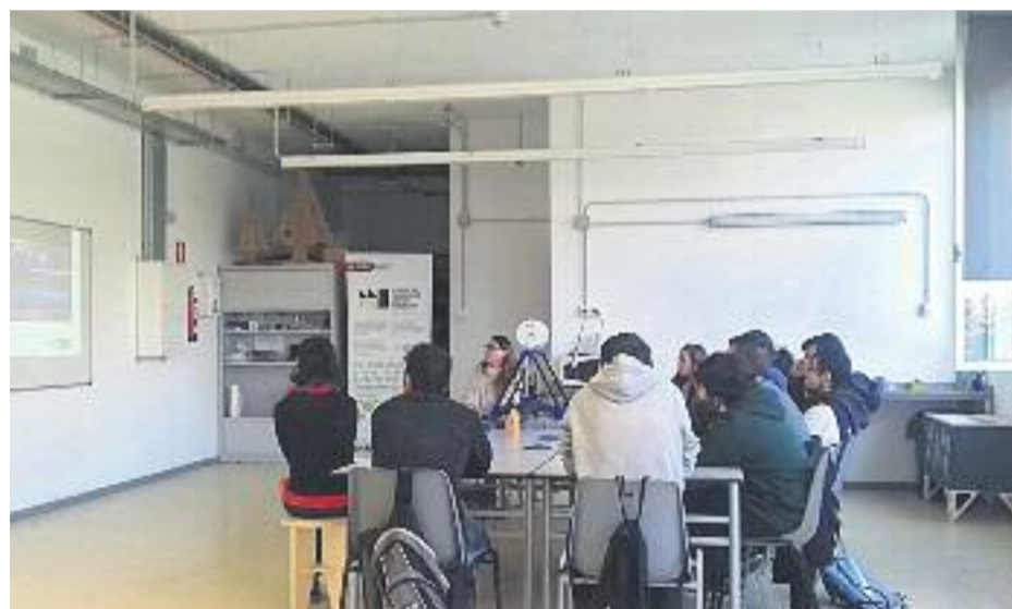
El pla vol potenciar el desenvolupament econòmic del districte.

ECONOMIA ▶ Nou Barris és un dels districtes de la ciutat que ha patit amb més duresa la crisi econòmica i que presenta uns indicadors econòmics més negatius. Per combatre aquesta situació, recentment s'ha presentat el primer Pla de desenvolupament econòmic de Nou Barris, que prioritza mesures de foment de l'ocupació, el desenvolupament econòmic i de dinamització del comerç de proximitat, l'impuls de l'economia social i solidària i la creació de nous models de lideratge públic.