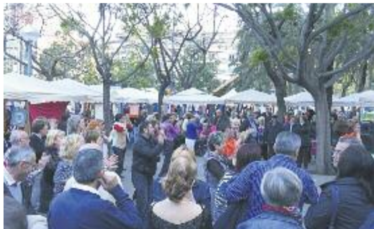
Una fira comercial a Lluçmajor de l'any passat.

Tornant a la Festa Major, diumenge 14 de maig la plaça Major de Nou Barris acollirà la 17a Mostra de Mercats, amb un tast solidari a favor de l'entitat ASENDI, que treballa amb persones discapacitades.