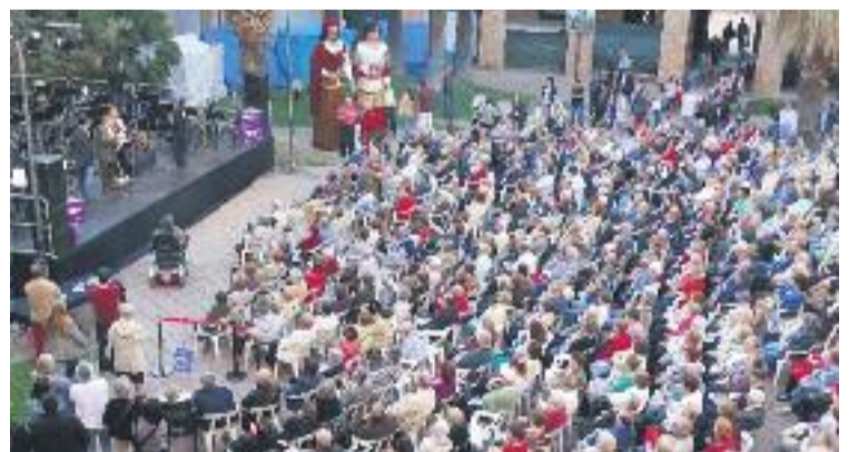
Una foto de la Festa Major de l'any passat.

CELEBRACIÓ ▶ El districte ja escalfa motors per a una nova edició de la seva Festa Major, que es posarà en marxa el pròxim dia 9 de maig i acabarà el dia 14 del mateix mes.