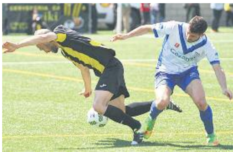
Els de la Prosperitat afrontaran un final de curs frenètic.

I és que en aquestes darreres tres jornades, després de les derrotes al derbi contra l'Europa,