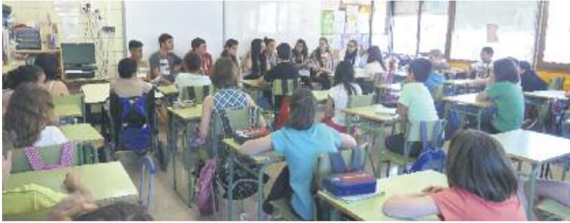
Un 20,6% dels alumnes d'ESO no va superar les proves de competències bàsiques.

ENSENYAMENT ▶ L'informe 'Oportunitats Educatives a Barcelona 2016', encarregat per l'Ajuntament i que s'ha publicat aquest mes d'abril, mostra com la renda disponible té una relació directa amb els resultats acadèmics.