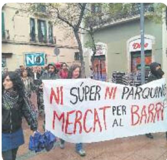
Imatge de la manifestació del dia 1.

COMERÇ/ La manca de transparència que segons Gràcia on vas? i l’Assemblea de Barris per un Turisme Sostenible (ABTS) hi ha en la reforma del mercat de l’Abaceria ha fet que aquestes dues entitats hagin portat el projecte a la Síndica de Greuges de la ciutat i al Síndic de Greuges de Catalunya.