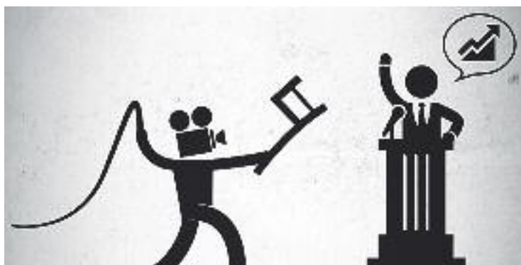
El festival arriba enguany a la seva onzena edició.

CINEMA ▶ L'onzena edició del Festival Internacional de Curtmetratges Socials Solo para Cortos ja és a punt de començar.