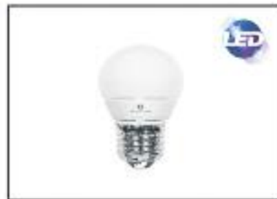
Esferica LED -SMD Potencia 4w Lúmenes 300-voltage 220v Angulo 270°-Base E-27-E-14. Color :3000k-y 6600k Vida Util 30.000h draf.