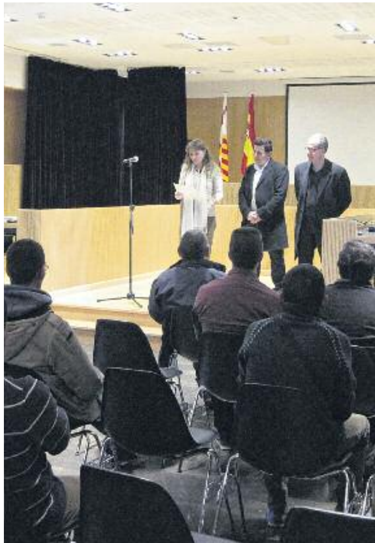
Diferents moments de l'acte de lliurament de les certificacions que es va celebrar el passat 2 de març.