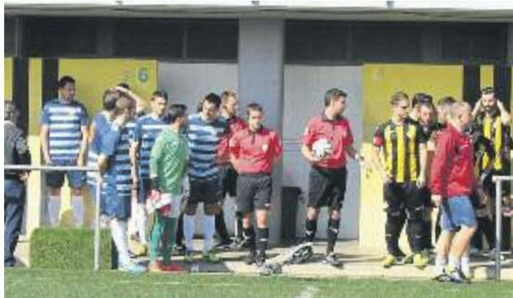
La Monta no ha perdut encara a casa.

Ja a la segona meitat, Albarrran va fer el segon gol dels del Penedès amb un centre-xut des de la banda dreta que es va empassar Burgada. Quan faltaven pocs minuts per a l'acabament del matx, el pitxitxi de l'equip, Pedro García, va sortir al rescat i va