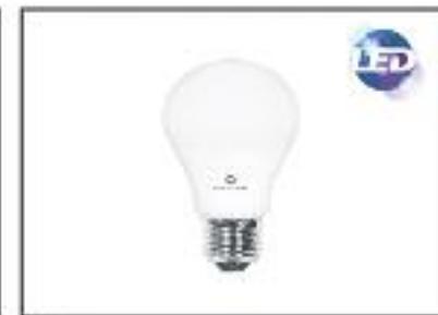
Estandar LED-SMD Potencia 9w Lúmenes 820-Voltage 220v Angulo 270° -Base E27 Color 3000k y 6600k Vida Util 40.000h ledmundo