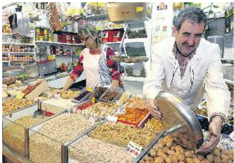
El futur dels mercats serà la temàtica principal del congrés.