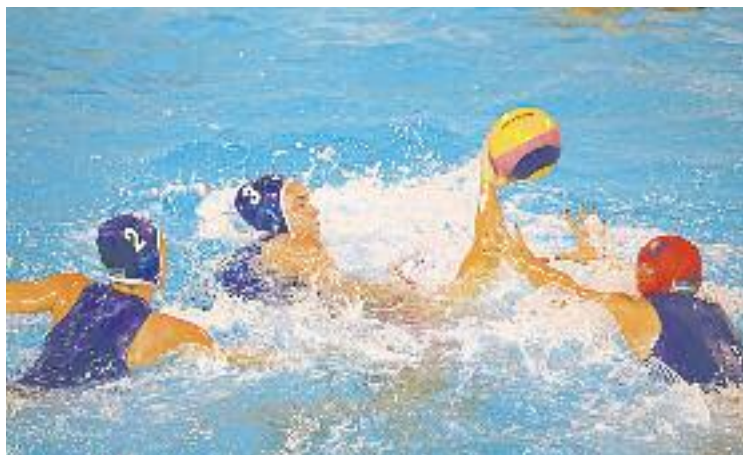
La ciutat tornarà a acollir l'europeu de waterpolo.

WATERPOLO ▶ La setmana passada la Lliga Europea de Natació (LEN), va fer oficial la designació de Barcelona com a seu de la 33a edició del Campionat d'Europa de Waterpolo de l'any 2018. D'aquesta manera, les piscines Picornell seran l'escenari d'un torneig on hi participaran prop de 30 seleccions nacionals masculines i femenines durant dues setmanes.