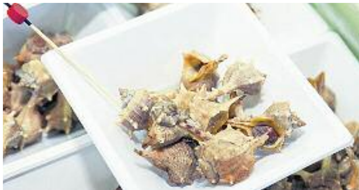
Nou Barris enceta dues rutes de tapes aquest mes de març.

En el cas de la Pinxu-Panxo, enguany viurà la seva segona edició amb novetats respecte a la de l'any anterior: tot i que perd un dels seus cinc itineraris –la ruta taronja–, el nombre de participants ha augmentat fins als 39. A més, la Pinxu-Panxo comptarà amb la participació especial de l'Elvis Home BCN, el primer bar temàtic de la ciutat sobre la figura del mític cantant.