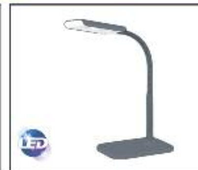
Flexo de LED Potencia 3W, Lúmenes 360, 220V, Angulo 80, Color 3000k, Vida útil 30.000h