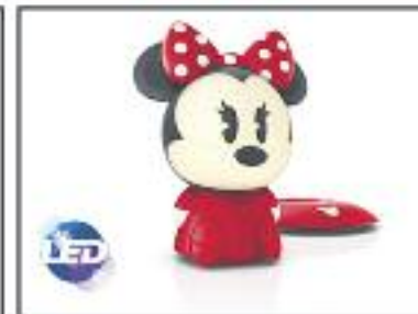
Un pequeño amigo .MINNIE MOUSE PHILIPS LEDS , se carga por inducción en la base , se enciende al inclinarla , varios modelos