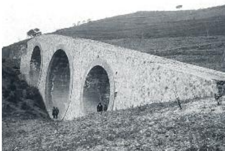
Una imatge antiga del Pont dels Tres Ulls.

L'actuació consisteix en la recuperació de dues feixes agrícoles -s'hi plantaran arbres fruiters- que actualment estan en desús i que permetran enllaçar la Casa de l'Aigua, que també ha estat recuperada, amb el castell de Torre Bar, també remodelat fa molt poc. L'enllaç es farà a través d'un camí que unirà els carrers de Riudecanyes amb el d'Aiguablava i l'objectiu de l'Ajuntament és