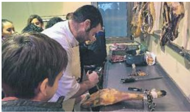
Enguany s'han realitzat 233 visites a botigues de la ciutat.

Un altre aspecte del programa educatiu és el Premi Punt de Llibre, un guardó que premia els 12 millors dibuixos sobre el comerç de proximitat que realitzin els infants. Les imatges guanyadores es convertiran en punts de llibre que es repartiran durant Sant Jordi.