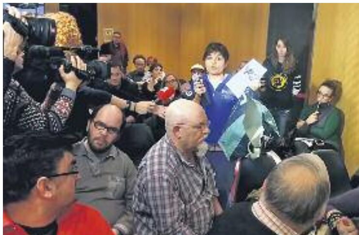
Imatge d'una de les intervencions durant el Ple.

Durant la seva intervenció, marcada per l'ambient tens a la sala, també es van poder escoltar crits i desqualificacions contra Rognoni. Tot això va ser després d'una primera topada entre els veïns i la presidenta del Dis-