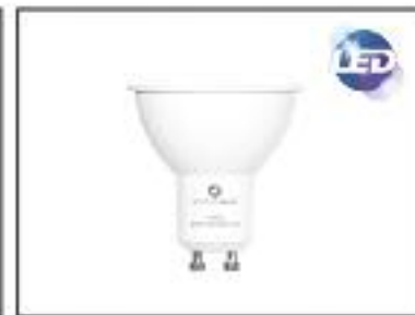
DICROICA LED SM-Potencia 4w Lúmenes 340-Voltage 220V Angulo 120°-Base GU10-G6.3 Color 4000k Vida Util 30.000h Ledesma