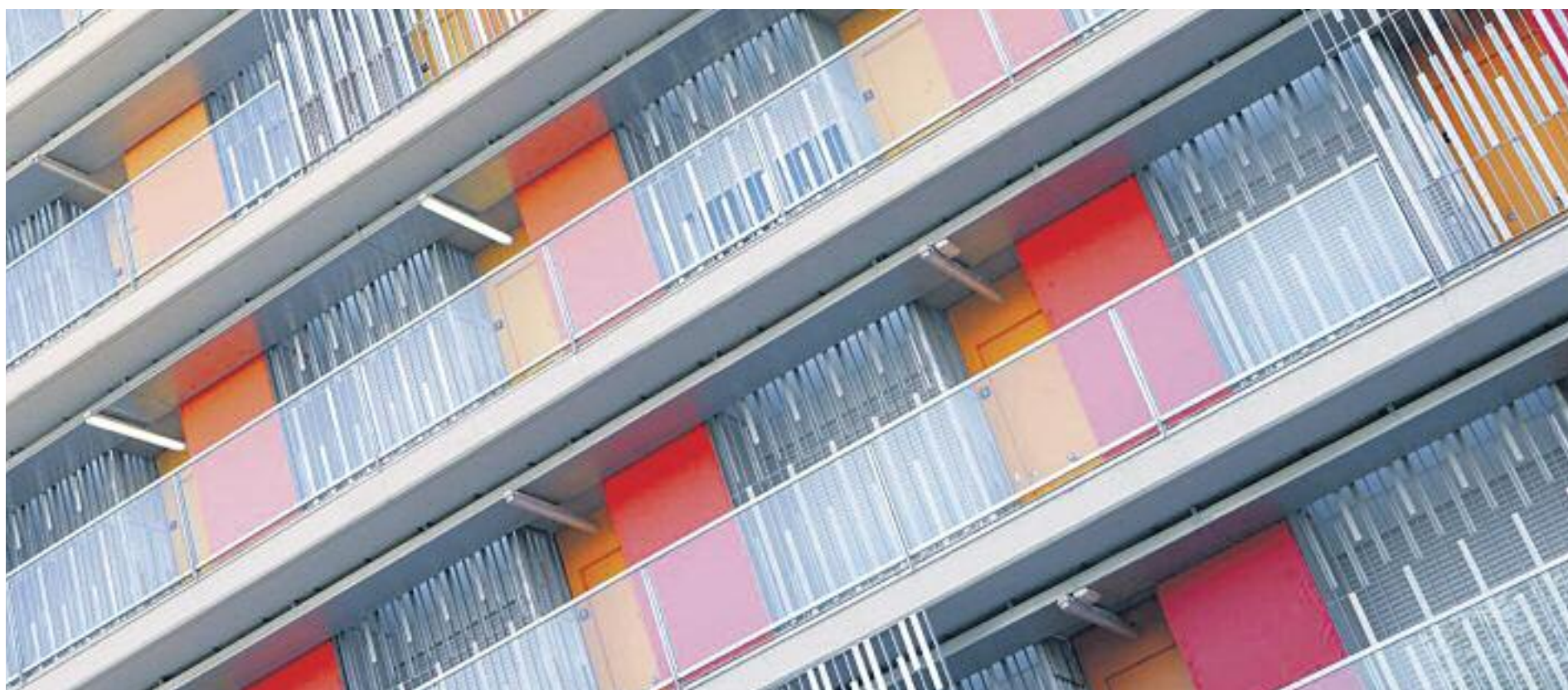
La problemàtica de l'habitatge és una de les cares més dramàtiques de la crisi.