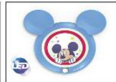
Detector de movimiento infantil luz nocturna PHILIPS LED. Sensor de día y de noche LED incluido. varios modelos y colores