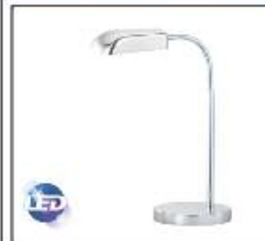
Flexo de LED Potencia 4,2W. Lúmenes 240, 220V, Angulo 80, Color 3100k. Vida útil 20.000h