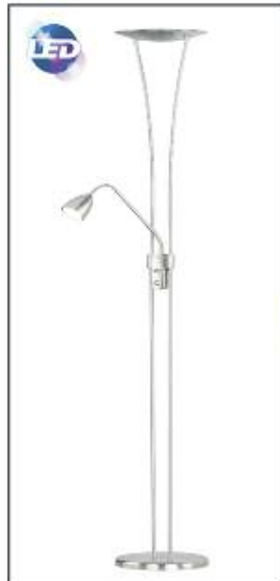
Pie de salón LED Potencia 20w 1200 lúmenes y 6w 460 lúmenes Regulable,220v Color Niquel Satinado