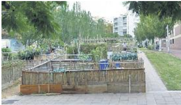
Els horts ocupen el solar des de fa més de cinc anys.

Serà demà a partir de dos quarts de dotze del matí quan tindrà lloc a la Ciutat de la Justícia la vista judicial després que el passat mes de setembre els veïns que gestionen l'hort van rebre la visita d'una secretària judicial que els hi va entregar la denúncia. Fins aquell dia no hi havia hagut cap problema, però ara, afirmen des de l'Associació de Veïns de Porta, "el moviment de la constructora possiblement té a veure amb els múltiples fronts oberts que té