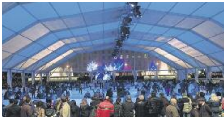
Els botiguers van repartir 600.000 vals de descompte per a la pista.

OCI ▶ Per quart any consecutiu, BarGelona, la pista que ocupa cada Nadal la plaça Catalunya a iniciativa de la Fundació Barcelona Comerç, ha augmentat en visitants i usuaris, tal com informa la fundació.