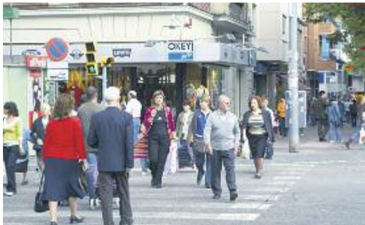
La campanya va començar a les Roquetes.

La campanya porta com a lema La diversitat combina bé , i consisteix en el repartiment de 85.000 posavasos i 216.000 es-