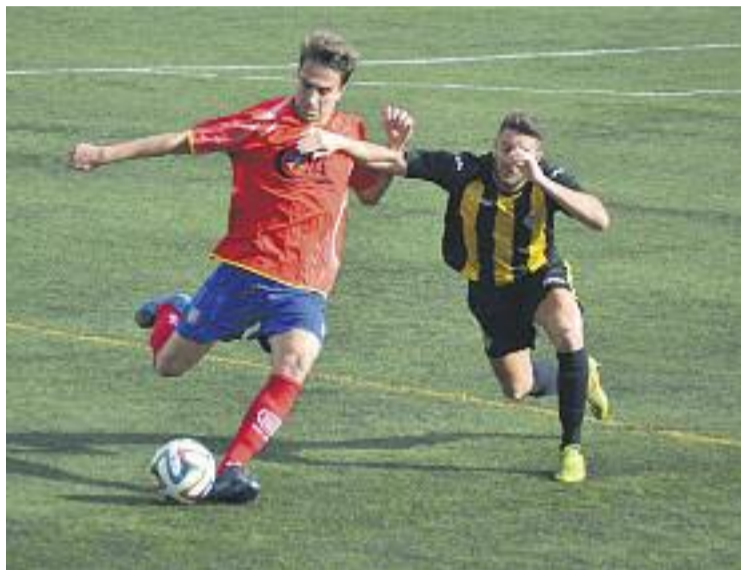
La Monta va aconseguir la seva segona victòria a domicili.

Les dues anotacions del partit van arribar durant els últims instants dels dos temps. El primer al minut 43, quan Joshua va rebre una pilota a l'espai a l'àrea del Martinenc i va desfer-se del defensa amb un gran regat, que el va habilitar davant del porter Carulla, al qual va batre per sota. El segon gol va arribar al minut 84 del partit, quan el mateix Joshua es va vestir de Messi iniciant una jugada individual des de la línia del mig del camp, superant un total de cinc rivals i fent una pas-