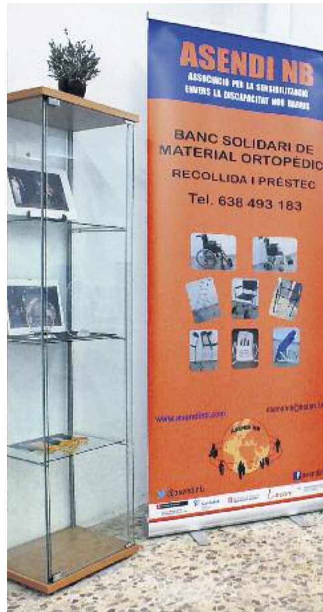
Les cadires de rodes i els llits ortopèdics formen part del material del banc.