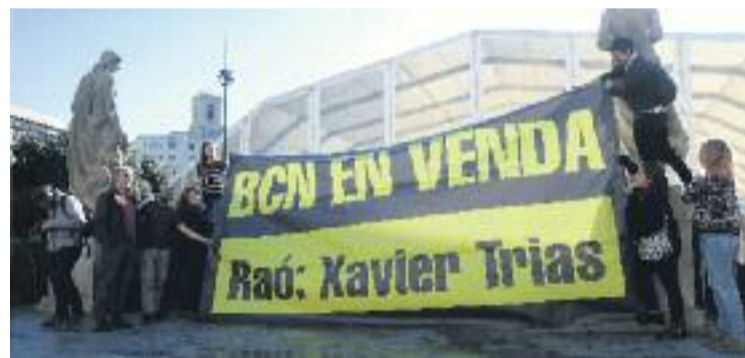
Imatge de la protesta dels integrants dels JEV.

POLÈMICA ▶ La pista de gel Barcelona de plaça Catalunya, una iniciativa que posa en marxa la Fundació Barcelona Comerç des de fa quatre anys durant les dates de Nadal, comptarà amb una aportació econòmica de l'Ajuntament, concretament de 243.000 euros, procedents de la taxa turística.