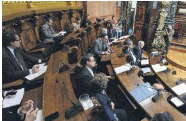
Govern i oposició van evidenciar el seu distanciament.