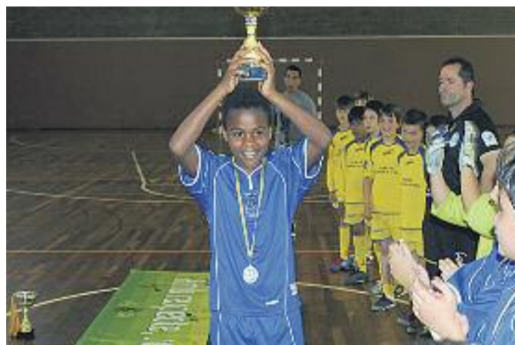
Enguany hi ha 60 equips més inscrits a les lligues escolars.

ESTADÍSTICA ▶ Un total de 1.752 equips d'arreu de Barcelona han tramitat les seves inscripcions per participar en la primera fase de la lliga dins del programa dels diferents esports del Consell de l'Esport Escolar de Barcelona (CEE). Això representa un increment de 60 equips –un 3,5% més– respecte a l'any passat.