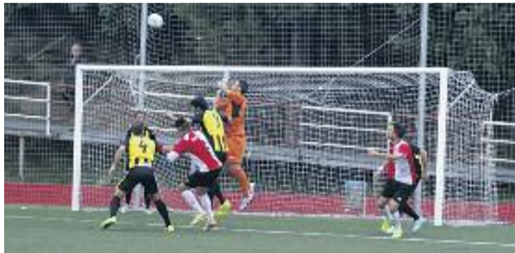
El Rubí és l'actual líder del grup 5 de Tercera.

Diumenge passat els de Toni Escudero van intentar per tots els mitjans fer l'empat, però la falta d'encert va truncar les expectatives dels barcelonins, que ara per