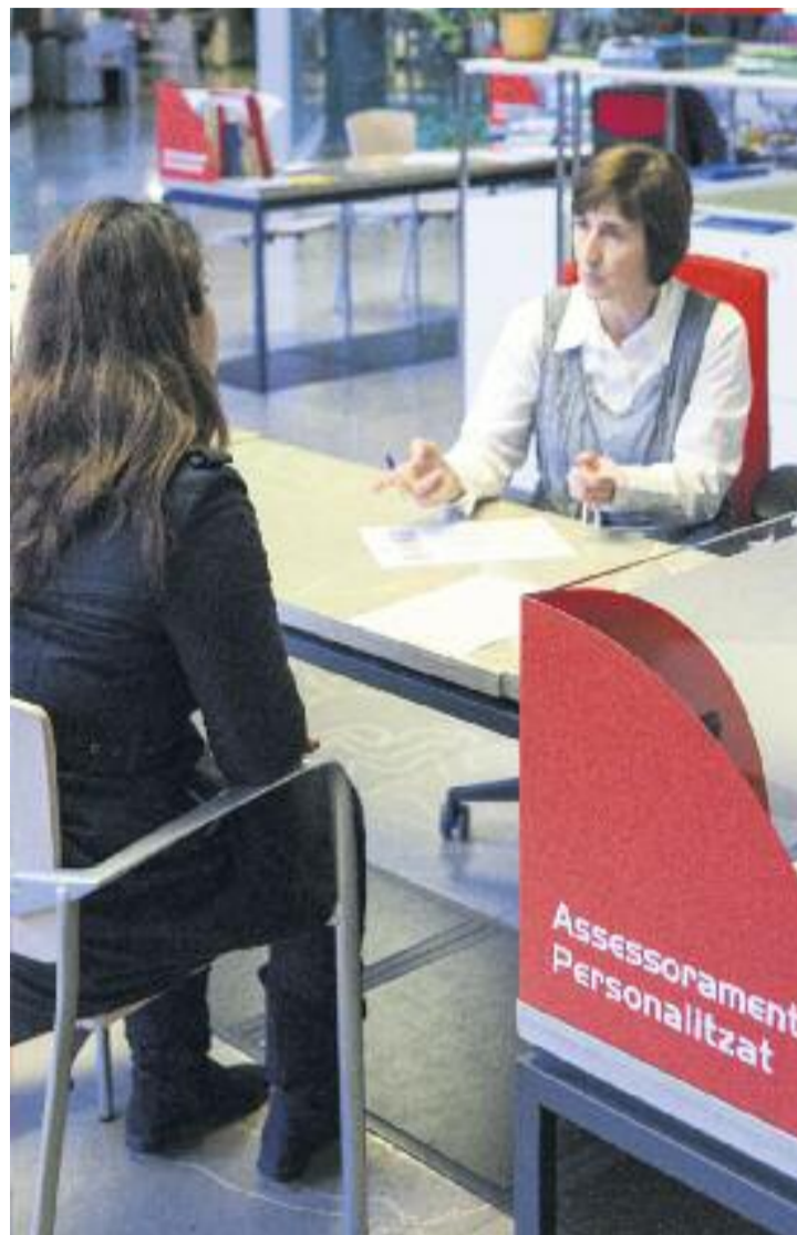
Els programes, gestionats des de Barcelona Activa, ofereixen formació i atenció personalitzada.