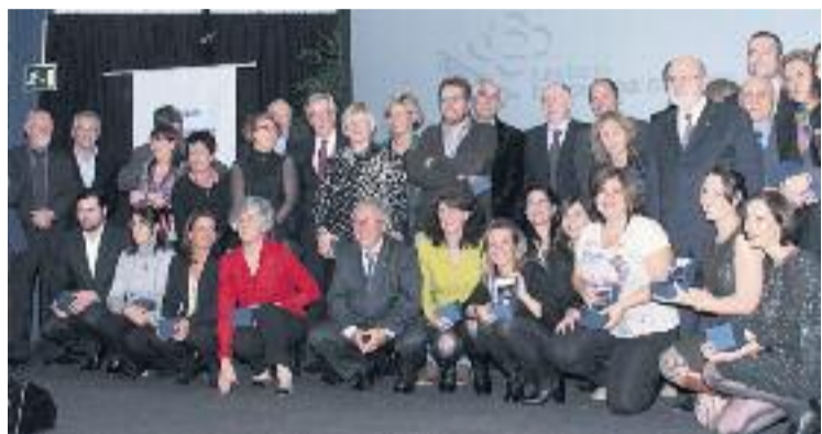
Foto de família dels dinamitzadors guardonats.

» L'organització premia la tasca dels 18 dinamitzadors dels eixos que la conformen durant un sopar commemoratiu de celebració