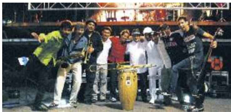
La banda destaca per la seva vitalitat a dalt l'escenari.

MÚSICA ▶ La Sonora Libre Orquestra de Salsa & Jazz Llatí serà el pròxim dia 21 de novembre a l'Ateneu Popular 9 Barris per presentar en exclusiva el seu nou disc Más Que Salsa .