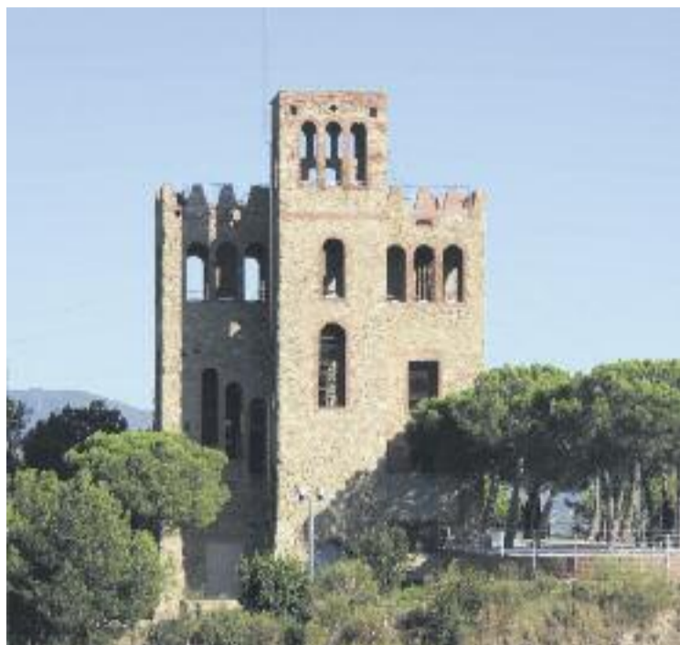
Imatge del castell de Torre Baró un cop reformat.