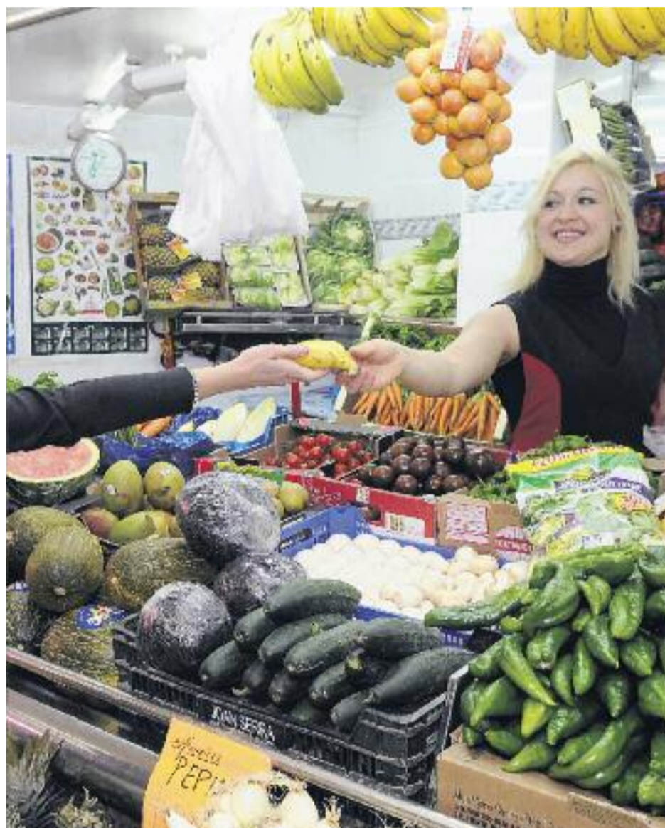
El Pla de Comerç vol fomentar l'associacionisme entre els comerciants que no pertanyen a cap eix o associació.