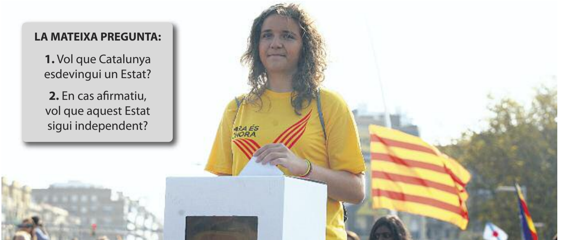
Artur Mas assegura que el dia 9 de novembre hi haurà "locals, urnes i paperetes" per votar la pregunta acordada des d'un principi.