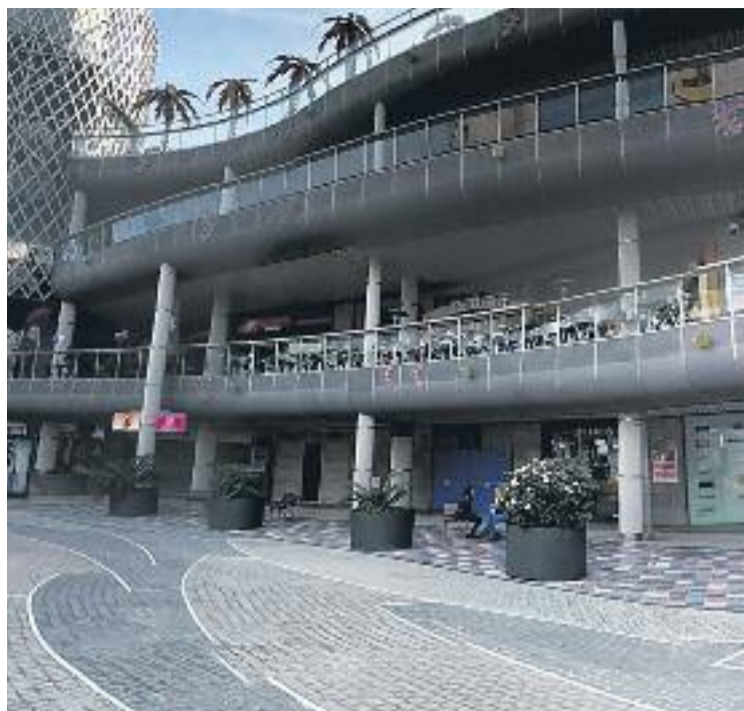
L'ampliació comercial es projecta en 6.000 metres quadrats.