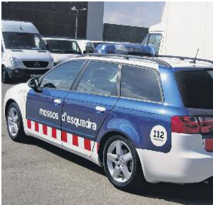
Els Mossos van detenir l'atracador després d'una persecució.