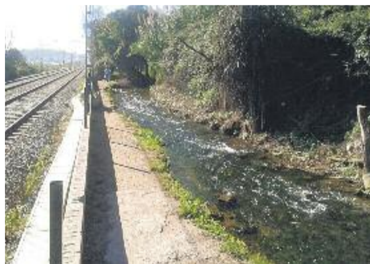
Les obres permetran fer el camí més ample.

Les obres tenen un pressupost estimat de 650.000 euros.