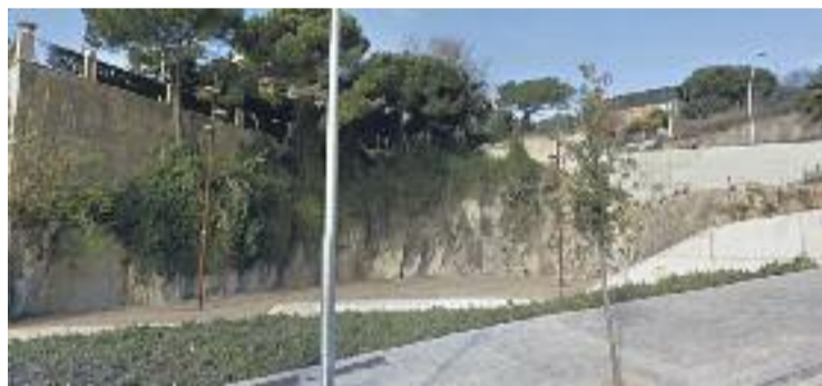
Parcel·la on hi queden restes de l'antiga pedrera.