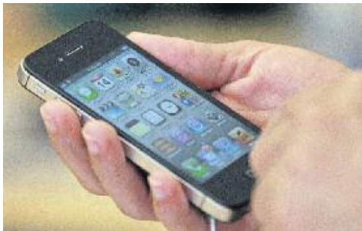
Sants-Les Corts també participa en el 'Comerç en xarxa'.

“El nostre projecte és més ampli”, assegura a aquesta publicació Josep Escofet, president de l'eix comercial Sants-Les Corts, que puntualitza que