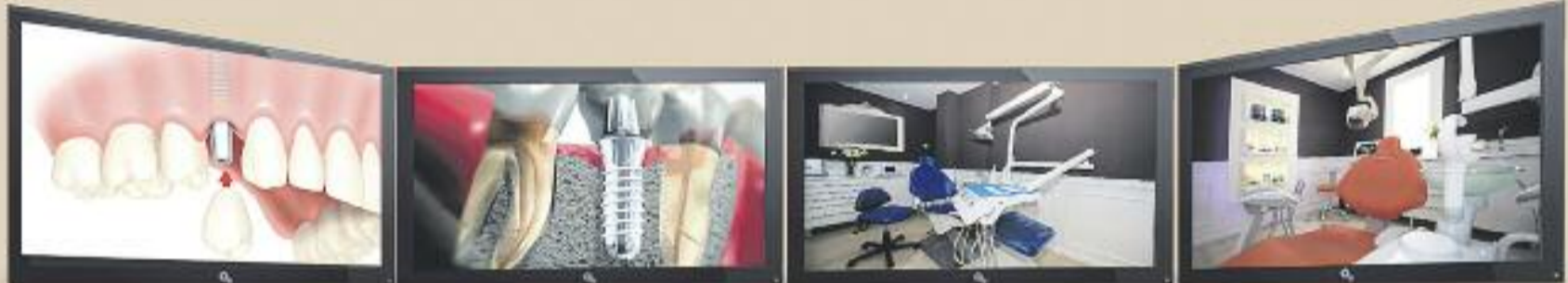
Implantologia Dental - Fobia Dental - Prótesis Dental - Ortodoncia Invisible - Odontopediatria - RX

CENTRE DE DISSENY DENTAL DISSENY DEL SOMRIURE ESTÈTICA FACIAL