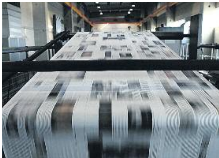
La publicació Línia Les Corts va ser fundada l'any 2005.

D'aquesta manera, Línia és la capçalera gratuïta local no diària amb més difusió de Catalunya. Si se suma la difusió total de setembre a novembre,