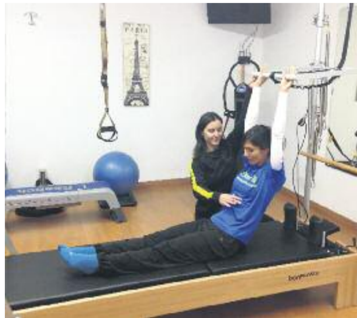
La sala de SYGYM Les Corts, totalment equipada per a l'entrenament personal.

A SYGYM vénen persones de totes les edats, però el perfil més habitual és una persona d'entre 40 i 65 anys que valora molt la seva salut. El client més jove té 14 anys i la senyora Mercè, que té 86 i ja fa tres anys que està amb nosaltres.