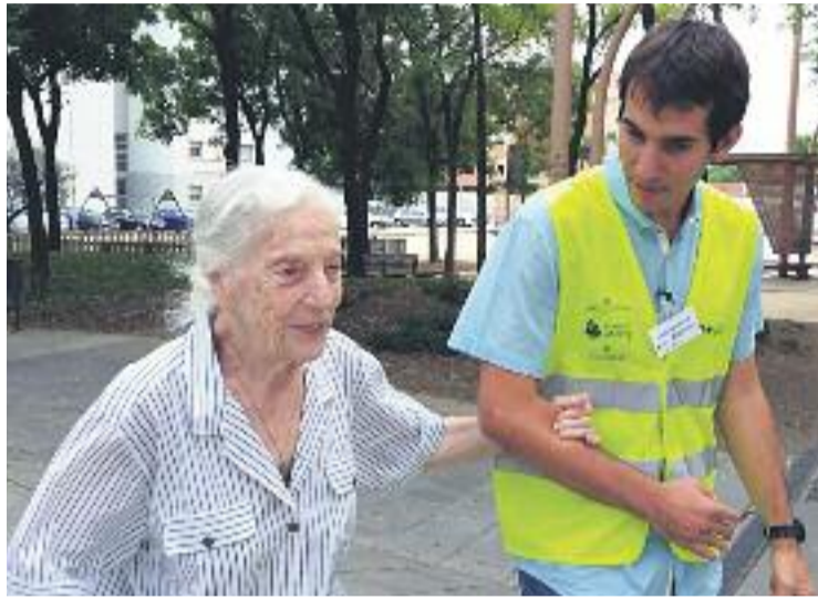
El paper dels voluntaris és bàsic per al projecte.

Per aconseguir els seus objectius el projecte, impulsat per l'Ajuntament, aposta per l'acció comunitària i la implicació de ciutadans voluntaris, veïns, i professionals de les entitats i dels comerços de proximitat. En el cas del barri de les Corts l'objectiu és arribar a la població major de 65 anys, formada per més de 10.000 persones. D'aquestes, quasi 1.400 són més grans de 75 anys i viuen soles a la zona ubicada entre Travessera de les Corts, Gran Via Carles III, av. Madrid i Riera Blanca.