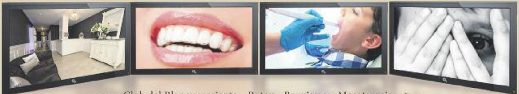
Diseño de la Donrisa - Club del Blanqueamiento - Botox - Bruxismo - Mesoterapia - Relleno Labial

“...porque no somos los únicos, decidimos ser los mejores...”