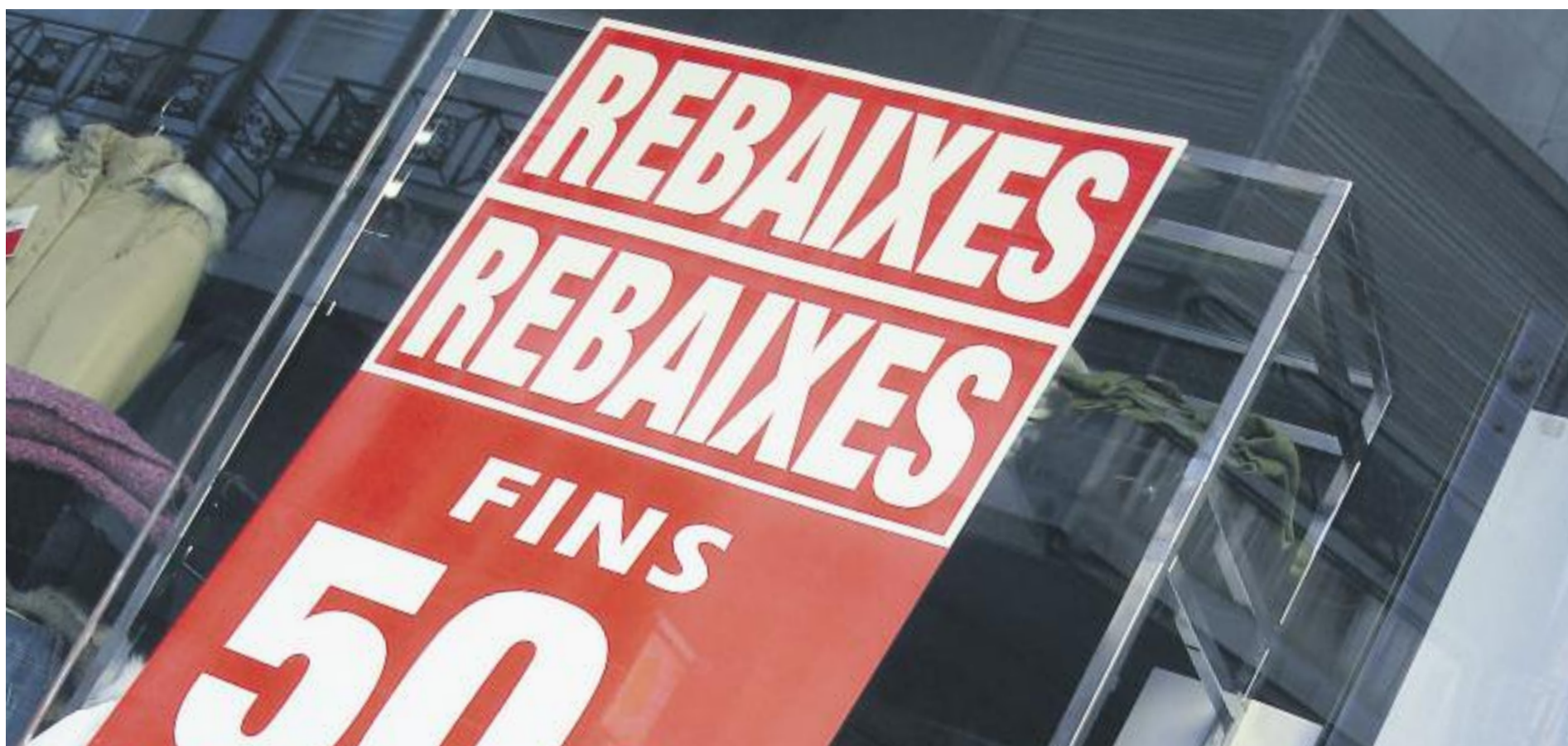
El comerç preveu una facturació de 825 milions d'euros durant les rebaixes d'hivern.