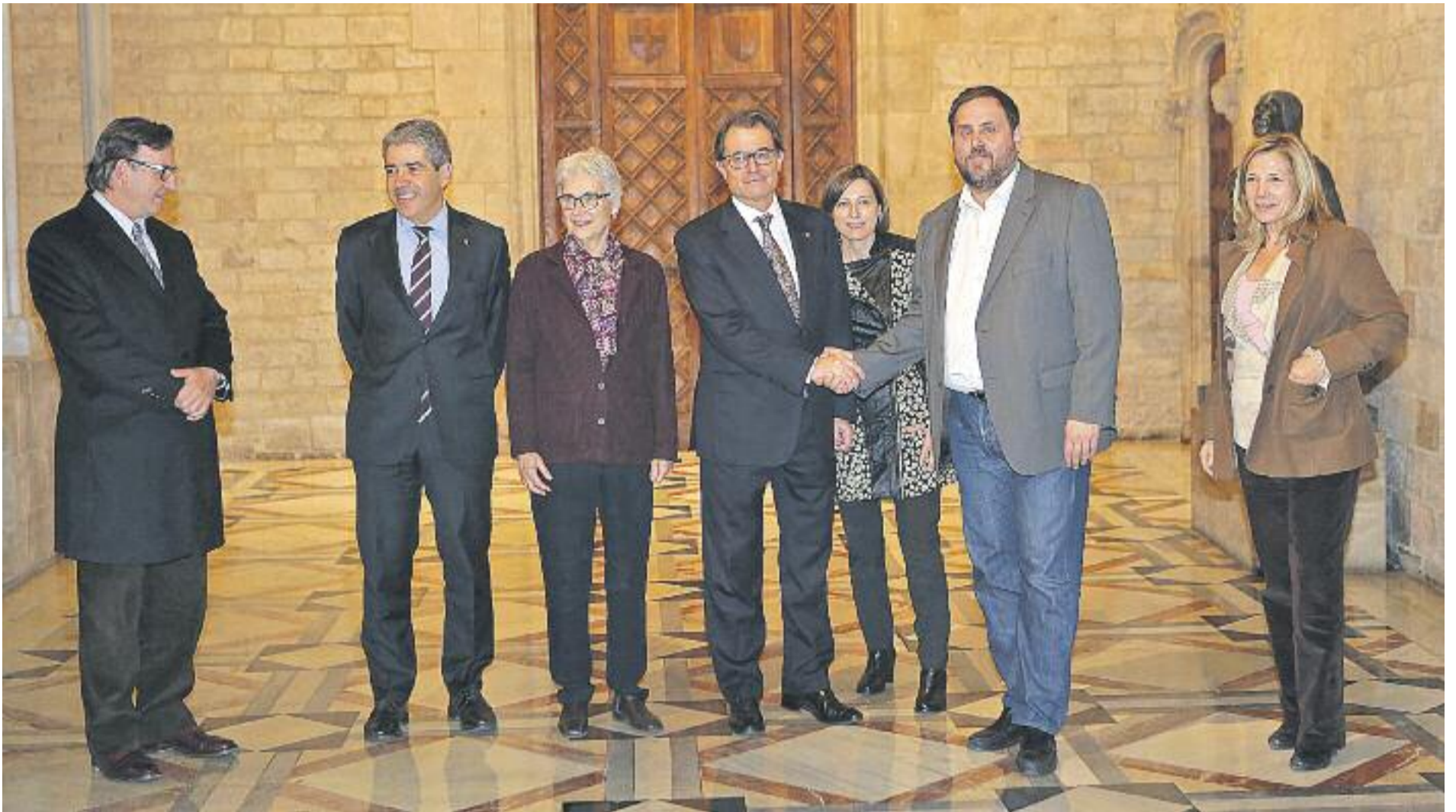
Mas i Junqueras van tornar a protagonitzar una imatge d’entesa el passat dimecres 14 de gener.

» Mas i Junqueras refan la unitat “per portar el procés de transició nacional fins a la victòria” » L’acord prioritza la creació d’estructures d’Estat des d’ara fins a les eleccions del 27 de setembre