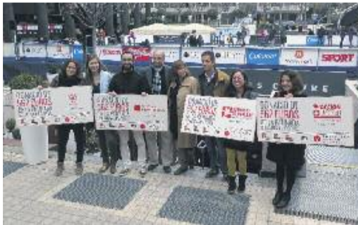
Els diners recaptats es van lliurar fa uns dies al mateix centre.

Per altra banda, el Pedralbes Centre va estrenar abans-d'ahir una nova botiga efímera o pop up, The Box, un espai de venda d'últimes tendències que “presenta una nova filosofia de comerç”, segons els promotors.