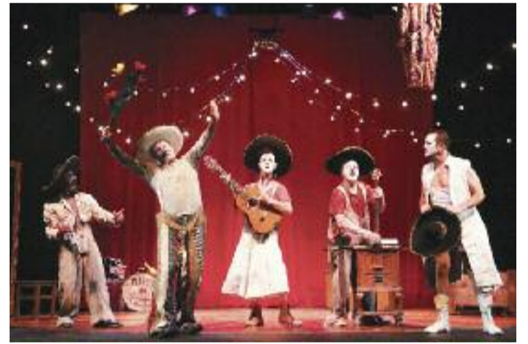
Actors de l'obra 'Gran reserva', al Teatre Borràs.

Però aquesta no és l'única iniciativa cultural. El Departament de Cultura i el Consell Nacional de la Cultura i de les Arts, creadors del Cens d'Artistes, també estan treballant en la creació del cens de tècnics i gestors culturals i en el de les entitats, institucions i empreses de la cultura. Per donar-los a conèixer tots tres, pròximament es faran actes culturals arreu de Catalunya.