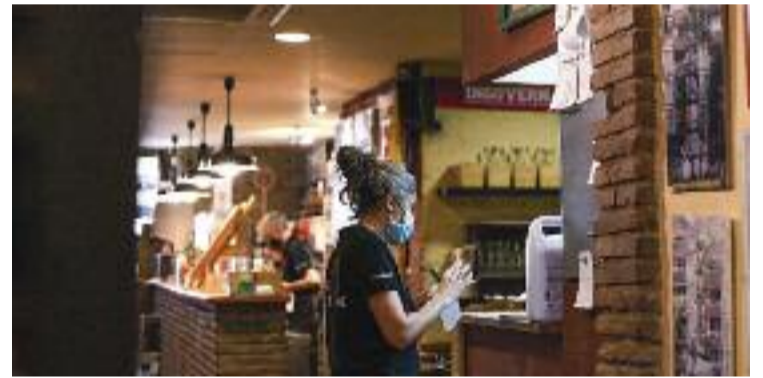
La restauració, un dels sectors que més ha patit la pandèmia.

AJUTS ▶ Un fons extraordinari de vint milions d'euros per donar suport als sectors econòmics que més han patit les conseqüències de la Covid-19: això és 'ReActivem Barcelona', un recurs que ha de donar un respir al comerç, la restauració i el turisme.