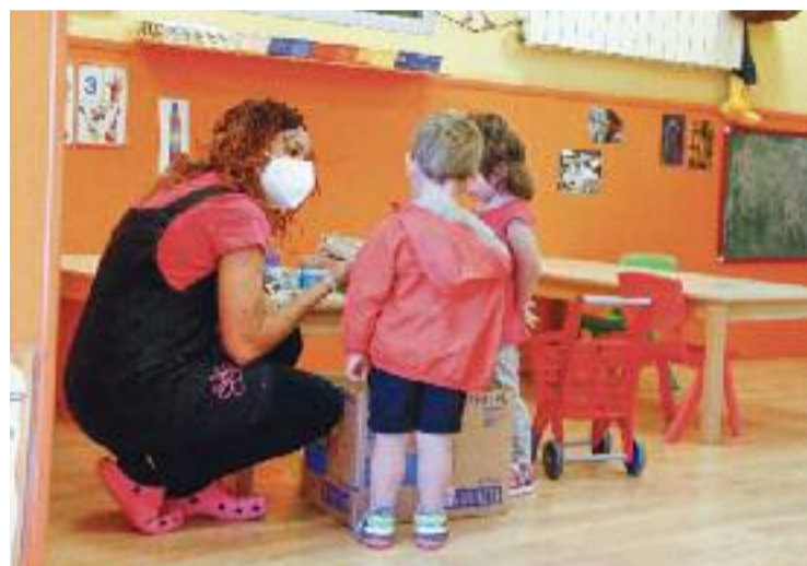
Professora i dos infants a una escola bressol.

Mentrestant, la trobada de les escoles de música va girar, sobretot, al voltant de la importància de fer les classes presencials. Precisament per això, perquè la pandèmia ho ha impedit, la nota va quedar un pèl més baixa, en un 8,1. Un notable alt que remarca la feina d’ambdós tipus de centres, tot i les dificultats que els ha posat la situació epidemiològica.