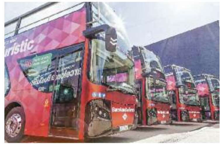
El servei ha tornat a funcionar aquest estiu després d'un any.

Quant a la sostenibilitat del servei, s'ha apostat per fomentar l'ús del transport públic en les visites, acostant les rutes a estacions com les de Sants o la Sagrera. Per últim, hi ha el compromís que els nous vehicles que s'incorporin a la flota siguin menys contaminants.