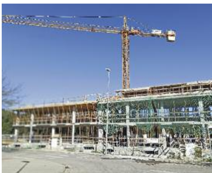
Es vol quintuplicar el pressupost de l'Agència de l'Habitatge.