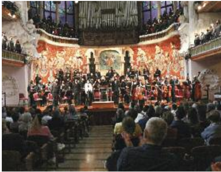
El Palau de la Música durant un concert.

Mentrestant, aquells qui vulguin demanar diners per recuperar-se dels efectes de la Covid-19, hauran d'acollir-se a les con-