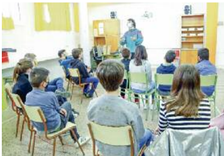
Les classes, en grups reduïts i amb mascareta.

Si els casos de coronavirus pujaven a la comunitat, als centres també. Per això, el moment amb més grups confinats va ser