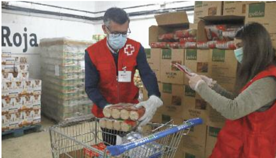
El departament de Drets Socials considera la pobresa "un problema multifactorial".

» El Govern aposta per aplicar "accions coordinades" amb les entitats » L'objectiu és millorar la qualitat de vida dels més vulnerables