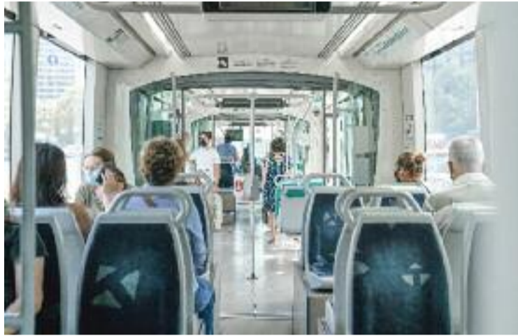
L'ATM vol guanyar-se de nou la confiança dels usuaris.

D'altra banda, el Consell de Mobilitat de l'ATM ha aprovat defi-