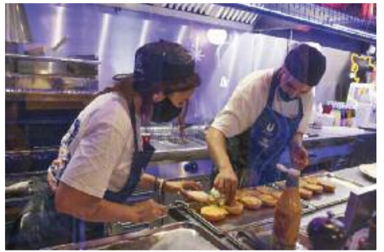
Dos treballadors d'un restaurant amb mascareta.

versió d'empreses catalanes en àmbits com la sostenibilitat, el medi ambient, la innovació o la digitalització de l'economia. En aquest sentit, la Generalitat també ha apostat per millorar les condicions del recurs, allargant el termini de tornada dels crèdits de cinc a deu anys i ampliant la carència fins a un màxim de dos anys. Aquestes modificacions també estaran disponibles per a totes aquelles companyies i autònoms que ja siguin beneficiaris d'un préstec ICF Crèdit Covid 19, de manera que es podrà pactar un refinançament d'operacions vigents per adaptar-les als nous canvis.