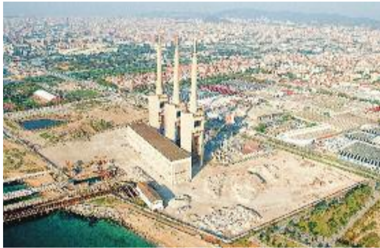
El 'hub' a les Tres Xemeneies és un dels projectes que opta als fons.