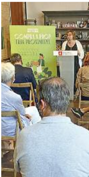
La presentació.

En aquest sentit, el consistori insisteix que "la lluita contra la desocupació i la precarietat és una prioritat absoluta del govern municipal" i recorda que, en els últims anys, ja s'han fet moltes accions en aquesta línia.