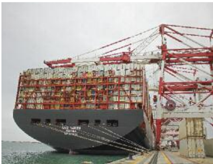
Un vaixell amb contenidors atracat al port barceloní.