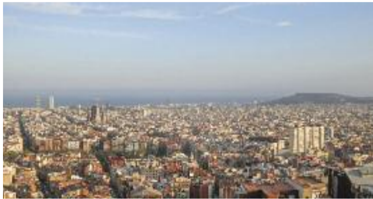
La ciutat està veient una millora en les xifres de l'atur.

Aquest acord ha de definir un full de ruta per als pròxims deu anys en matèria d'ocupació, incloent-hi perspectives de transformació social, sostenibilitat, innovació i abordatge de les desigualtats socials que compliquen l'accés al mercat laboral. Per assolir els objectius, es promourà la implicació de tots els agents socioeconòmics i la coordinació entre les diferents