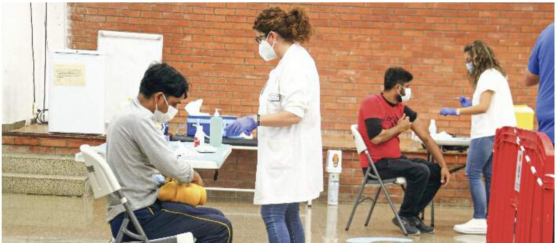
Ja s'han injectat més del 90% de dosis rebudes des de l'inici del procés de vacunació.