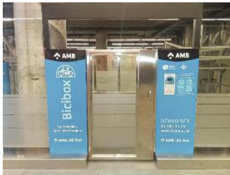
S'ha instal·lat a l'estació del Parc Logístic de la Zona Franca.