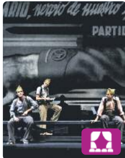
In memoriam Lluís Pasqual

La Kompanyia Lliure torna a representar un retrat fidel i realista de la Batalla de l'Ebre, quan milers de joves de 17 i 18 anys van ser cridats a files per protagonitzar una de les batalles més llargues i cruentes de la Guerra Civil. Un homenatge als nois de la generació de la Quinta del Biberó.