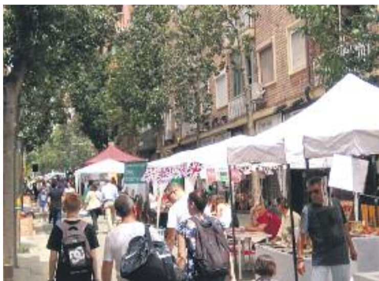
Un moment de la fira de dissabte passat.

La Mostra, com ja s'havia anunciat, també va servir com a acte de cloenda del projecte Fu-