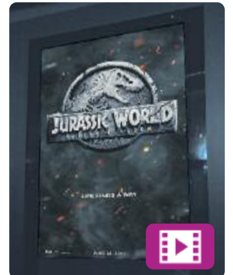
Jurassic World: el regne caigut Juan Antonio Bayona

El director barceloní Juan Antonio Bayona dirigeix l'última entrega de la popular saga de pel·lícules de dinosaures. En aquesta entrega, una erupció volcànica amenaça els dinosaures restants a l'illa Nublar, on les criatures han vagat lliurement durant anys després de la desaparició del parc temàtic Jurassic World .