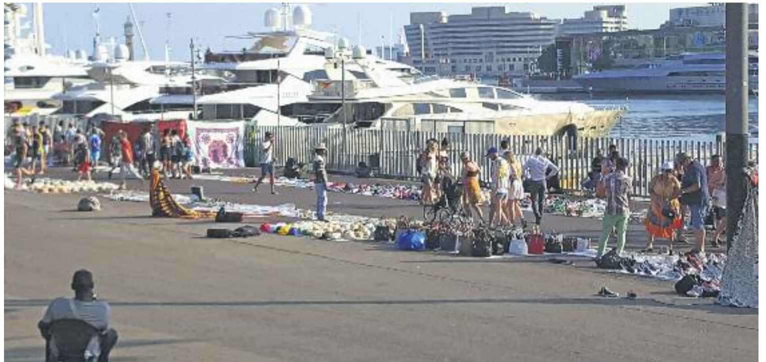
La venda ambulants il·legal, diuen els comerciants, ha augmentat en els últims anys.