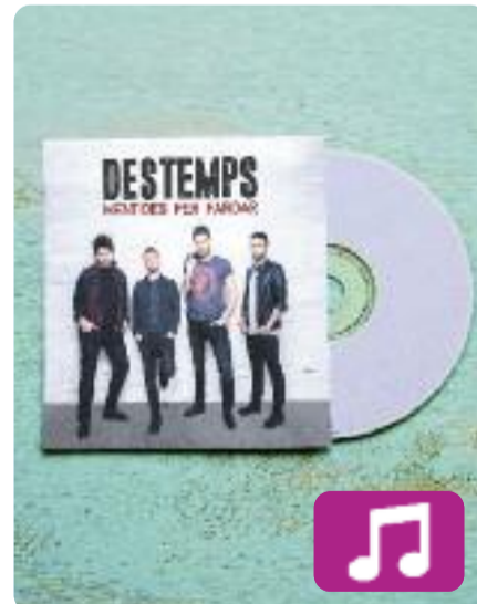
Mentides per fardar Destemps

Guitarras descarades, lletres de carrer i melodies addictives. En tres paraules, rock and roll. Això és Mentides per fardar (RGB Suports, 2018), el primer disc d'estudi de Destemps.