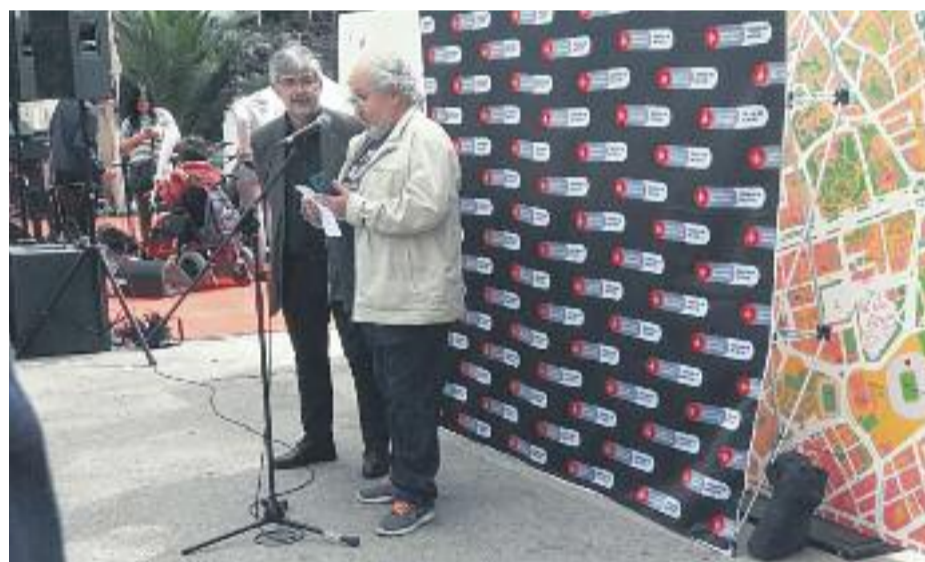
Una imatge de la presentació de la segona edició del llibre 'El comerç de tota la vida'.

COMERÇ ▶ Més de cent establiments arrelats al territori des de fa més de 40 anys, amb segell propi i personalitat. Restauració, moda, estancs, salut i alimentació, són alguns dels sectors recollits en la nova publicació 'El comerç de tota la vida', que destaca, a més, els establiments emblemàtics i els de comerç verd. Es tracta d'un nou homenatge al comerç de proximitat de les Corts. Un comerç que desenvolupa un paper fonamental en l'economia local i contribueix a la cohesió i a la integració social del seu entorn.