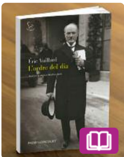
L'ordre del dia Éric Vuillard

L'any 1933, diversos industrials alemanys d'empreses com Opel, Krupp, Siemens o Telefunken van assistir a una reunió on Hitler els va demanar que financessin la campanya nazi a canvi d'una suposada estabilitat.