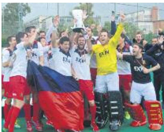
La consecució de la lliga tanca una temporada excel·lent per als dos equips del club.

Aquest partit pel títol es va disputar l'endemà a dos quarts de quatre de la tarda. Malgrat que el dia no acompanyava, les graderies del camp es van omplir fins a la bandera per veure un partit que es va resoldre als shoot-outs contra el Júnior (2-2 i 3-1 després dels llançaments). Després d'un parcial sense gols, Borja Llorens va avançar el Polo després d'una acció de penal-cór-