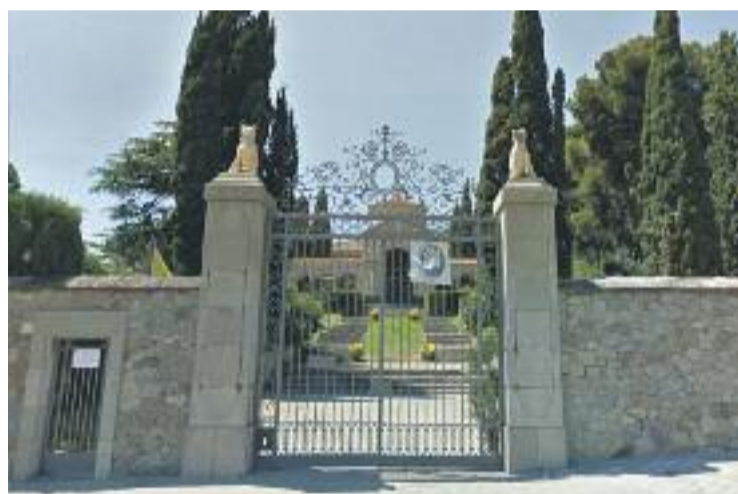
La fira es farà als jardins de Santa Maria Reina.

Els organitzadors esperen tornar a recaptar uns 15.000 euros que es lliuraran al menjador social de la parròquia.