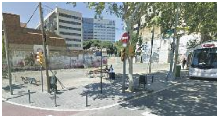
Solar de Numància amb Anglesola on s'ha de fer l'escola.