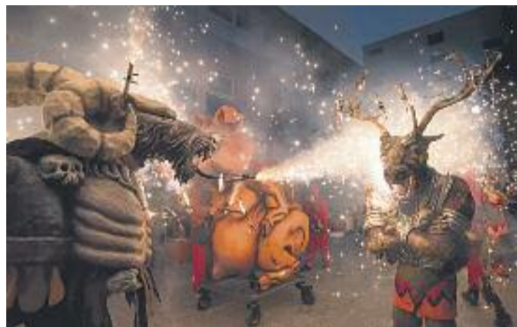
Les bèsties de foc seran les protagonistes aquest dissabte.

A l'acte hi participaran l'Aegis, el Boc de Can Rosés creat per l'artista Dani Raya l'octubre de 2016; el drac Miserach dels Diables Sant Pau d'Ordal i la Voraxcis del Grup Mal-llamp d'Igualada.