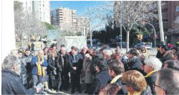
Imatge de la concentració de rebuig a l'agressió.

Segons va avançar el diari digital El Món, la dona passejava tranquil·lament pel passatge de Xile quan un home se li va acostar i la va tirar a terra. Aquesta veïna ha explicat que anava cap al carrer Sant Ramon Nonat per fer un cafè amb una amiga quan un home d'uns 40 anys se li va plantar al davant. "Em va mirar amb una cara d'odi molt evident, es va fixar en el llaç groc i de cop em va agafar per les espatlles i em va empenyer amb força. Em va tirar a terra, a la part on passen els cotxes, i sense dir-me absolutament res va seguir caminant", ha relat la dona a El Món.