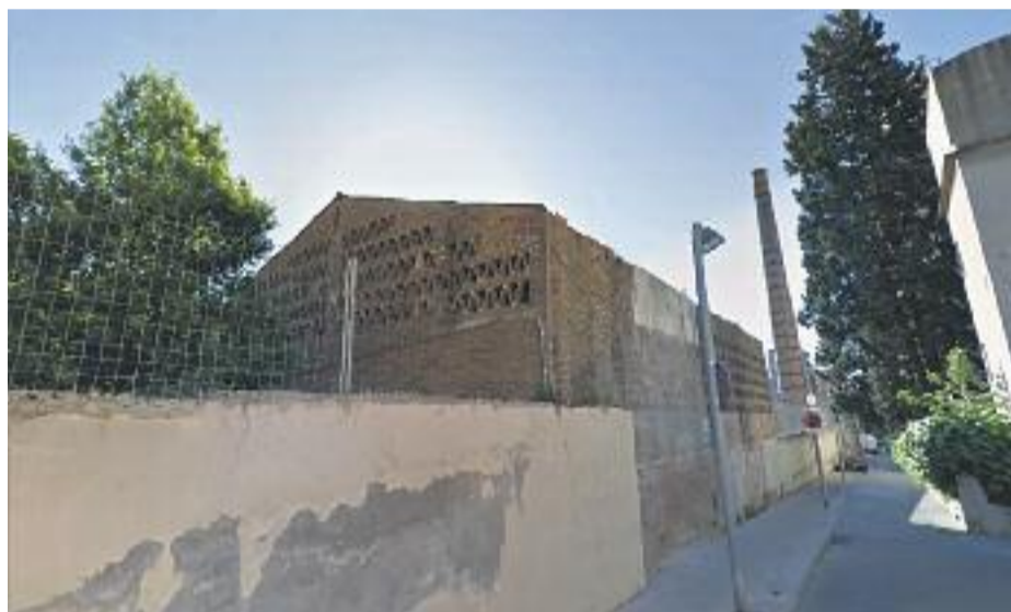
La xemeneia (esquerra) és l'element més característic de l'antiga fàbrica, que ocupa un ampli solar de les Corts (dreta).