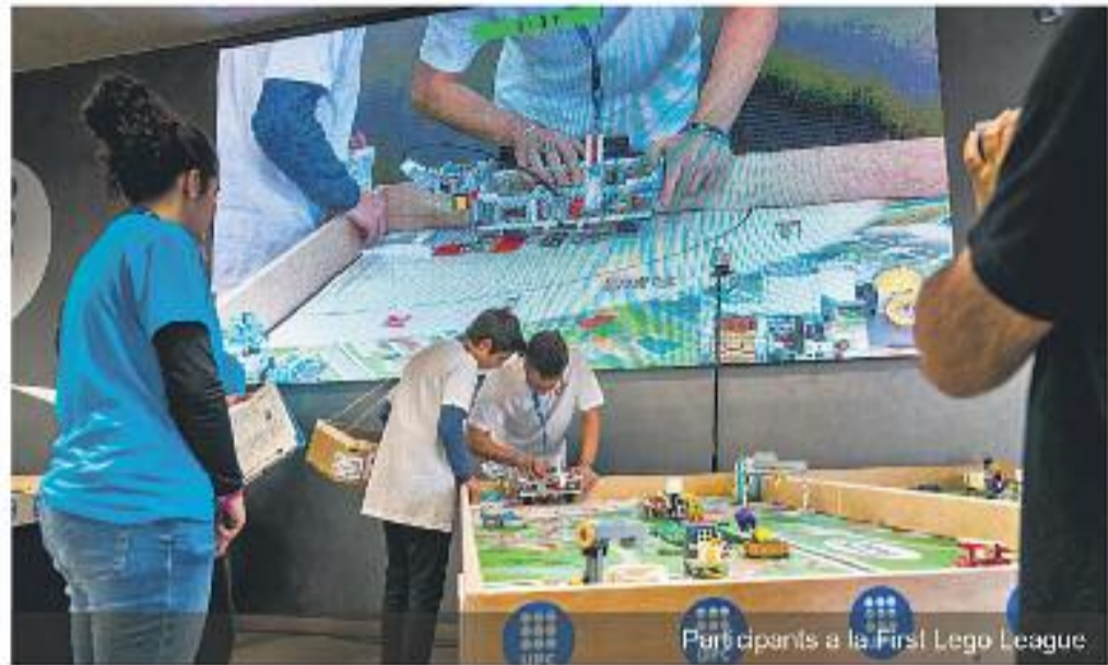
Participants a la First Lego League

Hi ha diferents premis i guardons per als concursants de les diferents fases. Algunes de Barcelona hi col·labora amb el guardó 1r premi al Projecte Científic com a agent coneedor i impulsor de la gestió eficient del cicle integral de l'aigua. També