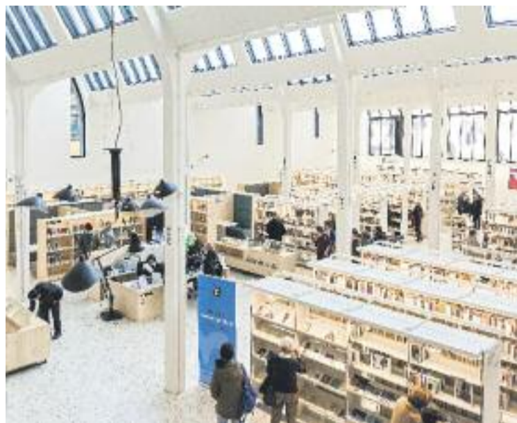
La nova biblioteca té molta llum natural.

En segon lloc, cal parlar del projecte que representa aquesta biblioteca. Connecata amb l'Ateneu de Fabricació digital de les Corts, una incubadora del moviment 'maker' o, el que és el mateix, de la filosofia del fes-t'ho