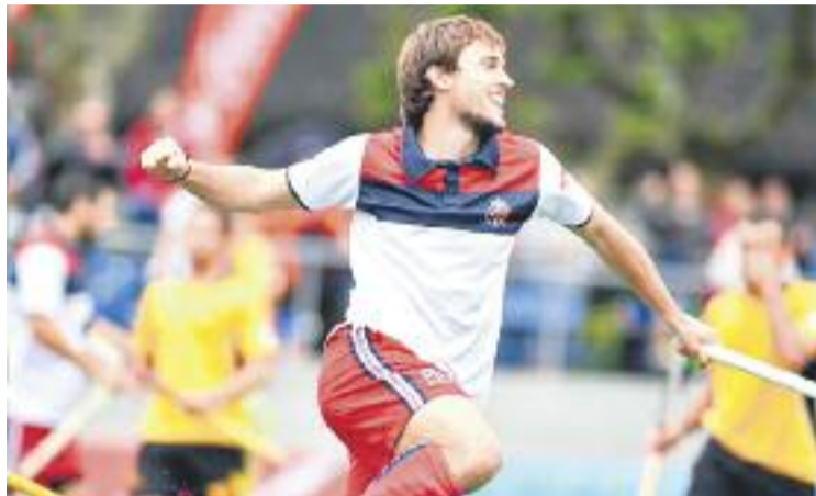
L'hoquei de primer nivell torna demà a l'Eduardo Dualde.

La competició masculina arrencarà demà mateix, a tres quarts de set de la tarda, amb el partit entre l'Atlètic i el combinat nacional xilè. L'enfrontament entre l'HDM de l'Haia i el Club de