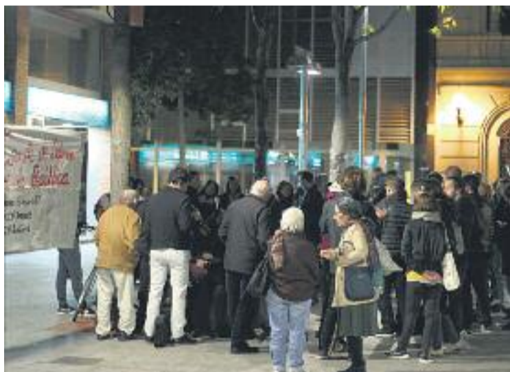
Imatge d'una trobada del CDR de les Corts.

La segona denúncia que fan des d'aquest col·lectiu té a veure amb el vermut solidari que es va celebrar dissabte passat en un solar públic del carrer Anglesola. El col·lectiu denuncia que, tot i tenir el permís corresponent, una parella de Mossos d'Esquadra es va presentar al solar per confirmar que s'estava fent el vermut solidari i afegixen que els policies van demanar identificar algú dels presents. La pri-