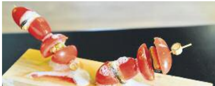
Una de les tapes que es poden degustar aquests dies.

D'altra banda, l'Eix Sants-Les Corts ja es troba immers en