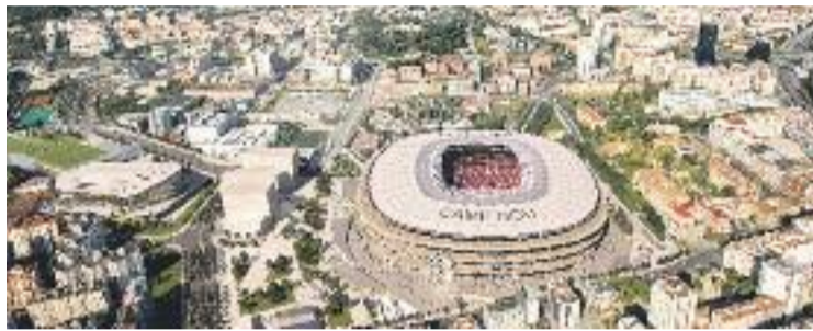
Una reproducció virtual del futur Camp Nou.

Per la seva banda, des d'ERC, que també es va abstenir en la primera votació, es plantegen votar a favor del projecte si s'escolten les