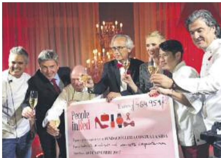
El sopar va permetre recaptar 464.959 euros.

Gràcies a les donacions de tots els assistents es va poder recaptar gairebé mig milió d'euros, que ara serviran per finançar nous projectes per la lluita contra la Sida.