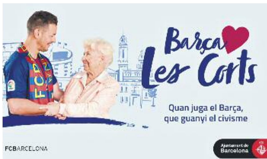
La campanya vol aconseguir que els partits del Barça no suposin molèsties per als veïns.

CAMPANYA ▶ 'El Barça estima les Corts'. Aquest és el nom de la campanya que el Districte i el FC Barcelona han posat en marxa recentment i que té per objectiu promoure el civisme entre tota la gent que assisteix al Camp Nou i els seus entorns durant els dies de partit.