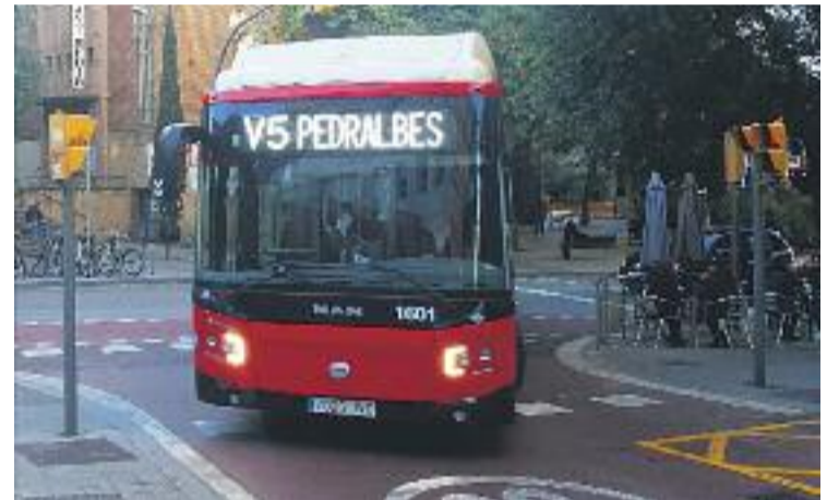
Una imatge d'un autobús de la nova línia.

Per últim, des de l'Eix afirmen que aquests nous problemes relacionats amb la línia V5 del bus s'han d'afegir als que ja provocar, des del seu punt de vista, el carril bici que es va estrenar ara fa un any al mateix carrer Joan Güell, que va comportar la supressió d'un dels carrils de circulació.