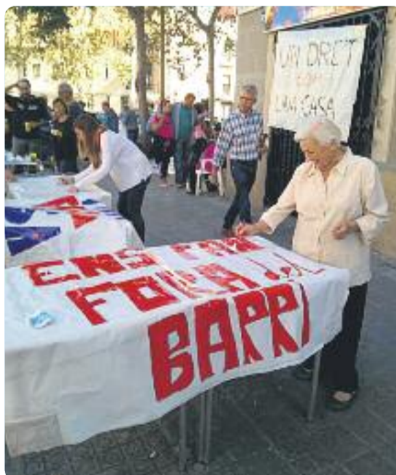
Una imatge del taller de pancartes.

Així doncs, des de bon matí la plataforma i els veïns afectats van sortir al carrer a preparar les pancartes amb els següents missatges de protesta: 'Ens fan fora de casa', 'Volem quedar-nos' i 'Un dret com una casa' per penjar-les als balcons. Des d'Ens Plantem defensen el dret dels veïns a continuar vivint al barri on han fet la seva vida o on l'estan construint i exigeixen que "les administracions intervinguin per garantir que aquest dret fonamental no sigui segrestat per les pràctiques especuladores dels fons inversors".