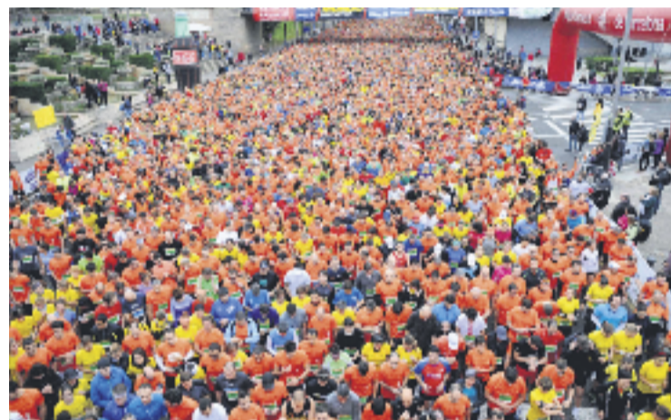
Una imatge de la cursa de l'any passat.

Com és habitual, la cursa també tindrà un marcat caràcter solidari, ja que permetrà que els atletes col·laborin amb Càritas amb la quantitat que vulguin.