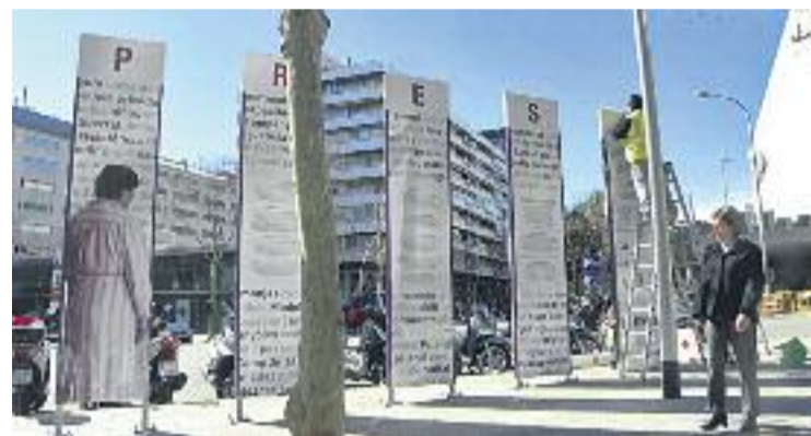
La Presó de Dones va funcionar entre 1939 i 1955.

La Presó de Dones de Les Corts va ser, entre 1939 i 1955, un espai de repressió i empenyorament de dones, moltes d'elles per motius polítics. Onze preses van ser afusellades al Camp de la Bota en aquesta etapa. L'any 1955, la presó va tancar després que les carcelleres de l'ordre religiós que gestionava la institució aconseguissin permutar la finca. La zona es va transformar ràpidament i no va quedar cap vestigi de la presó.