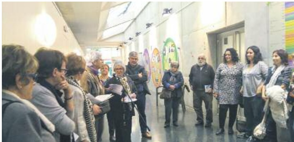
Inauguració de la mostra sobre la Taula de Dones.

SOCIETAT ▶ La Taula de Dones de les Corts celebra aquests dies els seus més de 20 anys d'existència. I ho fa amb activitats per reivindicar el paper de la dona en la societat actual i en èpoques anteriors.