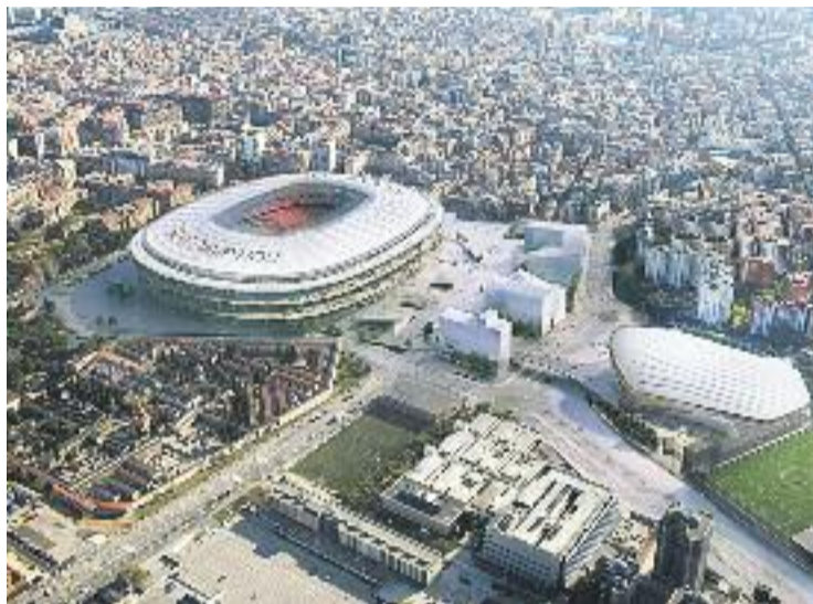
Una imatge virtual del futur Espai Barça.

Les entitats veïnals, a banda de les crítiques relacionades amb l'aspecte urbanístic, tam-