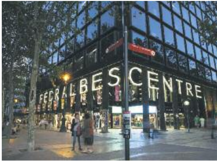
El projecte de transformació del centre tirarà endavant.

El que sí que està decidit és la transformació de la façana per modernitzar-la i per aconseguir ampliar la superfície comercial del centre. Sigui com sigui, fonts de Colonial expliquen a Línia Les Corts que la trans-