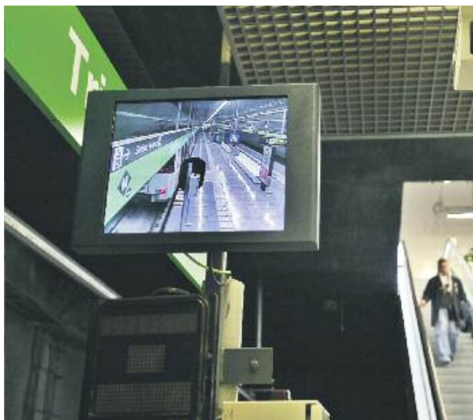
El nou pla de xoc per evitar robatoris estarà en marxa fins al 30 de setembre.