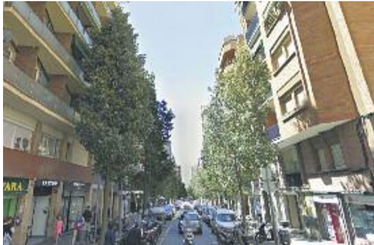
La majoria de cortsencs creuen que les Corts és un districte segur.

Tot i això, l'enquesta també assenyalava com a les Corts, tot i liderar la percepció en seguretat, és el districte on hi ha més veïns que creuen que l'evolució de la mateixa ha empitjorat durant l'últim any. Els veïns que tenen aquesta opinió són el 24,5% -és a dir, un de cada quatre- mentre la mitjana dels 10 districtes és del 17,8%. D'altra banda, un 45,3% creuen