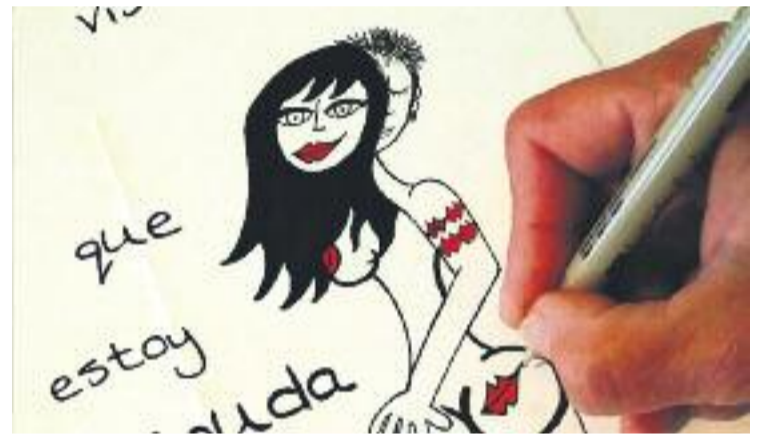
Ahir es va fer el taller d'il·lustració de poesia eròtica.

La recta final serà demà i divendres amb una xerrada-taller de joguines eròtiques, la xerrada 'La sexualitat a partir dels 50', el taller d'autoeròtica per a dones i la conferència teatralitzada 'Sexe de cinema', on es farà un recorregut per la sexualitat a través dels mites que el cinema ha brindat al llarg de la història.