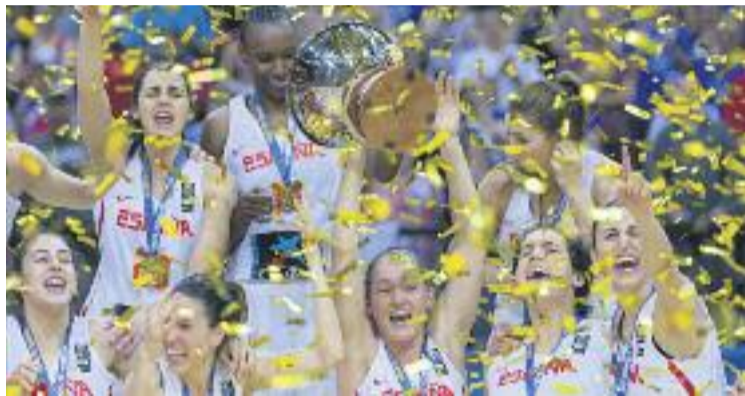
Palau, eufòrica, aixecant la copa de campiona.

"Estudiava a l'escola Ítaca i totes les meves companyes jugaven a bàsquet i jo volia jugar amb elles. El meu pare em va portar al club i recordo que la Pepa em va dir que l'equip on em pertocava estar per edat estava ple i que jugaria amb