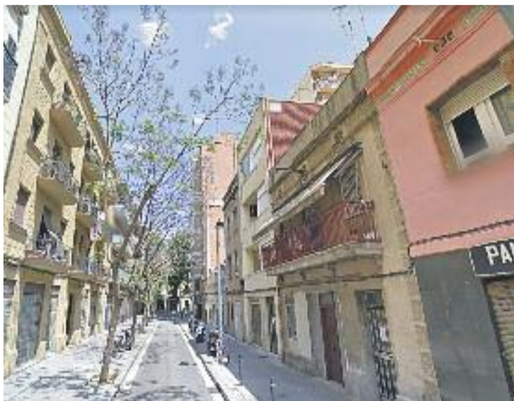
La Maternitat i Sant Ramon ja té associació de botiguers.

Entre els principals objectius que es marca l'associació, des-