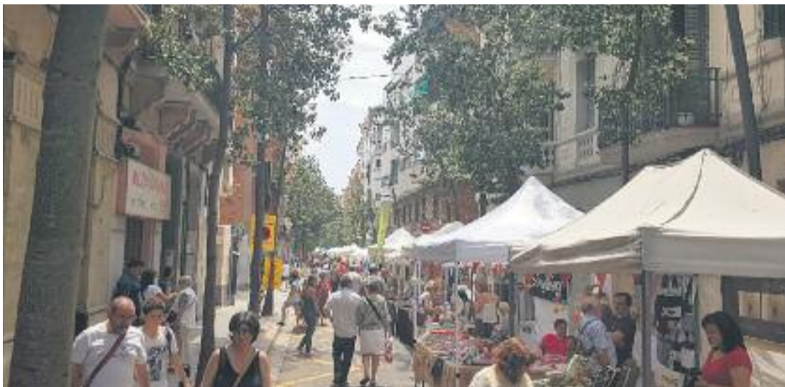
La Mostra de Comerç a Galileu sempre aplega un bon nombre de visitants.

» El bon temps va servir perquè l'eix omplís el carrer el passat dia 6 » S'hi van fer exhibicions de dansa, arts marcial i tallers diversos