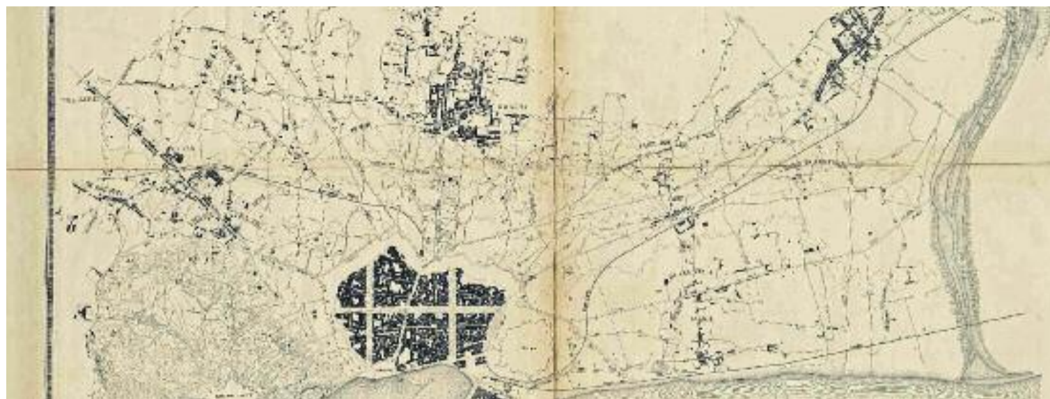
Un plànol d'Ildefons Cerdà del 1855 on es pot veure Barcelona i els pobles dels voltants que més tard engoliria.

La reclamació per part de les autoritats barcelonines d'annexionar-se els pobles que envoltaven el cap i casal venia de lluny. Vint anys abans, pels volts del 1876, l'Ajuntament va demanar-ho al govern estatal sorgit de la Restauració. Alguns dels principals arguments eren la voluntat de les autoritats barcelonines d'augmentar la recaptació d'impostos i que els nous carrers de l'Eixample ja limitaven, i fins i tot s'estenien, pel territori d'alguns dels pobles que volien engolir. "Barcelona no sol·licita que li concedeixin mitjans