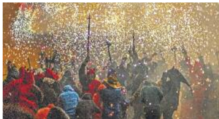
Els Diablers de Les Corts fan 23 anys.

La jornada s'acabarà amb una revetlla de cloenda amb el punxadiscos Duranium.