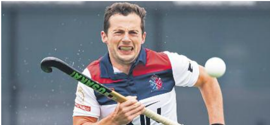
La temporada s'ha acabat per al sènior masculí.

» El sènior masculí perd a la semi contra el campió, l'Atlètic Terrassa » El femení no té cap opció en la seva sèrie contra el Complutense