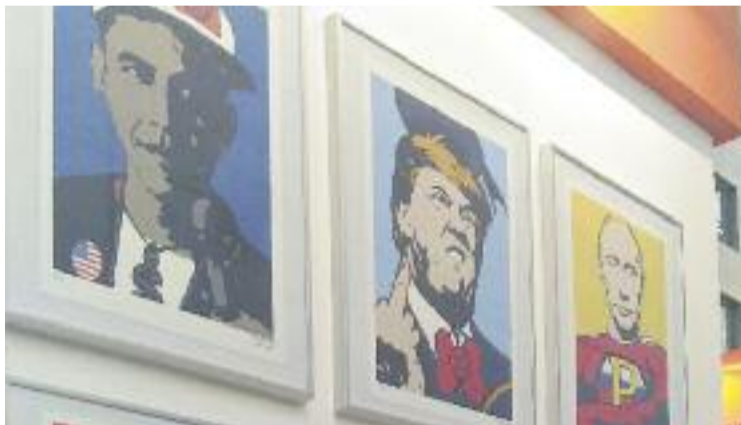
La pintura té un lloc especial a la mostra.

MOSTRA ▶ L'illa Diagonal aposta per l'art contemporani. I és que des de dilluns passat i fins al pròxim 10 de juny ofereix la possibilitat de visitar l'exposició L'illa d'art Fest, una mostra amb obres d'art contemporani de 30 artistes.