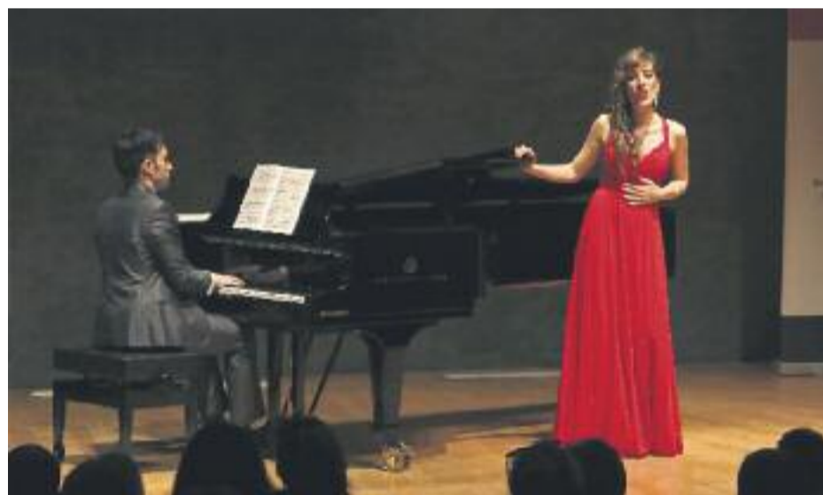
Tres imatges de l'edició de l'any passat.