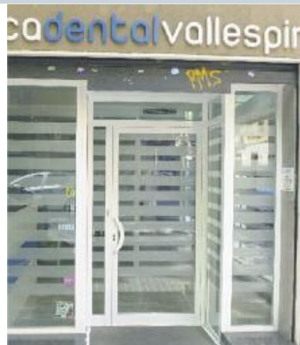
Entrada de la Clínica Dental Vallespir

8-EMBARÀS: per últim, al voltant del 50% de les dones embarassades tindran gingivitis durant el segon trimestre. És un fet transitori, per tant és important augmentar les cures bucodentals, de manera que cal que es facin una higiene durant l'embaràs i que visitin al seu dentista.