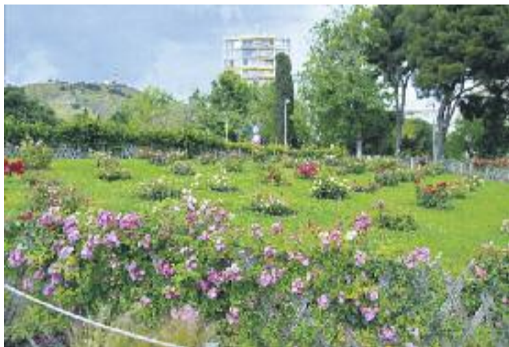
El concurs ha arribat enguany a la dissetena edició.

Totes les varietats del concurs han estat creades per roseristes a partir d'encreuaments de varietats que ja existeixen. Són inèdites i no han estat mai comercialitzades. Per obtenir una nova varietat els roseristes hi dediquen 10 anys abans de poder presentar-la a concurs o comercialitzar-la.