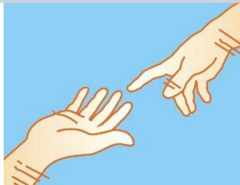
Publicitat del Concert Solidari

Utilitzem els beneficis obtinguts en la venda de llibres i la recaptació dels tallers (quotes dels alumnes que els cursen) en aportar recursos econòmics a les famílies i individus que els especialistes dels Serveis Socials ens deriven. De la mateixa manera, donem suport personal en accions d'acompanyament, teràpies i serveis psicològics personalitzats.