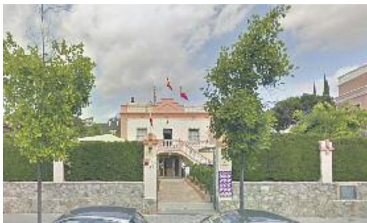
La Casa de Cantàbria és al barri de Pedralbes.

D'altra banda, la Casa de Cantàbria fomenta i divulga entre els seus socis la cultura càntabra gràcies a l'organització de diferents activitats com ara conferències, classes, excursions, certàmens artístics i literaris, corals i balls regionals de Cantàbria. També tira endavant