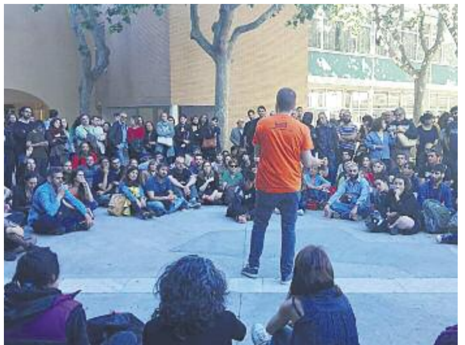
El Casinet d'Hostafrancs es va omplir per la presentació del sindicat i un centenar de persones van haver de seguir l'acte des del carrer.