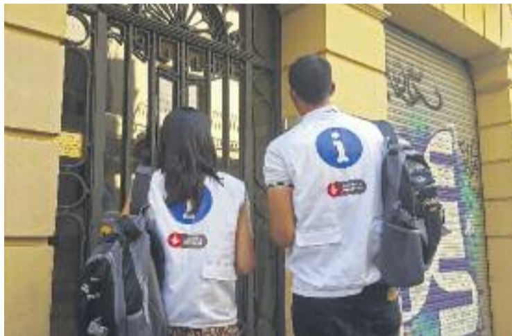
Dos visualitzadors de pisos turístics il·legals.

Així doncs, des de principis del 2016 i fins al passat mes d'abril, l'Ajuntament va ordenar el tancament de 27 pisos a les Corts perquè no tenien la llicència corresponent, una xifra que només supera la de Nou Barris (16). Aquestes 27 ordres de tancament només representen l'1,3% del total, ja que se'n va obrir 2.015 al conjunt de la ciutat. Durant aquest període de temps el consistori també va obrir 94 expedients i va posar 41 multes.