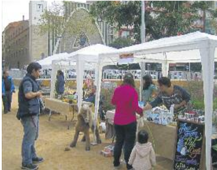
La mostra va aplegar una vintena de parades.

A banda de la venda de productes, la Mostra Ecològica va oferir tallers i xerrades sobre salut, les quals van dinamitzar la jornada amb consells i recomanacions diverses.