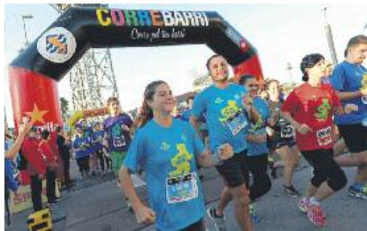
Una imatge de la cursa del passat diumenge 16.

El calendari atlètic continua amb intensitat i aquest diumenge se celebrarà la 18a edició de la Cursa de Bombers. La prova, de 10 quilòmetres, tindrà la sortida i la meta a Ciutat Vella i passarà per Sants-Montjuïc i l'Eixample.