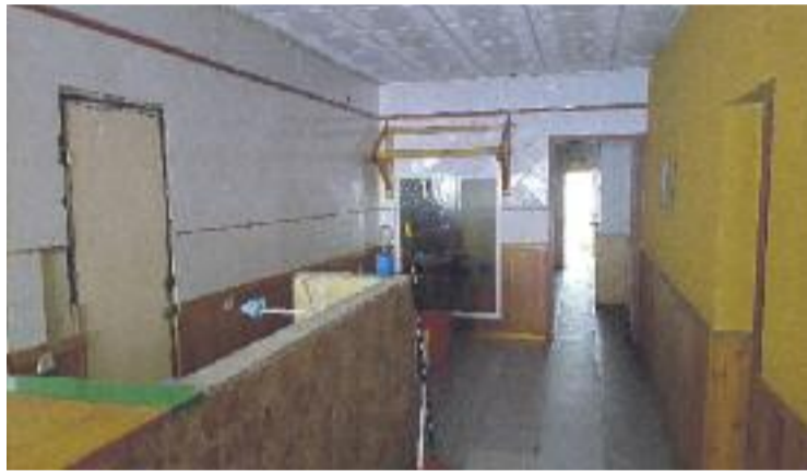
Una imatge de l'interior de l'edifici okupat.

es mou una veïna del mateix carrer Benavent, que viu cinc números més avall de l'edifici okupat. Aquesta veïna denuncia que l'okupació "és un gest arbitrari d'un grup que no té cap legitimitat per fer-ho", al mateix temps que deixa clar que "al barri fa 18 anys que esperem una residència d'ancians i també hi ha la necessitat de lloguer social, ja que hi ha famílies senceres que viuen en una habitació". Per últim, assegura que tem que "l'edifici es pugui convertir en un nou Can Vies".