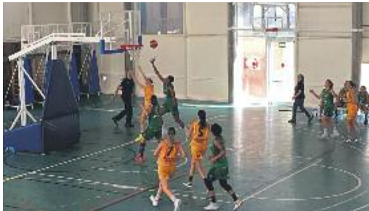
Un moment del darrer partit a casa contra l'Arxil.

Manzano no prepara el partit contra les hortengues de manera especial. "Per a nosaltres tots els partits són finals i qual-