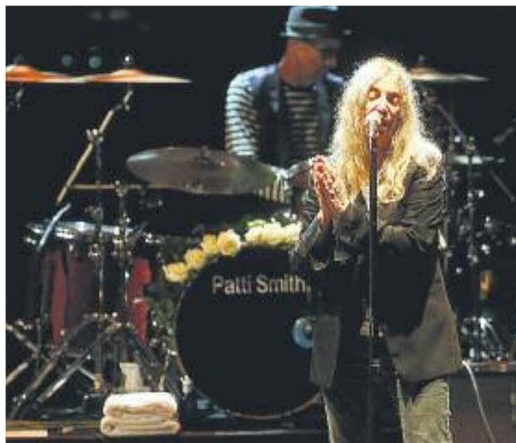
Patti Smith va ser una de les protagonistes de l'última edició.

Tot i la seva curta vida -aquest estiu es va celebrar la quarta edició- El Jardins de Pedralbes, que tal com el seu nom indica se