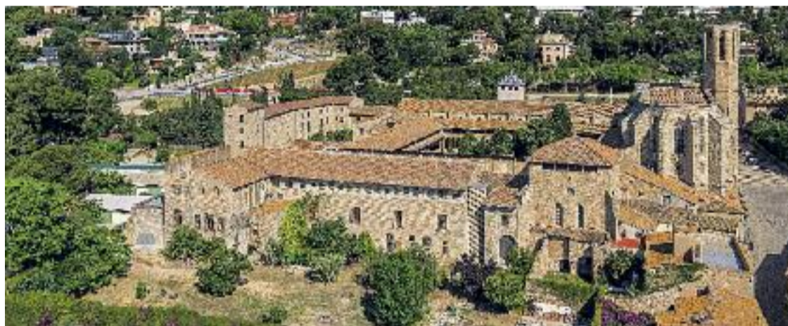
Kimhiyo Nacacoh (esquerra) i Ricardo Estrada (dreta) actuaran al Monestir de Pedralbes (a sota).