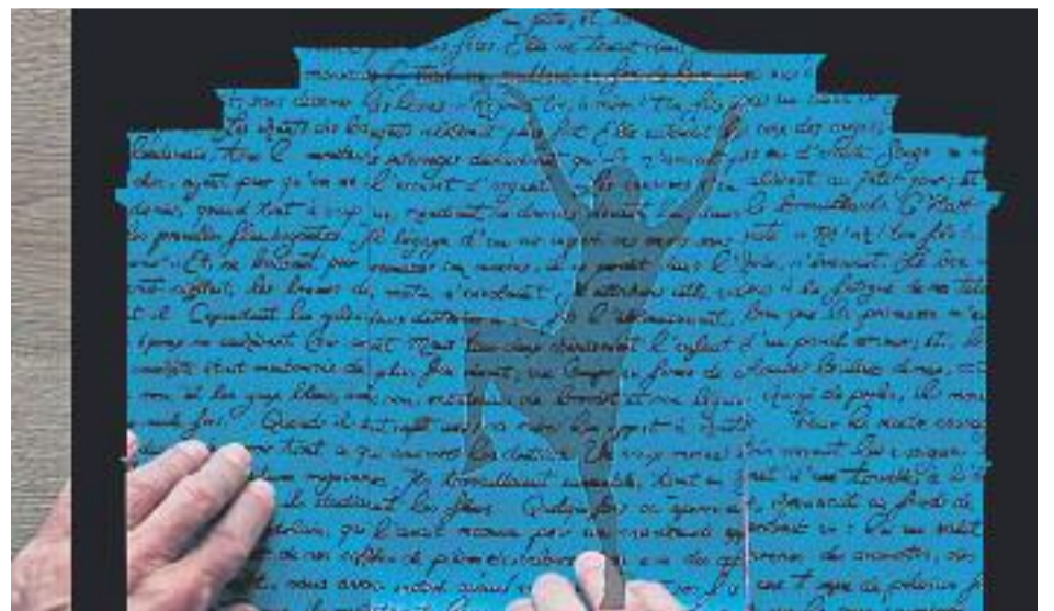
El festival tindrà les places com a protagonistes (esquerra), on actuaran David Carabén (a dalt a la dreta) i es podrà veure el mapping de La Caldera (a baix a la dreta), entre altres.