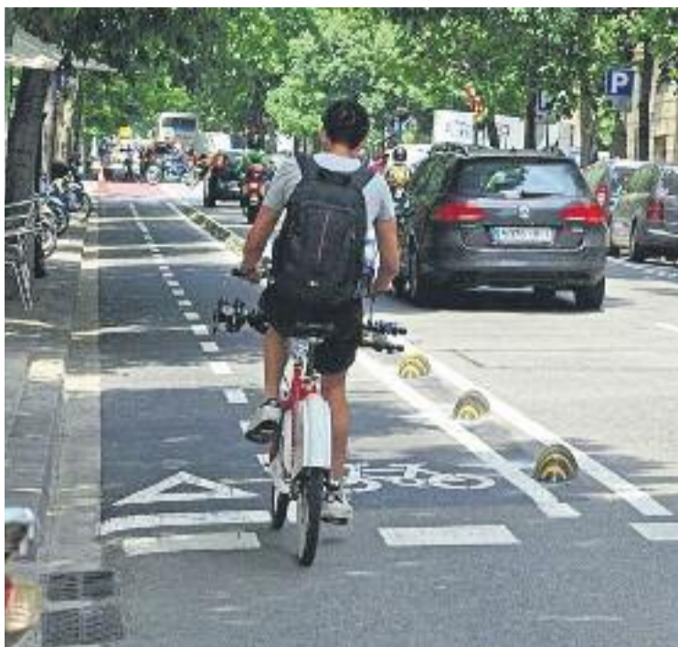
Els cortsencs volen més carrils bici.