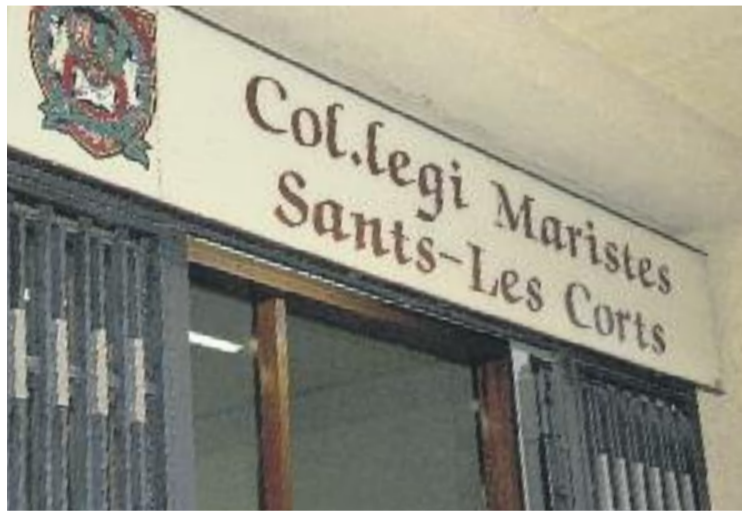
Els Maristes, envoltats per la polèmica.