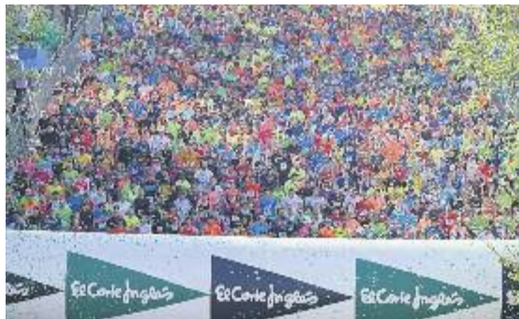
Gairebé 65.000 persones van participar a la cursa.

ATLETISME ▶ Dues victòries de debutants. Mourad El Bannouri i Míriam Ortiz van guanyar la 38a edició de la Cursa del Corte Inglés que es va disputar diumenge i que va aplegar gairebé 65.000 atletes. Aquesta xifra consolida la cita com la carrera popular més important d'Europa i la segona del món en aquest 2016.