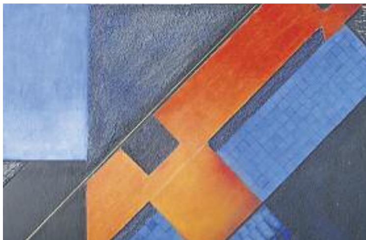
Una de les obres de Sentís a la mostra.

L'exposició, que es va inaugurar el passat dijous 7 d'abril, presenta una selecció de quadres que volen representar "com les formes geomètriques donen color i forma a un intangible tan gran com l'essència de la vida", expliquen els organitzadors. De fet, les obres de Sentís a l'exposició agrupen tot un seguit de formes geomètriques amb lí-