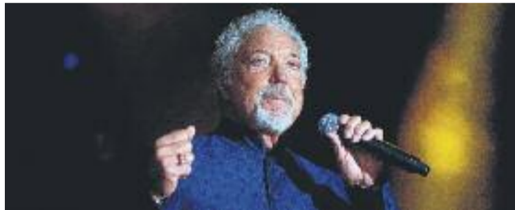
Tom Jones serà un dels protagonistes del festival.

A l'altre extrem del cartell s'hi poden trobar la banda de folk-rock dels Estats Units, The Lumineers, que presentaran el seu nou disc 'Cleopatra' el 26 de juny. El mateix estil musical ja haurà sonat 11 dies abans, el 15 de juny,