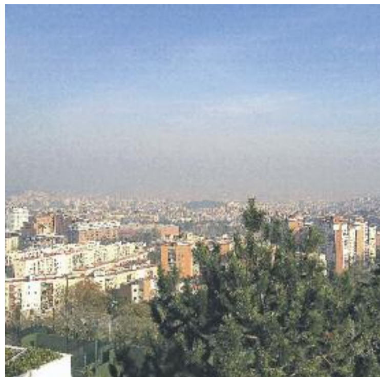
Els experts proposen reduir el trànsit de cotxes durant els episodis d'alta contaminació.