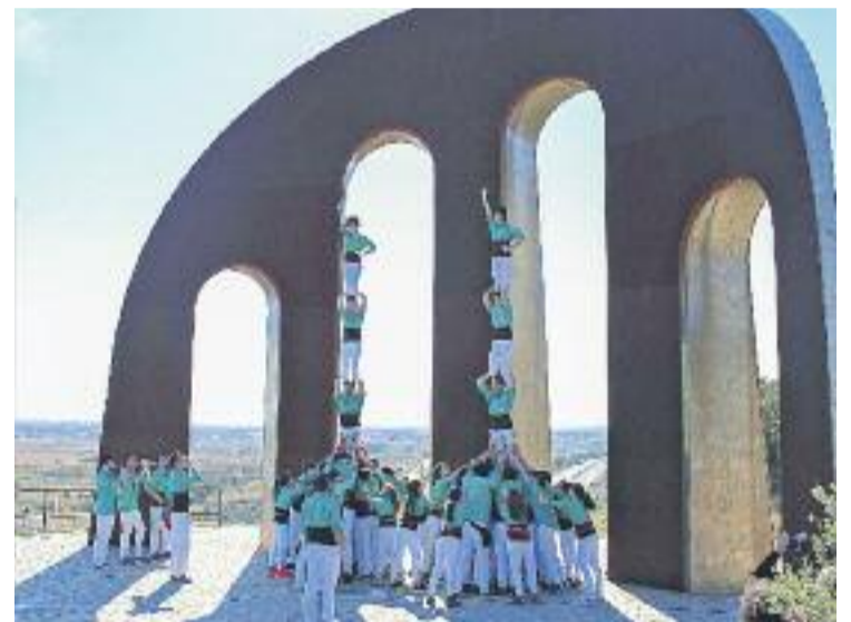
La colla, a la porta dels Països Catalans de Salses.

D'altra banda, el dia abans de marxar cap a la Catalunya Nord, la colla va projectar al seu local social el documental 'Llavors de Llibertat'. Cala i la generació oblidada".