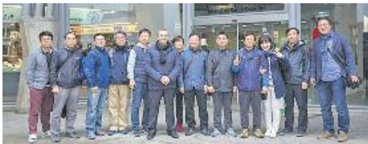
Visita coreana a Barcelona.

VISITA ▶ El món mira Barcelona. En concret, al seu model comercial i de mercats. Durant els últims dies, quatre delegacions estrangeres han visitat la ciutat per conèixer la gestió i la promoció dels mercats.