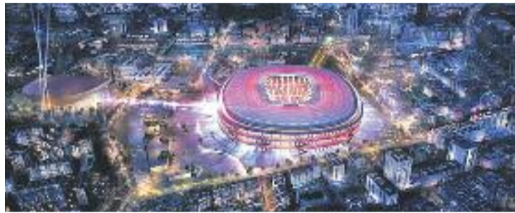
Una reproducció del disseny del nou Camp Nou.