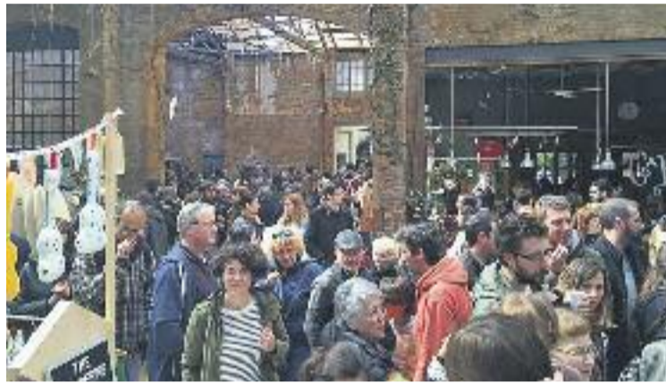
Un moment de la festa de comiat.

Aquest centre de jardineria va aprofitar unes naus industrials