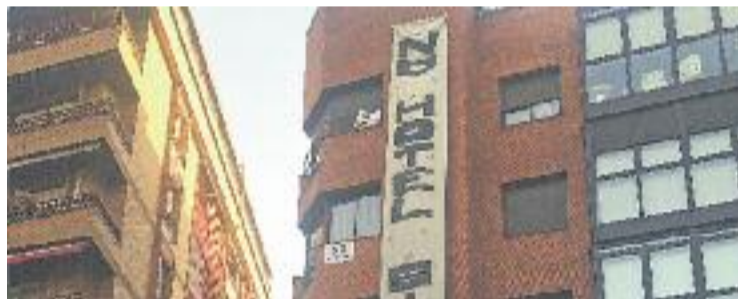
Imatge d'una nova pancarta penjada al carrer Galileu.

PROTESTA ▶ L'oposició al projecte urbanístic que porta a terme la Fundació Sant Josep Oriol -pertanyent a l'Arquebisbat- i que consisteix en la construcció d'un nou edifici per ampliar la residència sacerdotal ha incorporat una nova comunitat de veïns del carrer Galileu.