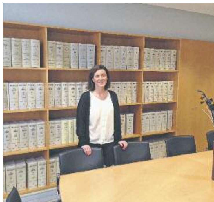
La Paula Alonso, una de les sales de reunions de la notaria.

Per acabar l’entrevista li preguntem sobre les tarifes que apliquen a les seves consultes. “El notari cobra segons un aranzel únic legalment previst. Els notaris no poden cobrar de més, però tampoc a faltar. A més, hi ha una part del seu treball pel qual el notari no cobra: l’assessorament jurídic imparcial”, conclou la propietària.