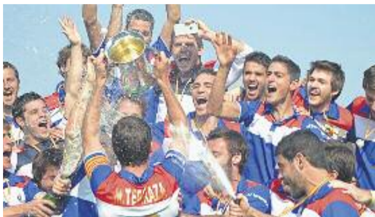
L'equip, eufòric, celebra la consecució del títol.

Sabent que una errada podia resultar fatal, els dos equips van apostar per un joc més tàctic que no pas vistós. A mesura que pas-