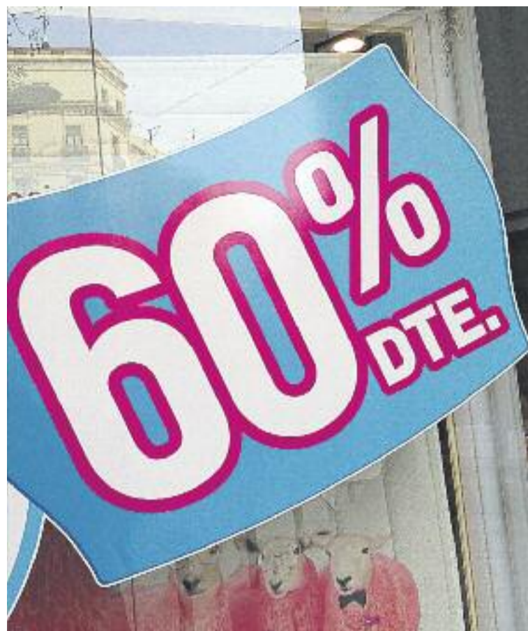
Els descomptes oscil·len al voltant del 40%, tot i que alguns comerços en fan de més grans.