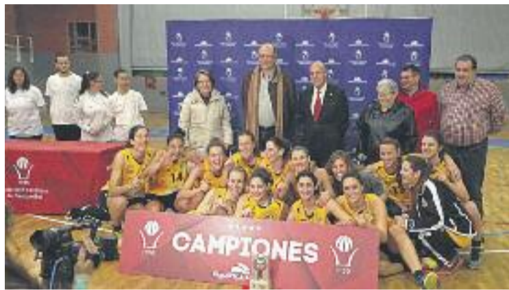
L'equip celebra el primer títol de la temporada.

Les cornellanenques van ser incapaces de superar aquesta de-