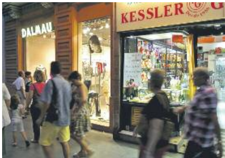
La campanya s'està fent al llarg d'aquest gener.

A la campanya hi participen establiments de tot tipus, des d'alimentació fins a perruqueries, botigues de roba, bars i restaurants, fins a floristeries i clubs esportius, tots ells agrupats en un catàleg d'ofertes.