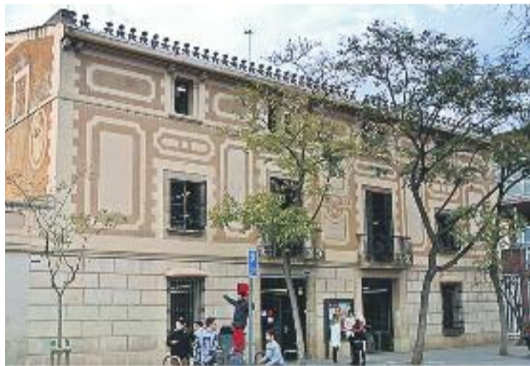
La masia Rosés és avui dia la Biblioteca Can Rosés.