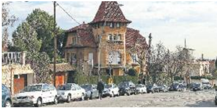
La renda familiar va créixer a Pedralbes entre el 2013 i el 2014.

L'increment de les desigualtats es pot apreciar en el fet que el barri de Pedralbes, el més ric, multiplica per set la renda del barri més pobre, Trinitat Nova. L'estudi mostra com Pedralbes avança respecte del 2013 (243,9) i arriba a un índex de 251,7, mentre que Trinitat Nova torna a retrocedir i cau fins a 34,7 (el 2013 tenia un índex de 38,5). Aquestes xifres es calculen respecte a la renda familiar disponible mitjana de