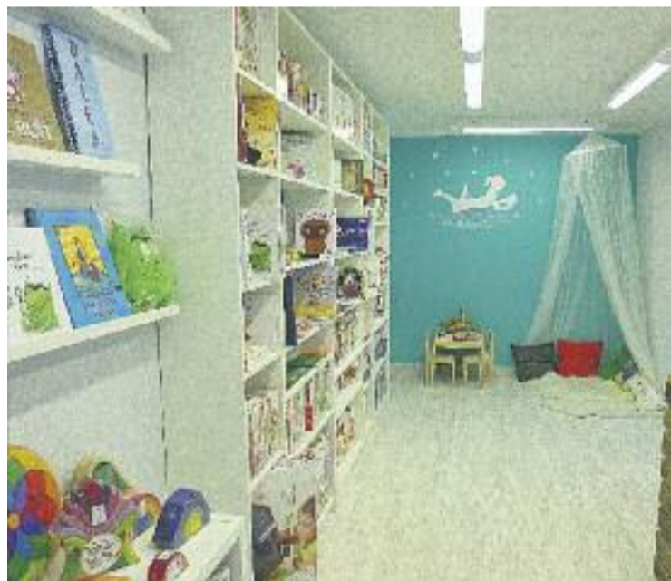
Imatge de la botiga de joguines Origen des de la porta d'entrada.

Marta Navarro, propietària de la botiga Origen “Les joguines han de motivar el joc i potenciar la imaginació i creativitat dels nens”