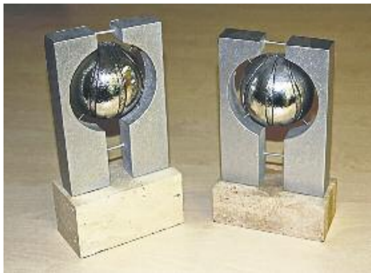
La Copa Federació enfronta els millors equips catalans.

Pel que fa a la competició regular, les cortsencs afronten una nova jornada de lliga aquest diumenge a casa contra el TGN Bàsquet, després de l'aturada del pont de la Puríssima. En l'anterior jornada, disputada el diumenge 30 de novembre, el Joventut va derrotar el Grup Barna a domicili per un ajustat 59 a 64, un resultat que les permet seguir encapçalant la clas-