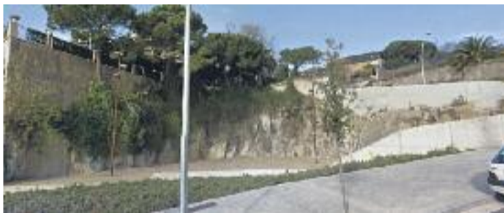
El solar on es construeix el nou edifici de la Betània-Patmos.