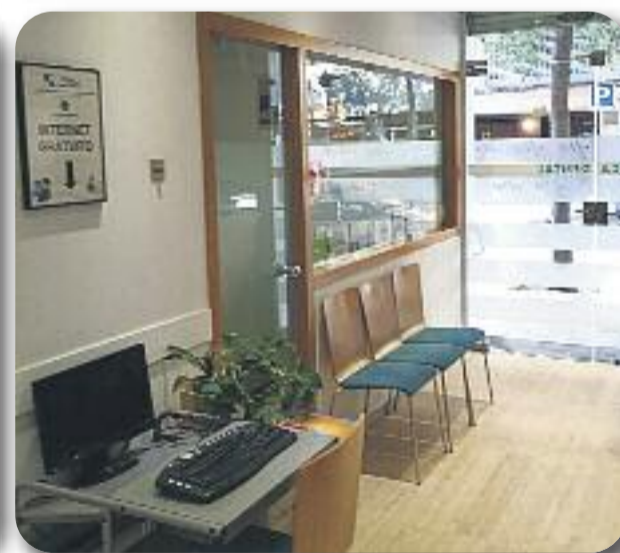
Fotografies de les instal·lacions de la Clínica Dental Esmail