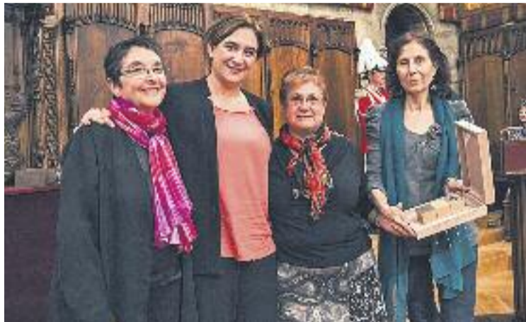
Ada Colau va entregar el premi a tres representants del grup.

El grup promotor del monument a la presó de dones de les Corts va impulsar fa més d'un any un procés participatiu per reflexionar i