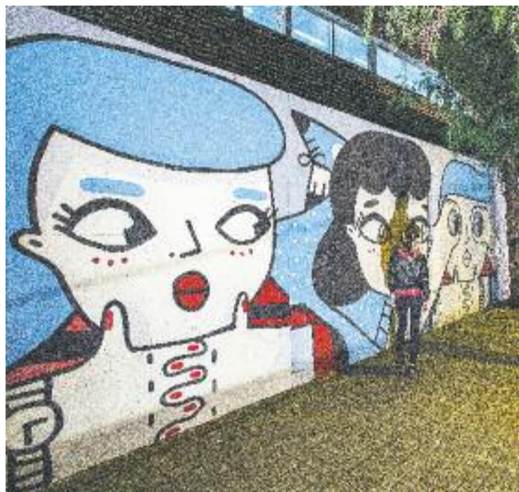
Imatge del mural durant el dia de la seva presentació.