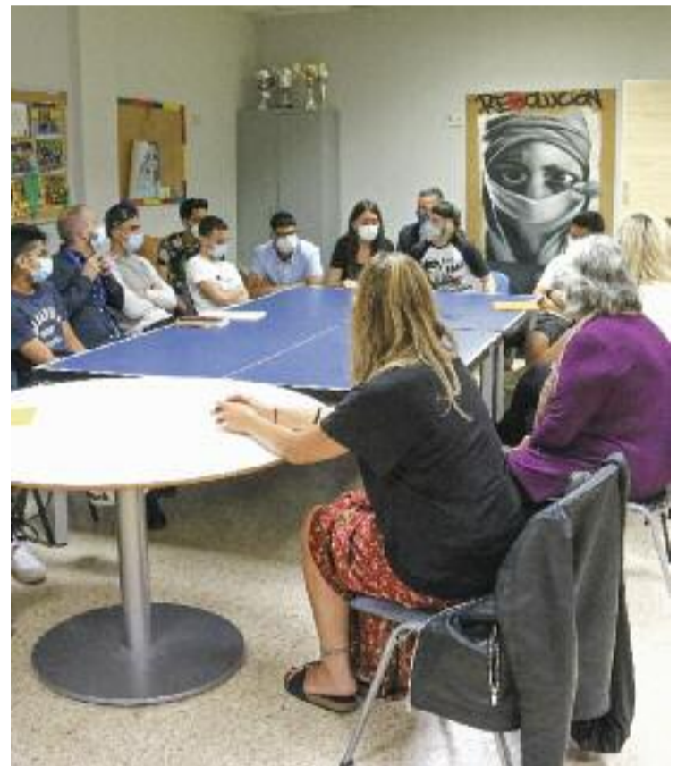
S'abordarà específicament la salut mental.

Per a la consellera de Drets Socials, Violant Cervera, l'increment de famílies en situació de pobresa i risc d'exclusió social provoca que infants, adolescents i joves passin a ser els grups de població "més afectats per les conseqüències" de la crisi desencadenada per la pandèmia.