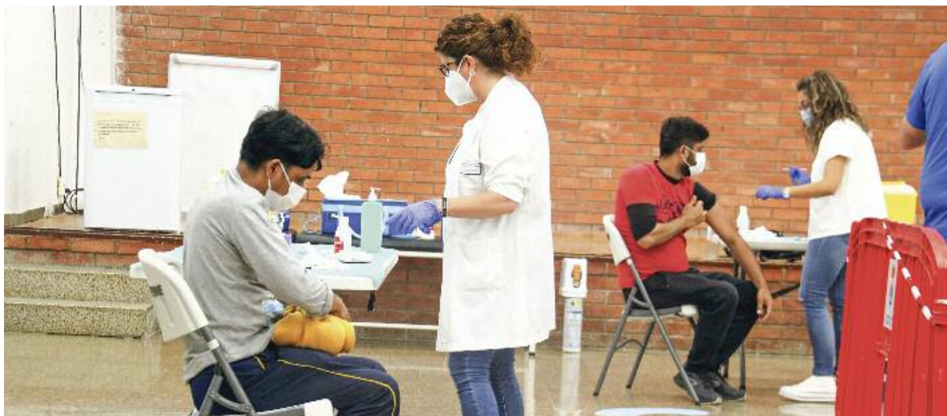
Ja s'han injectat més del 90% de dosis rebudes des de l'inici del procés de vacunació.