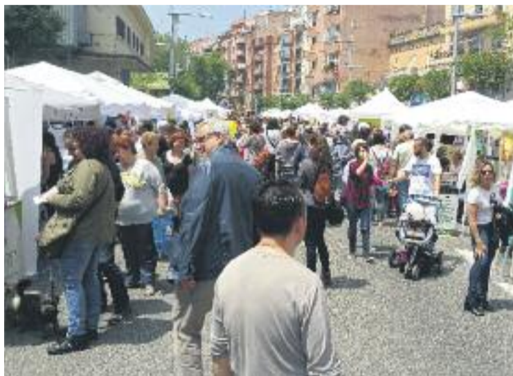
Cor d'Horta és un dels eixos referents de la ciutat.

D'altra banda, pel que fa als seus sectors d'activitat, en primer lloc hi ha els serveis comercials, amb 135 locals actius, en segon lloc l'equipament per a la persona, amb 103 locals actius, i en tercer lloc l'hostaleria i la restauració, amb 73 locals actius.