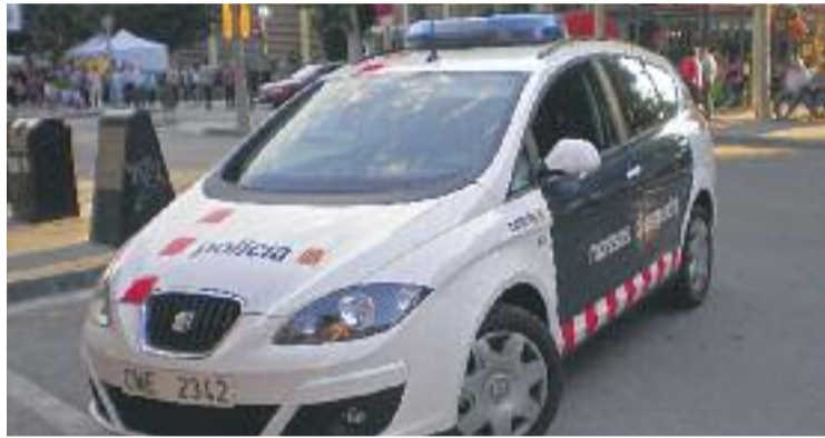
Els Mossos continuen investigant el cas.

El primer avís que van rebre els Mossos d'Esquadra va ser, segons va informar el diari El Periódico, d'un amic dels sospitosos que, tal com ell mateix hauria explicat durant la trucada al 112, havia descobert que a l'interior del vehicle hi havia una noia semiinconscient. Un cop els primers agents de la policia van arribar al lloc dels fets es van trobar tres homes i la noia, de només 16 anys. La víctima, que coneixia els seus agressors, va ser traslladada a