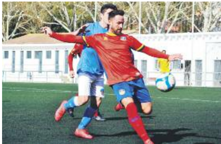
Un moment del partit del Martinenc contra el Lleida B.

El conjunt vermell, però, afronta un tram del calendari duríssim durant les últimes jornades d'aquest mes. El Martinenc visitarà el camp de l'Andorra (el