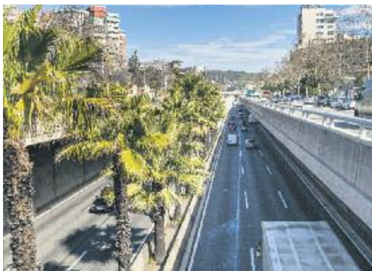
Una imatge d'arxiu del tram de la ronda de Dalt on es fan les obres.

La transformació d'aquest petit tram de la ronda de Dalt està previst que acabi a començaments de l'any que ve i també farà que es reubiqui la senyalització variable de la ronda, cosa que pot afectar de manera puntual al trànsit. Les obres, amb un pressupost de 10,6 milions d'euros, formen part de la segona fase de la cobertura d'un primer tram de la ronda, que té un pressupost total de 15 milions. Aquesta segona fase dona continuïtat a les primeres obres, començades l'es-