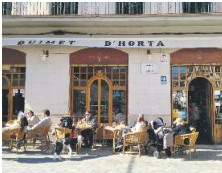
El Quimet d'Horta, un dels bars hortencs més coneguts.

La distribució per barris mostra com Horta és la zona amb més establiments comercials actius, amb un total de 1.115, mentre que a l'altre extrem hi ha la Clota, on només hi ha 15 comerços. L'informe destaca que Horta-Guinardó és "un districte gran i alguns barris tenen poca població i pocs establiments, però hi ha altres barris