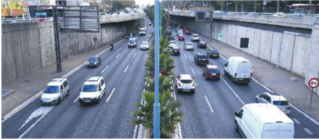
Els veïns fa anys que demanen la cobertura de la ronda de Dalt.

INFRASTRUCTURES ▶ Més “col·laboració” per implicar-se en el projecte de cobertura de la ronda de Dalt. Això és el que li va demanar a principis de mes l'alcaldessa Colau al ministeri de Foment a través d'una carta. La missiva arriba després que el ministeri que encapçala Iñigo de la Serna presentés fa unes setmanes un projecte d'ampliació de la Ronda Litoral en el seu tram d'entrada i sortida de la ciutat entre la Zona Franca i el Morrot.