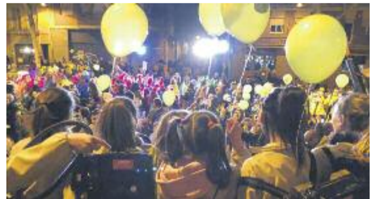
Una imatge de la rua de Carnaval d'aquest any.

D'altra banda, aquest febrer Cor d'Horta celebra el dia dels enamorats amb un concurs, a través de Facebook, per Sant Valentí. Es tracta que els participants expliquin anècdotes divertides del seu dia dels enamorats. El guanyador s'endurà un lot de productes.