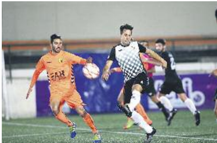
L'Horta continua a la zona tranquil·la de la Tercera Divisió.

(només cinc equips havien aconseguit arrencar un punt contra el filial espanyolista), però en la vint-i-cinquena jornada l'Ascó va aconseguir arrencar una victòria per la mínima del municipal hortenc (0-1), acabant amb una ratxa dels de Nacho Castro d'uns tres mesos sense perdre al Feliu i Codina.