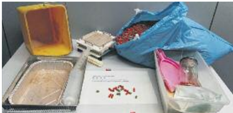
Una imatge del material intervingut per la policia.

Tot plegat va provocar que els Mossos posessin en marxa una investigació, que va acabar amb una inspecció el 22 de gener del Servei de Control Farmacèutic i Productes Sanitaris de la Gene-