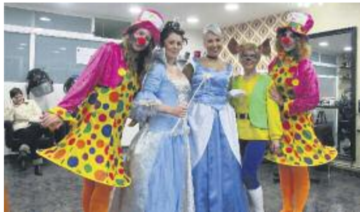
Una imatge del Carnestoltes de l'any passat.

D'altra banda, aquest mes de gener el Districte ha començat a netejar i repintar les persianes dels diferents comerços de les botigues associades de la Federació de Comerciants dels Tres Turons, on hi ha Carmel Comerç, Mercat del Carmel i Comerciants Teixonera.