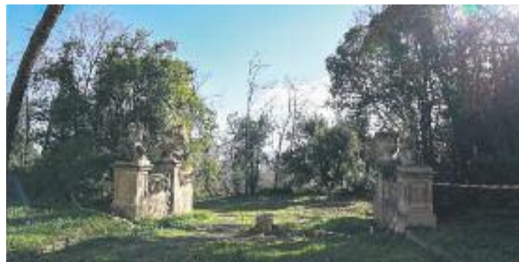
Aquest és l'aspecte actual que té la zona.