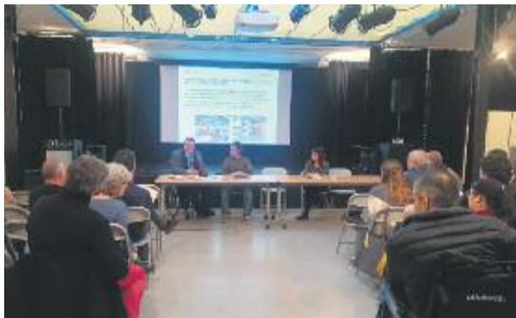
El projecte es va presentar el passat 11 de gener.