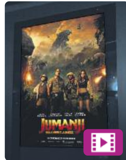
Jumanji: Benvinguts a la jungla

Rentat de cara a un dels clàssics del cinema d'aventures de finals del segle passat. A Jumanji: Benvinguts a la jungla , quatre joves amics són absorbits per un videojoc i es converteixen en personatges amb habilitats úniques.