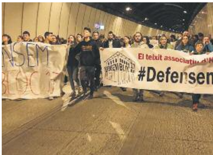
Una imatge de la manifestació del 13 de gener.

L'AJUNTAMENT S'HO PLANTEJA Per la seva banda, des de l'Ajuntament són conscients que aquest edifici és fonamental per