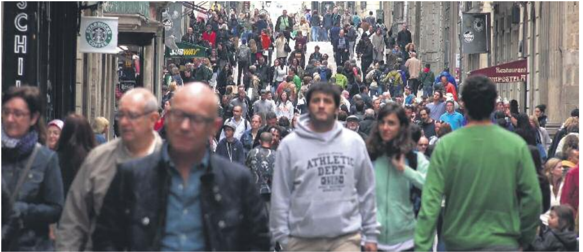
Un 4% més de veïns han passat a formar part del que es considera classe mitjana.