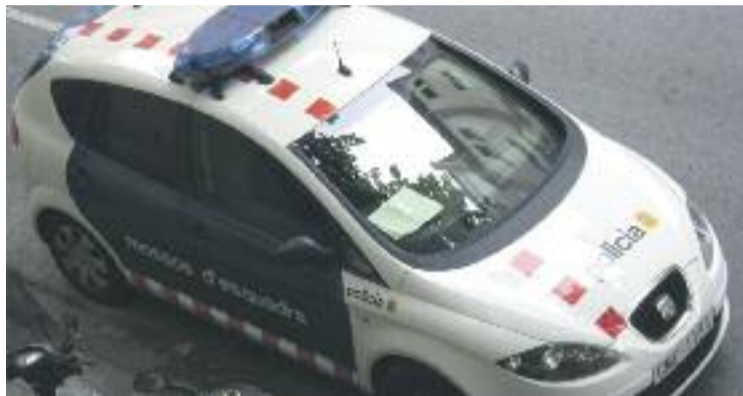
Els Mossos van detenir els dos homes el passat 8 de gener.

En un comunicat, la policia catalana ha explicat que els fets es remunten a quatre anys abans, quan els dos homes es van presentar al seu taller per oferir-li treballs de manteniment i reparació d'algunes eines del taller. Els problemes, segons ha explicat l'afectat, van començar quan els homes, tot i haver fet la seva feina de forma deficient, li van reclamar 3.600 euros. Tot i que en un primer moment el propietari del negoci es va negar a pagar-los aquesta quantitat, ho va acabar fent després de les amenaces que va rebre. Llavors l'afectat va preferir no denunciar els fets per por però el passat 4 de gener els dos homes es van tornar a presentar