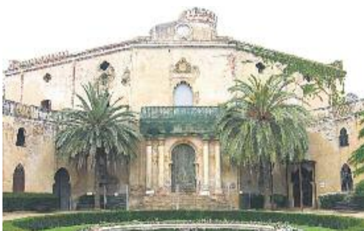
L'Ajuntament rehabilitarà el Palau Desvalls.

REFORMA ▶ La reforma del Palau del Laberint d'Horta, el Palau Desvalls, ha fet recentment, tal com ha informat Betevé, un pas endavant després que l'Ajuntament, a través de Parc i Jardins, hagi anunciat que té previst invertir 1,3 milions d'euros per a començar la rehabilitació parcial de l'edifici.