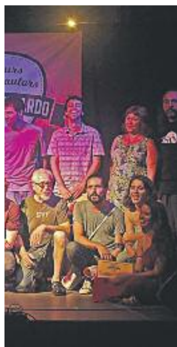
Lua, a baix de vermell.

L'edició d'enguany del concurs va superar totes les expectatives, tant d'inscrits -hi va haver 180 músics, el triple que en l'última edició- com de públic -a la final es van aplegar 400 espectadors-.