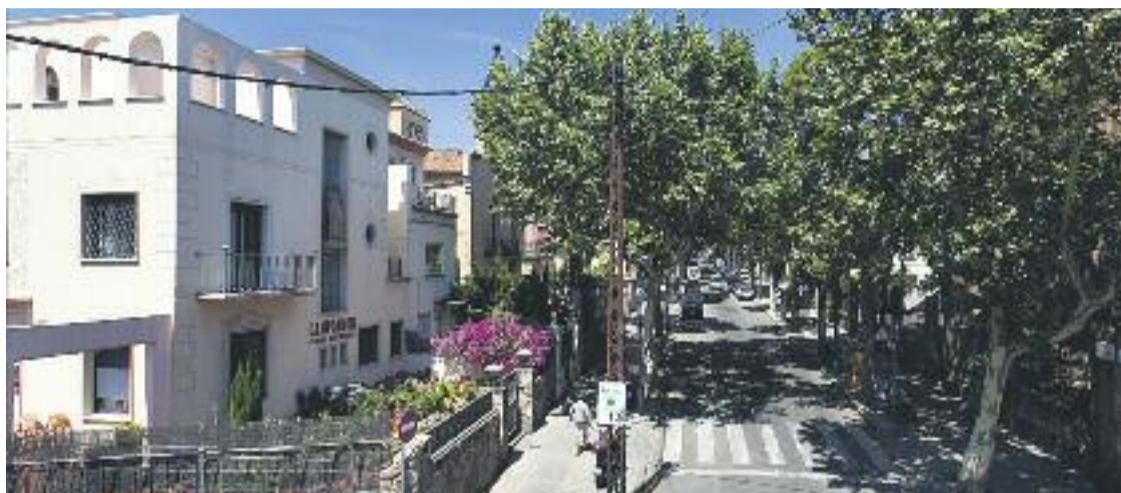
El carrer de Campoamor serà una de les zones que es protegirà.

» El pla de protecció que promou l'Ajuntament també inclou la plaça Bacardí, els carrers Campoamor i Sales i les Cases dels Periodistes