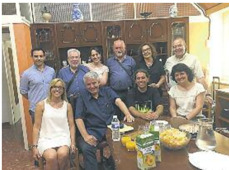
Serra col·laborarà amb els comerciants.

ÈXIT DEL COMERÇ AL CARRER Per altra banda, l'associació va fer un bon balanç de la fira de