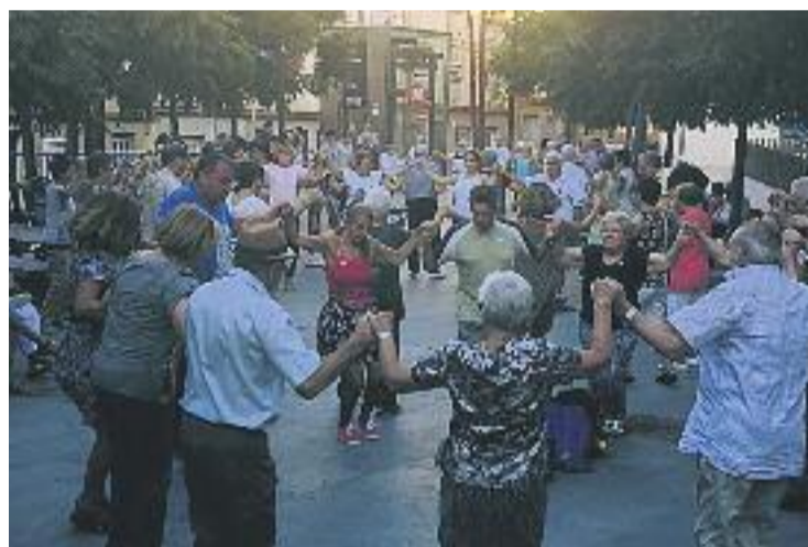
Hi van participar desenes de veïns i veïnes.

Amb aquesta activitat es pretén fomentar la cultura catalana i promoure un acte de germanor entre els veïns i veïnes, que van poder ballar peces com ara Les nimfes del llac , de Josep Coll; la Rosa Bella , de Josep Saderra, o Terra aimada , de Ramon Vilà, entre moltes altres.