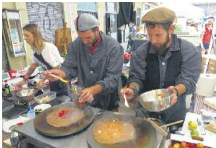
Els mercats s'han omplert d'activitats durant el maig.