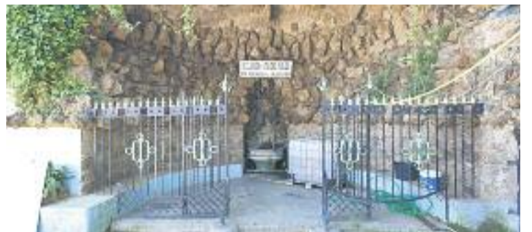
La Font d'en Fargues, un espai emblemàtic del barri.