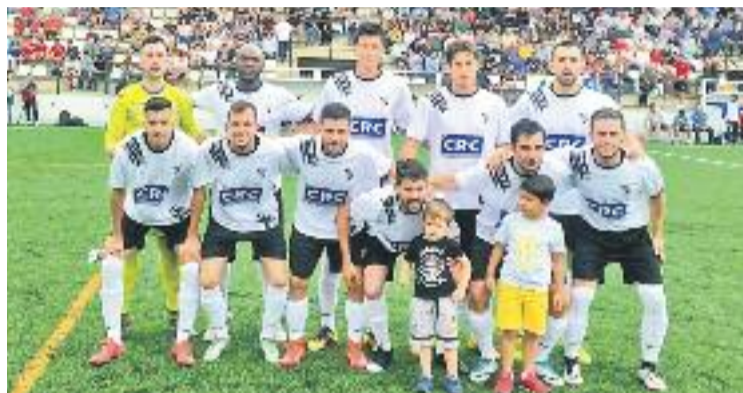
Els onze homes que van certificar l'ascens de categoria.