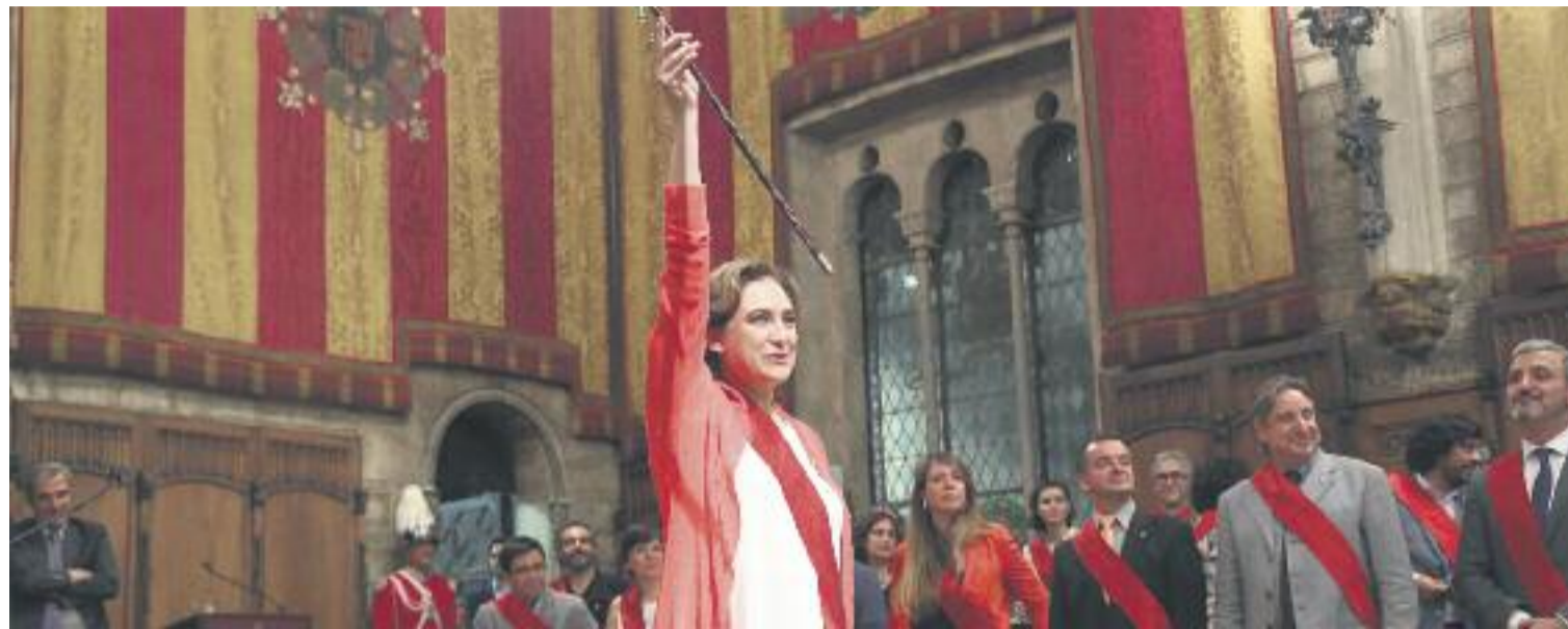
Colau, el dia de la presa de possessió com a alcaldessa.

L'actual alcaldessa, ara de baixa després d'haver estat mare, va iniciar el mandat amb molta ambició. Feia falta començar a complir les múltiples promeses fetes a la ciutadania durant la campanya electoral. Han passat dos anys i, segurament, la gran victòria de Colau i el seu govern –primer en solitari i després amb el PSC– és la d'haver canviat, i dominat, l'agenda política de la ciutat. El turisme i l'habitatge, els dos grans temes on els comuns van posar més èmfasi durant la campanya, ocupen ara la centralitat del debat polític. L'aprovació del Pla Especial Urbanístic d'Allotjaments Turístics (PEUAT), pactat amb ERC, ha