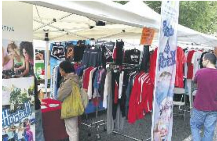
El Comerç al Carrer dona la benvinguda a l'estiu.

Però la gran protagonista de la jornada tornarà a ser la vedella rostida. A partir de dos quarts de nou del vespre està previst repartir racions de la vedella, que s'haurà anat rostint durant tot el dia a l'estil burduntzi, en concret