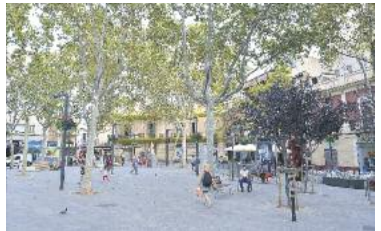
Les terrasses de la plaça Eivissa es reordenen.

En total, a la plaça Eivissa hi ha previstes 60 taules, una menys que fins ara, per tant, destaca el projecte publicat al BOPB, es dona igualment resposta a la demanda actual, que és de 61.