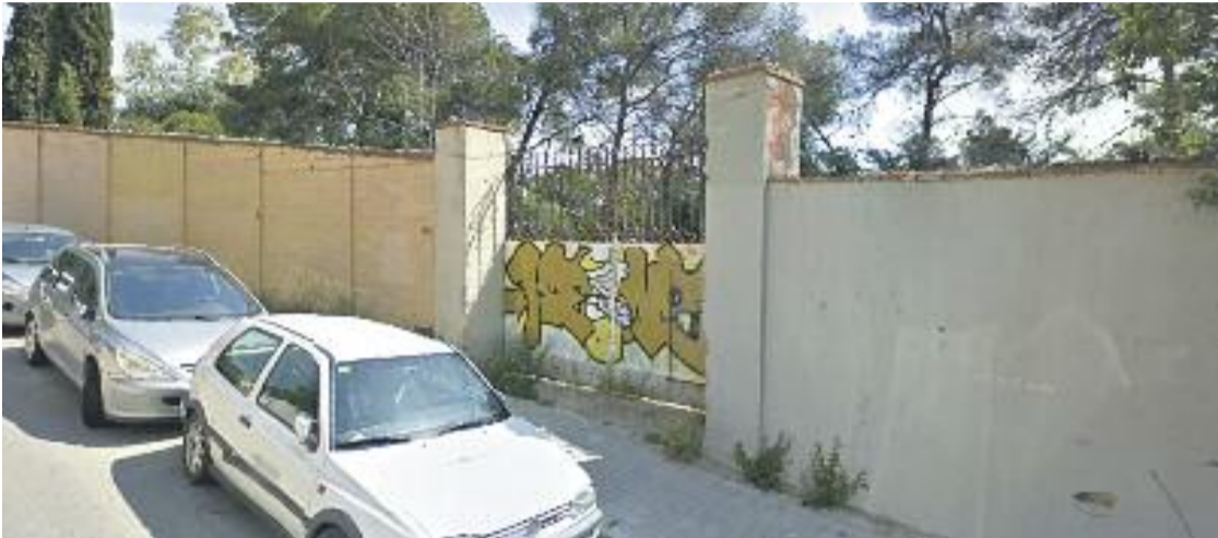
Una imatge d'arxiu de la porta d'entrada a la finca.

» Coneguda com la Jungla, està situada a la Font d'en Fargues, entre Alt de Pedrell, Camil Olivares i Arc de Sant Martí, i hi vivien 9 persones