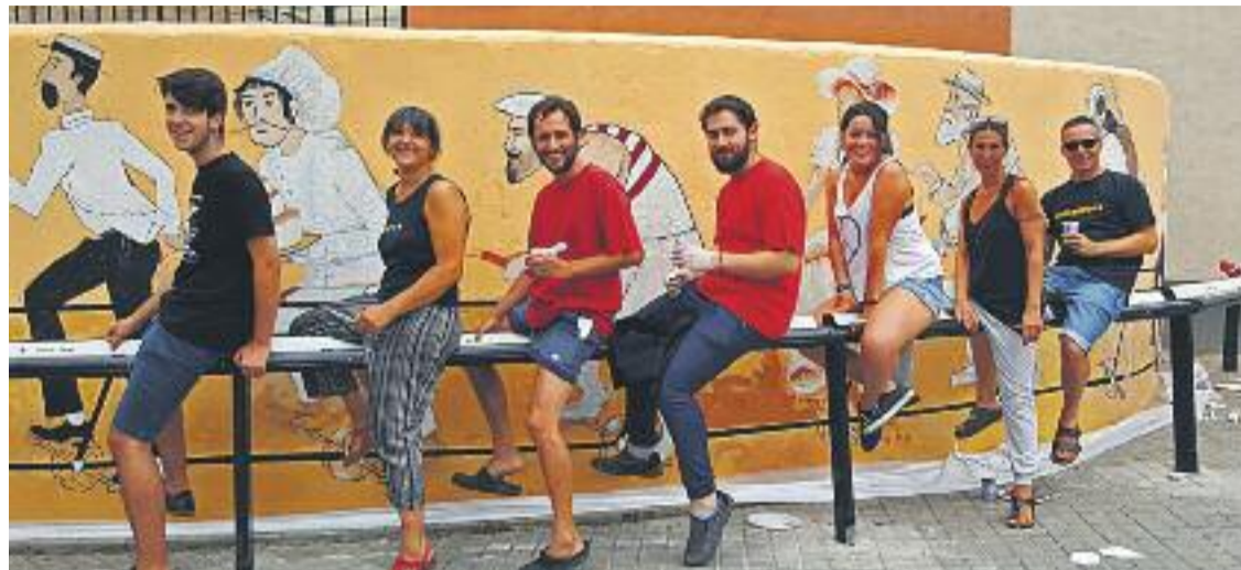
Alguns dels autors del mural davant de la seva obra.