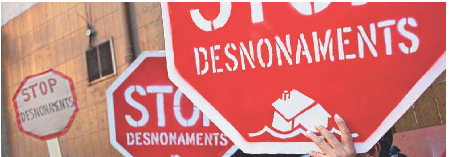
La lluita contra els desnonaments va ser una de les grans promeses electorals de Colau.