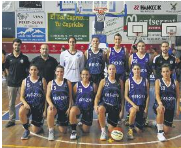
La plantilla i el cos tècnic de l'equip per a aquest curs.

ria sense haver de patir tant com l'any passat. Tan de bo puguem mantenir la inèrcia positiva de la segona volta de la temporada passada (l'equip va sumar set dels seus vuit triomfs en aquesta segona volta) ens serveixi aquesta temporada, perquè l'inici va ser molt fluïd", apunta Fernández, que també es mostra satisfet amb la seva plantilla. "Aquest estiu hem incorporat jugadores que ens donen coses que l'any passat no teníem i també espero que la primera victòria ens doni confiança per continuar i espero que amb l'ajuda del públic, que des de finals de l'any passat s'ha identificat molt amb nosaltres, ho tirem endavant", explica.