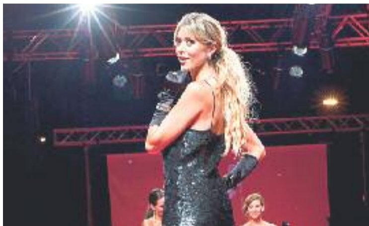
La desfilada va oferir un bon espectacle als assistents.

Segons informen des de Cor d'Horta, a la passarel·la hi van assistir al voltant d'un miler de visitants, que van gaudir d'un espectacle que va anar més enllà de la moda. De fet, des de fa un temps l'eix intenta que la seva desfilada del BCN Moda al Carrer no sigui una a l'ús, ja que hi introdueix espectacles diversos per animar l'ambient i perquè els visitants ho demanen.