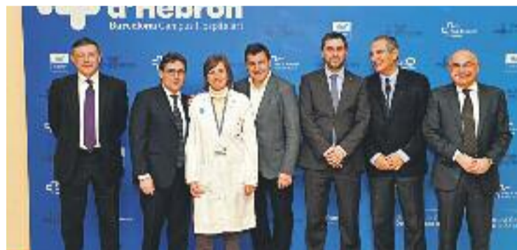
Imatge del dia de la presentació del nou campus.