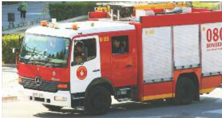
Fins al lloc dels fets es van desplaçar 14 dotacions de bombers.