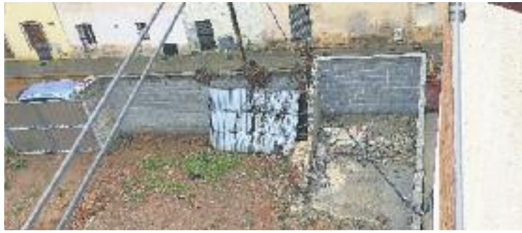
Imatge d'un dels murs (al fons a la dreta) que els veïns denuncien.