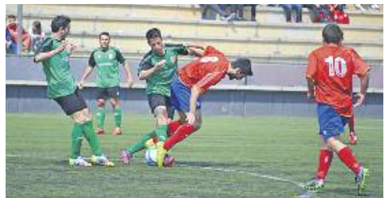
El Martinenc va patir l'efectivitat del Manresa.

FUTBOL ▶ La jornada 26a de Primera catalana no va ser positiva per als dos equips de futbol del districte. L'Horta va caure diumenge contra el Sants (0-2) i va perdre el liderat, mentre que el Martinenc va fer el mateix contra el Manresa (1-3).