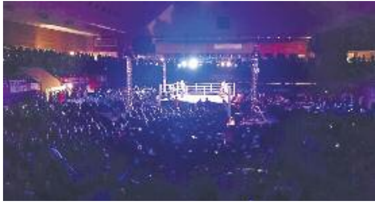
Aspecte del pavelló durant la jornada.

Tot i que Giner va arrencar molt fort, sent superior a Román durant els dos primers assalts, la dinàmica va anar canviant grà-