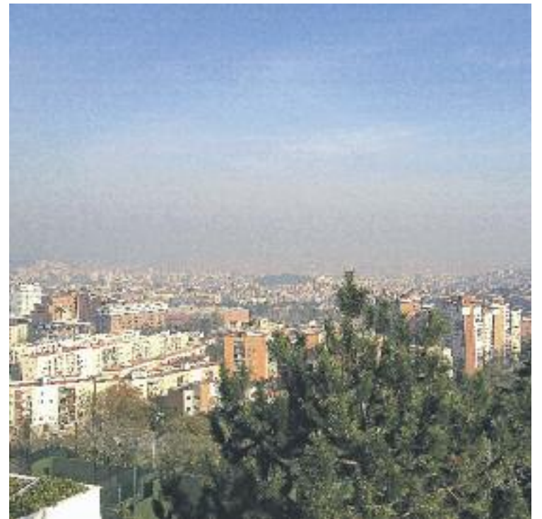
Els experts proposen reduir el trànsit de cotxes durant els episodis d'alta contaminació.