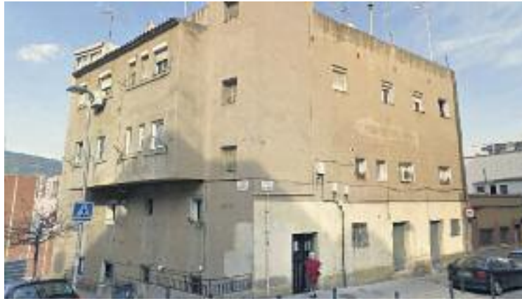
El bloc de Santa Rosalia de moment no s'enderrocarà.

La resolució del jutge va provocar que l'Ajuntament presentés les al·legacions a les mesures cautelars decretades. I és que el consistori, a través de Bagursa -l'empresa municipal enca-