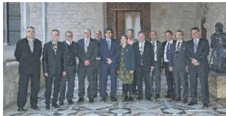
Puigdemont amb els representants comercials.