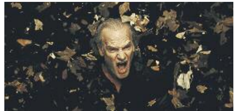
Homar, un dels protagonistes dels 150 anys dels Lluïsos.

TEATRE ▶ Lluís Homar havia de fer dues úniques sessions de Terra Baixa aquest dissabte als Lluïsos en el marc de la celebració dels 150 anys de l'entitat. L'èxit de la proposta, que ha fet que s'hagin esgotat les entrades, ha provocat que els Lluïsos hagin programat una altra actuació per diumenge.