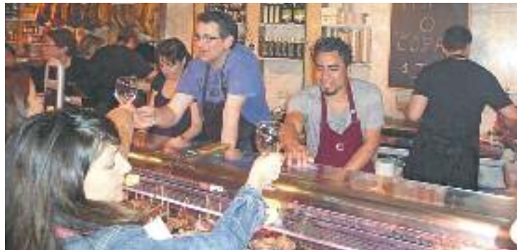
La Fira Gastronòmica sempre aplega un bon nombre de visitants.

Durant la tarda de dissabte, els visitants podran gaudir de les creacions dels paradistes del mercat, en una jornada que compta les seves edicions anteriors com a èxits de participació.