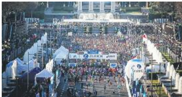
Un moment de la sortida de la maratón de 2015.

ATLETISME ▶ Objectiu complert. Més de 20.000 atletes (el repte que s'havia marcat l'organització) participaran aquest diumenge en una nova edició de la maratón, una prova que, any rere any va consolidant-se com una de les cites més atractives del panorama internacional.