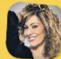
Les mil i una nits de Maria de la Pau Janer Amb Maria de la Pau Janer De dilluns a divendres, de 22 a 23 h