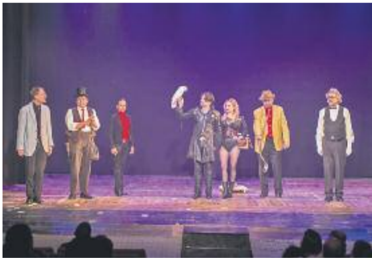
La màgia va ser la protagonista del Phorta Solidària.