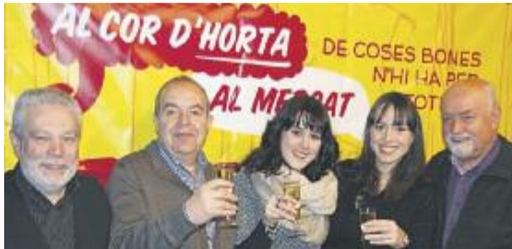
La celebració va tenir lloc dissabte 5 de març.

De fet, van ser especials per dos motius. Per una banda, perquè els premis es lliuren de manera bianual i enguany tocava. I per l'altra, perquè aquest any el Mercat d'Horta celebra el seu 65è aniversari, una efemèride que va estar molt present durant la celebració dels premis. Durant l'acte, el mercat va rebre un homenatge per part de tots els assistents, que van destacar la seva llarga trajectòria, "sent un dels motors comercials més importants del barri", tal com re-