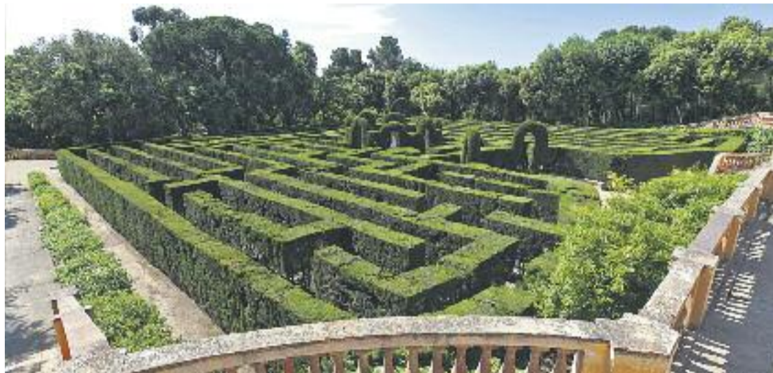
El Parc del Laberint d'Horta es va començar a construir el 1791.