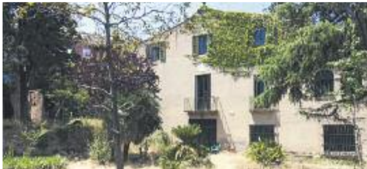
Torre Garcini serà en un futur un casal d'avis.

Perquè tot plegat sigui una realitat, ara caldrà que l'Ajunta-