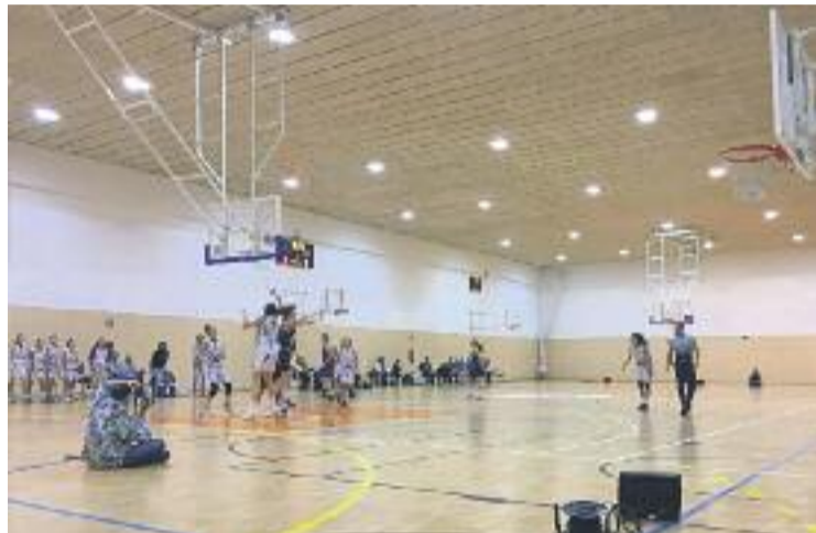
L'equip va aconseguir la cinquena victòria del curs.

Tot i que l'inici del partit va ser força fred per part dels dos equips, el Lima va saber superar aquesta adversitat i, gràcies en part a una gran defensa, van assecar l'atac de les visitants i van aconseguir un avantatge de 14 punts (19-5). Les d'Isaac Fernández van distanciar-se encara més en el segon període, de