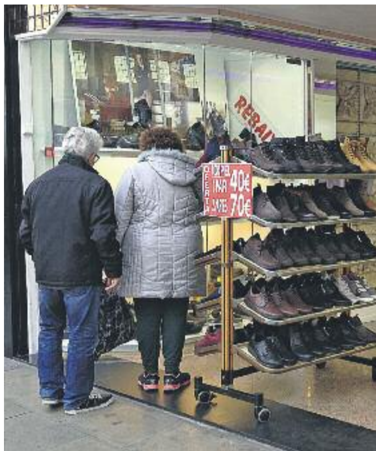
Els descomptes de la campanya de rebaixes han oscil·lat entre el 30 i el 70%.