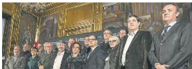
Escenificació de l'acord dels horaris.

HORARIS ▶ Comerciants, sindicats i Ajuntament van arribar fa uns dies a un acord per obrir els comerços cinc diumenges en els mesos de maig i octubre. Les dates són el 8, 15 i 22 de maig i el 2 i 9 d'octubre. Pel que fa als horaris, les botigues obriran a les 12 del migdia i hauran de tancar a les vuit de la tarda.