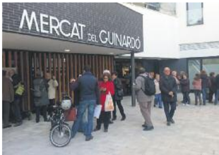
Les obres han millorat l'entorn del Mercat del Guinardó.

Les obres, que van començar el passat mes de novembre, han tingut un cost de 628.000 euros.