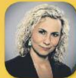
El matí de Catalunya Ràdio Amb Mònica Terribas De dilluns a divendres, de 6 a 12 h