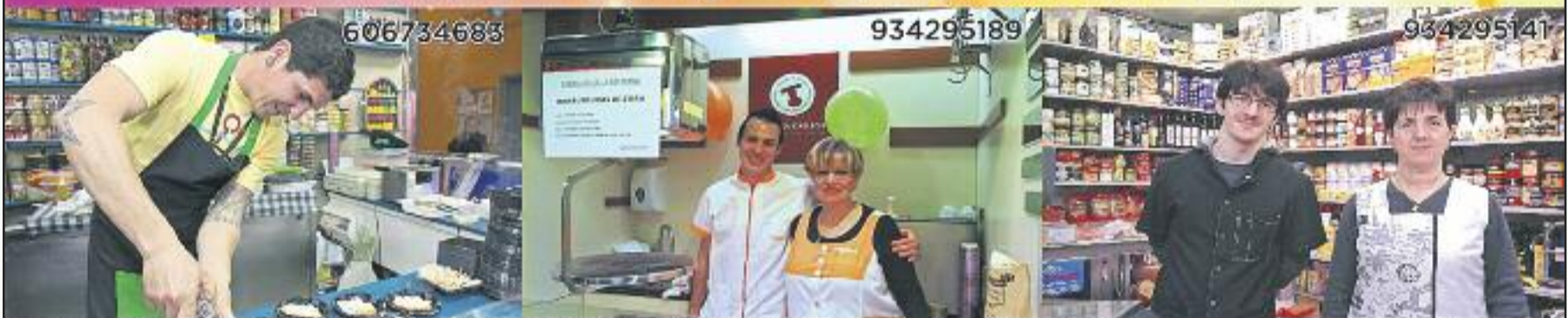
Pesca Salada Melania pda. 77 Carnisseria Magrans pda. 49 Mayol pda. 44

Fira Gastronòmica & Nit de Comerç tots ells hi seran!