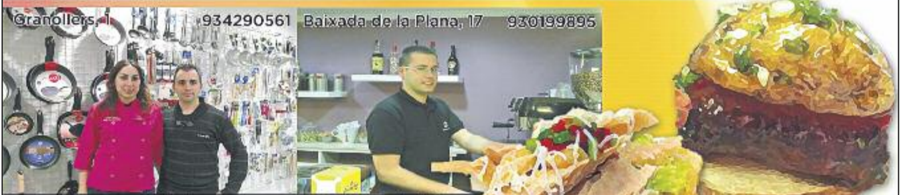
La Botigueta d'Horta El Cafè de les Flors