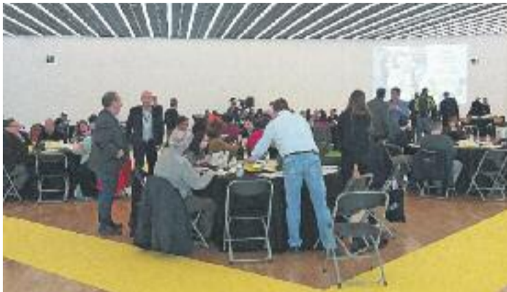
La trobada va aplegar 250 persones.

Per aquest motiu, el passat dia 6 de febrer es va celebrar la primera jornada participativa per decidir el Pla d'Actuació Municipal esportiu, en el marc del Pla Estratègic de l'Esport. Durant aquella sessió, oberta a la participació d'esportistes, educadors, monitors, clubs i federacions diverses, van sortir tot un seguit de propostes i mesures per aplicar en els pròxims anys.