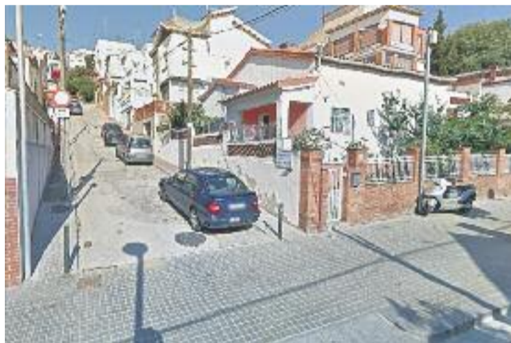
Fa tres anys que el passatge està tancat per mal estat.

El cas es va conèixer després que una veïna denunciés la situació en una carta a El Periódico .