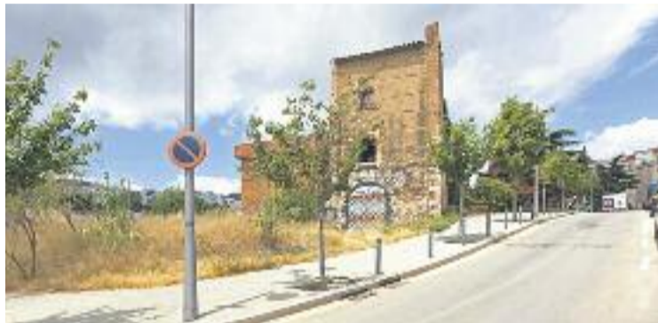
La torre del Moro està en estat de ruïna.