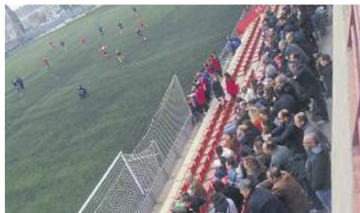
Un partit de futbol al municipal del Guinardó.

Per altra banda, el Martinenc va estrenar fa uns dies la seva nova pàgina web, un canvi que ha acompanyat al redisseny de l'escut de l'entitat aprovat pels socis fa unes setmanes.