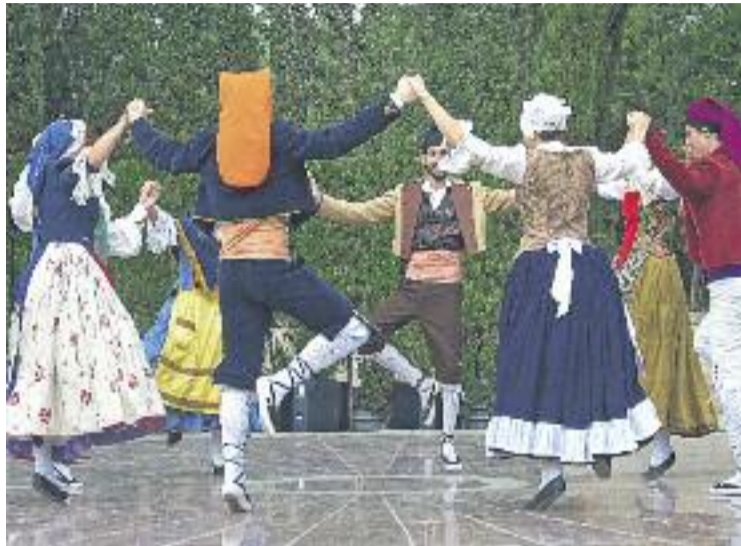
L'Esbart és una entitat històrica d'Horta.

La celebració també va tenir un moment molt especial quan es van projectar imatges de l'arxiu fotogràfic de l'Esbart començant per les de Josep Maria Castells, mestre i fundador de l'entitat, ballant durant els anys 40. Tot seguit es van poder veure fotografies de les primeres ac-