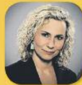
El matí de Catalunya Ràdio Amb Mònica Terribas De dilluns a divendres, de 6 a 12 h