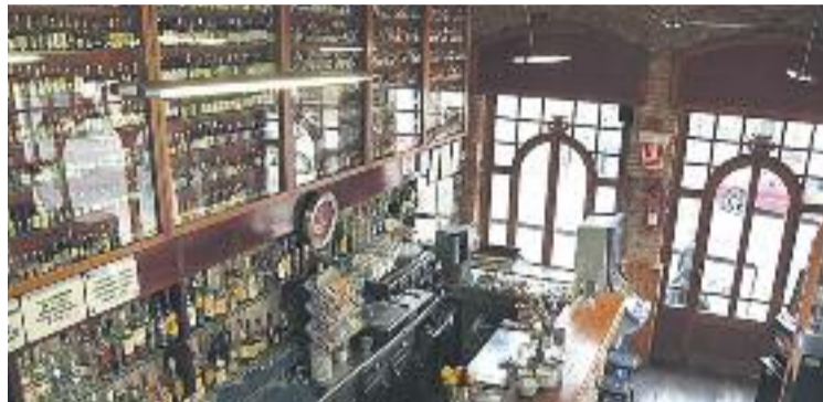
El Bar Quimet va néixer el 1927.

El nou pla té com a objectiu protegir aquests negocis, tot i que reconeix la seva incapacitat