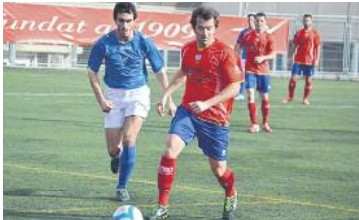
El Lloret va penalitzar les errades defensives del Martinenc.

Els d'Agustín Vacas van cedir la primera derrota de la temporada al Guinardó en un partit que van començar dominant, però al minut 33 els selvatans es van avançar gràcies a un gol de Bader des del punt de penal. Caballero al 43 i Aparicio al 63 van situar un 0-3 gairebé impossible de remuntar, però els vermells no havien dit la seva darrera paraula. Arranz va retallar distàncies i Aleix va situar el 2-3 a cinc minuts