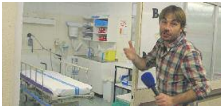
Quim Masferrer, en un moment de la seva visita al Vall d'Hebron.

TELEVISIÓ ▶ L'Hospital Vall d'Hebron va rebre la nit de Nadal una visita molt especial. Va ser la de Quim Masferrer, el protagonista d'un dels programes de més èxit de TV3, 'El foraster'. L'episodi es va emetre el passat dilluns 4 de gener i va tornar a demostrar la seva tirada, ja que amb 614.000 espectadors i un 19,4% de quota de pantalla, es va convertir en l'espai televisiu més vist del dia.