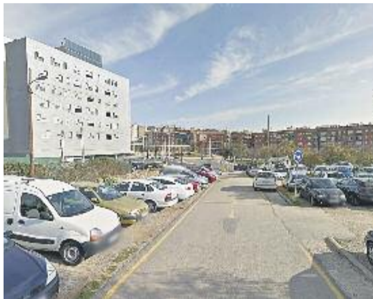
L'aparcament on la plataforma vol que s'hi faci l'institut.

La ubicació per aquest nou institut, segons la proposta d'"Horta Vol Institut", hauria de ser en un terreny que hi ha al costat de l'avinguda de l'Estat de Catalunya i que té qualificació per a fer-hi equipaments municipals.