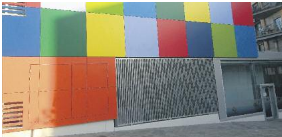
L'escola bressol simula un Cub de Rubik.