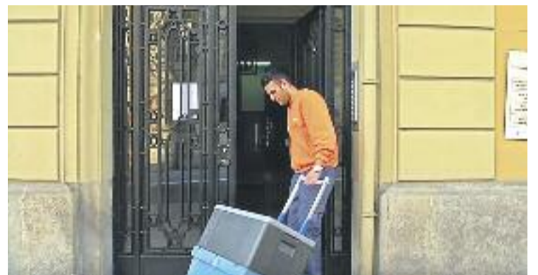
El servei funciona al 53% dels mercats municipals.

INCLUSIÓ ▶ El servei a domicili dels mercats barcelonins ha arribat als de Galvany, les Corts, la Guineueta i Trinitat Nova, quatre nous equipaments que fan que la xifra de mercats adherits a aquesta iniciativa arribi als 21, d'un total de 39.