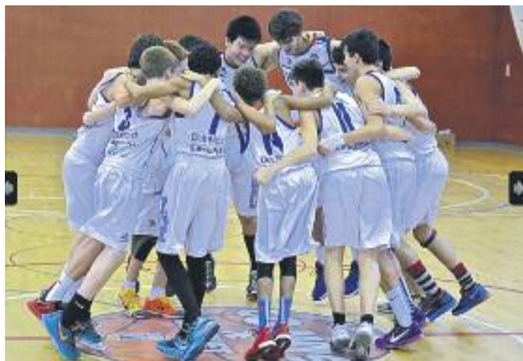
El CB l'Hospitalet va aconseguir proclamar-se campió.