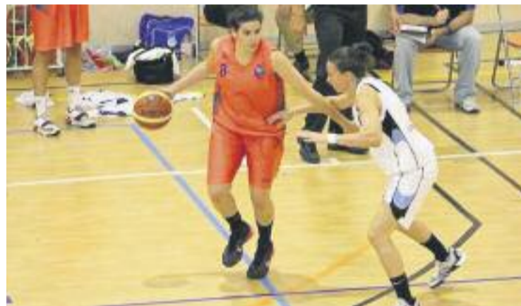
El Lima-Horta només ha aconseguit guanyar un partit a la lliga.

Demà l'equip tornarà a jugar a domicili, a la pista del Plenilunio Distrito Olímpico madrileny.