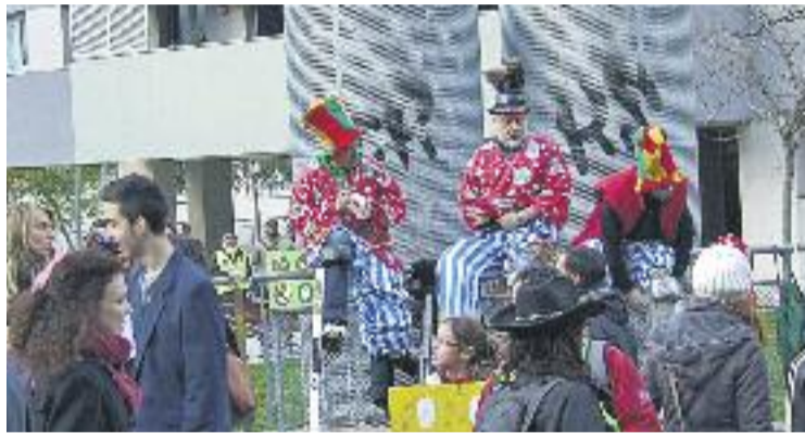
Les rues tornaran a envair els carrers del districte.

Els participants en la rua optaran a tres premis de 500, 300