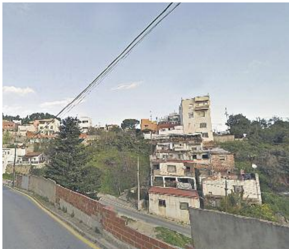
A l'esquerra, Pedralbes, el barri amb una esperança de vida més alta. A la dreta, Torre Barró, on l'esperança de vida és més baixa.