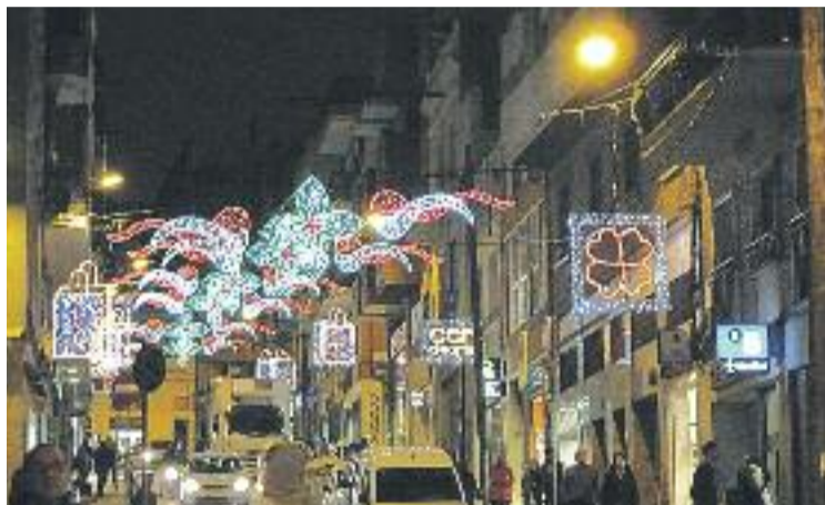
L'encesa dels llums de Nadal es farà efectiva el 27 de novembre.

Aquesta iniciativa s'impulsa a setze eixos comercials de la ciutat, entre ells la Federació Cor d'Horta i Mercat i l'Eix Maragall, i tindrà dos trams clarament diferenciats. A partir de dilluns, i fins al dia 30 de novembre, els consumidors rebran xecs amb un import per les compres que facin a les botigues. L'import d'aquests xecs es podrà gastar en-