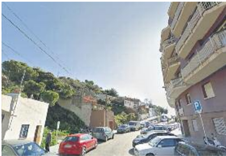
Zona del carrer Mühlberg on el trànsit queda tallat.