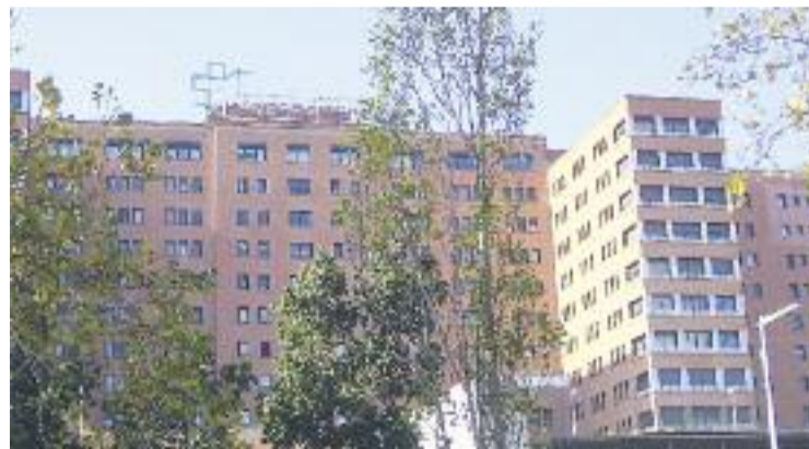
L'Hospital Vall d'Hebron, en una imatge d'arxiu.

D'altra banda, l'Hospital Vall d'Hebron va complir el passat cinc d'octubre 60 anys. Des d'aquest dia, i durant tot el 2016, el centre ha preparat tot un seguit d'activitats, com ara conferències i debats, tant per als professionals com per a la ciutadania.