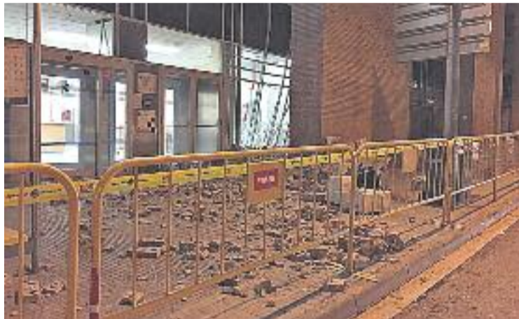
Imatge de l'entrada del CAP just després del despreniment.

Al llarg d'aquests dies, i fins a la reobertura del CAP d'Horta, els usuaris s'han dirigit al CAP Sant Rafael, al passeig de la Vall d'Hebron; al CAP Carmel, al carrer de Murtra, o al CUAP Horta, al carrer de Sant Gaudenci. Per facilitar la mobilitat entre les persones afectades, l'Ajuntament ha habilitat un servei de busos gratuït que en-