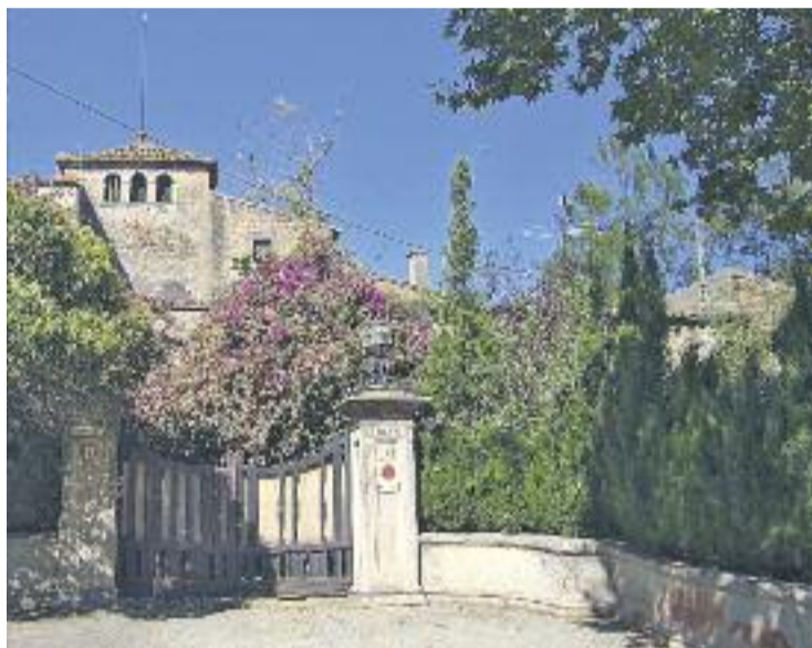
Can Fargas serà el curs que ve una escola municipal de música.

Sembla doncs que tot i que la reivindicació de l'escola municipal ja no és necessària, la Festa de la Música continua gaudint d'una bona salut.