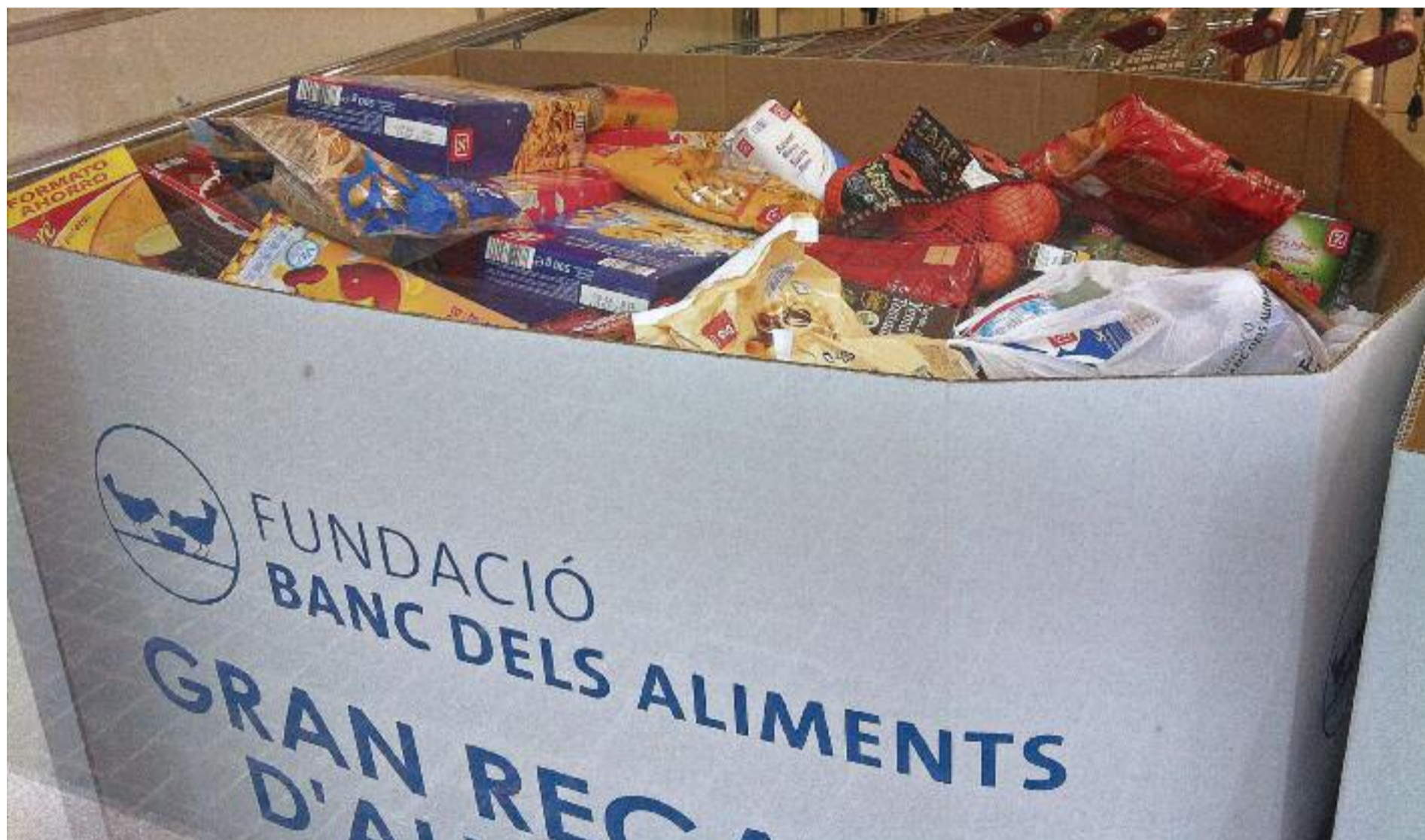
El repte serà, com a mínim, igualar les 4.600 tones d'aliments que es van recollir l'any passat.

» Els dies 27 i 28 d'aquest mes se celebrarà la setena edició del Gran Recapte, l'acció que organitza el Banc dels Aliments per garantir una cobertura alimentària bàsica