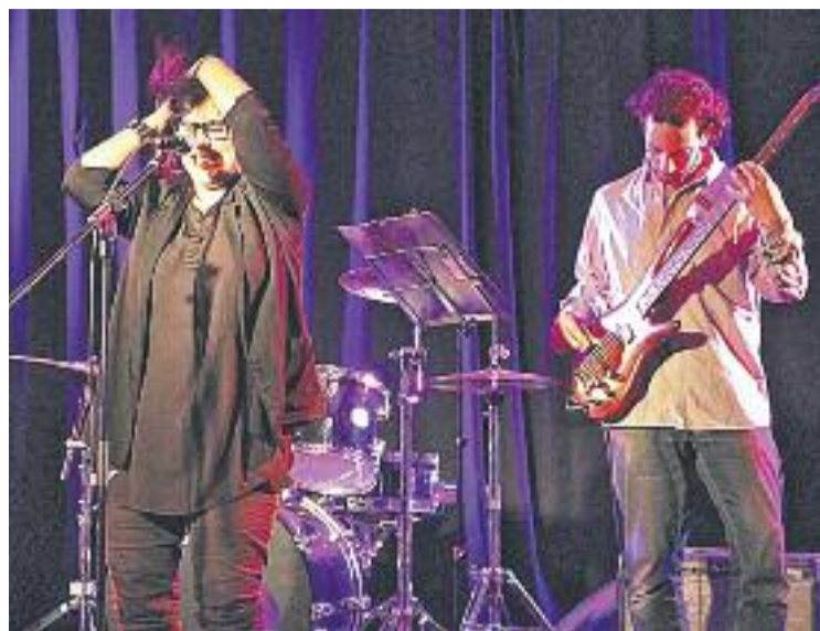
La música és una de les potes del Festival Estrena't.

La Mostra de Teatre d'Horta-Guinardó ha buscat potenciar, un any més, els grups de teatre del districte i enguany ha presentat com a novetat una Fila o perquè la gent pugui "fer aportacions econòmiques que, una vegada recollides, seran donades a l'Associació Sant Ce-