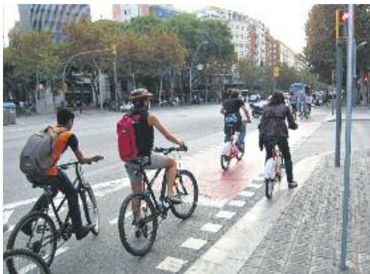
L'ús de la bicicleta a la ciutat ha crescut en els últims anys.

L'estudi del RACC, en canvi, també mostra com la xifra de víctimes greus i morts s'ha reduït en els darrers anys, ja que el 2014 va ser de set, mentre que el 2013 va ser de 17 i el 2012 de 12. Entre el període analitzat, només el 2009 la xifra va ser menor, ja que es va quedar en sis. Un altre aspecte que cal destacar i que s'apunta a l'estudi és el del nivell de risc de circular amb bicicleta. Si bé és molt