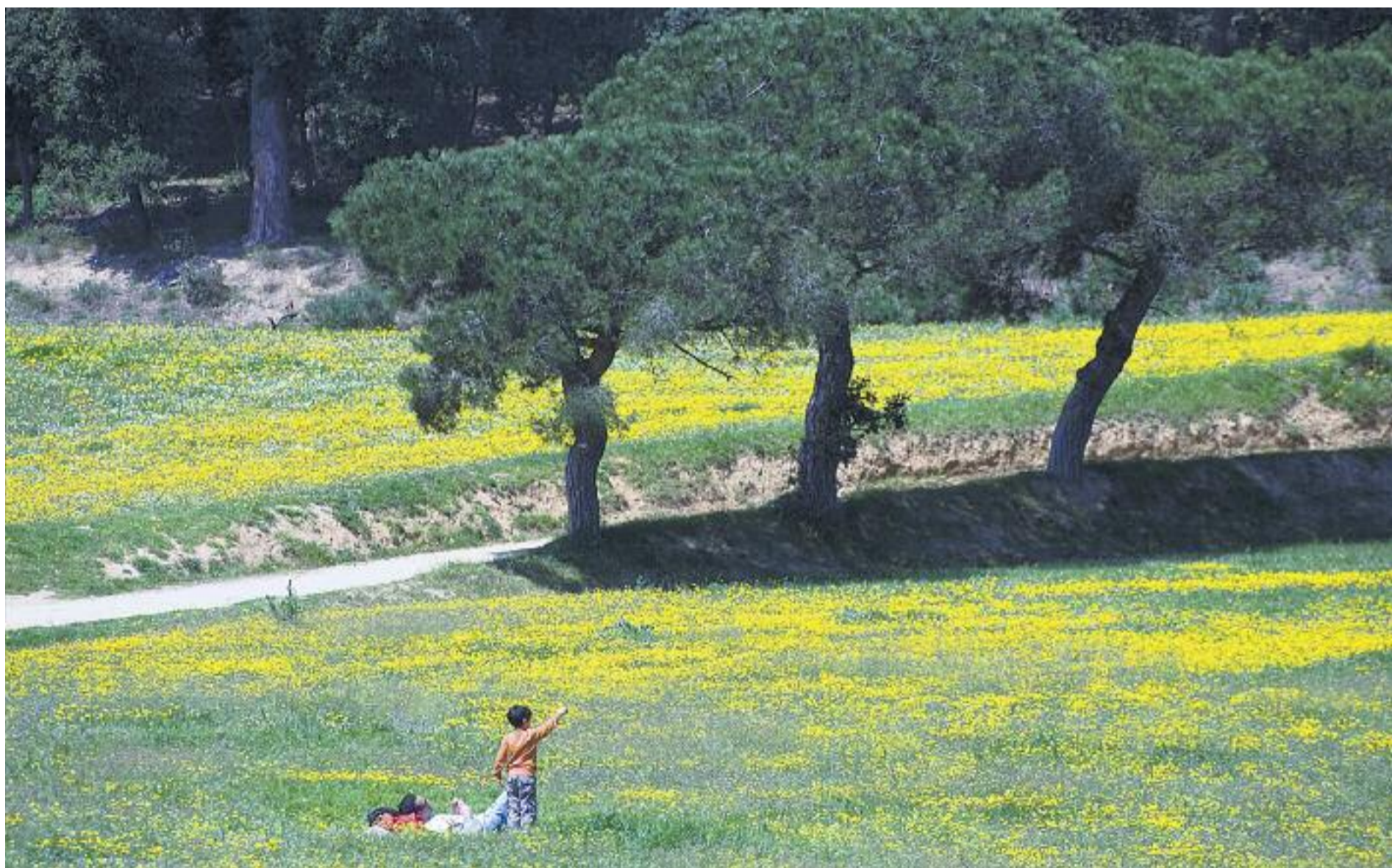
La natura es converteix en l'escenari idíl·lic per fugir de la rutina.

» Al voltant de Barcelona es pot gaudir de la natura en família en més de 150 cases de pagès i allotjaments rurals d'arquitectura tradicional ubicats en petits municipis o en plena natura