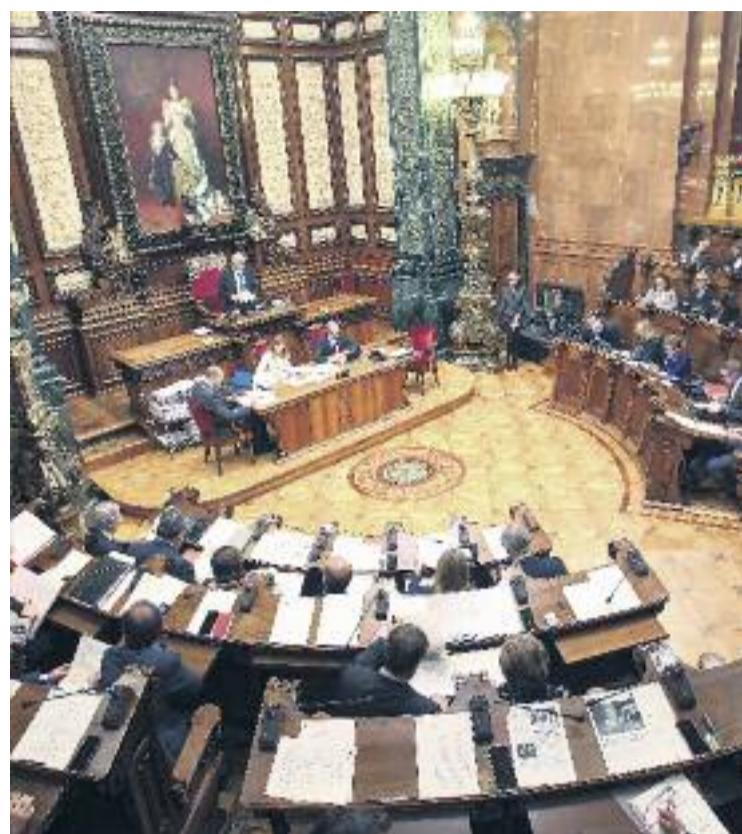
El pròxim Ple de l'Ajuntament pot estar marcat per la fragmentació i la dificultat dels partits per articular majories.