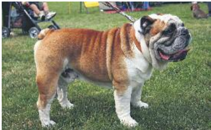
Horta serà l'escenari d'una jornada festiva amb les mascotes.