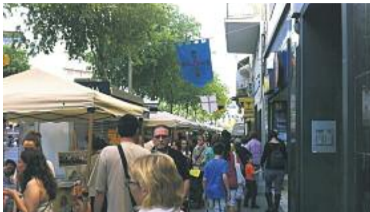
La fira comptarà amb 60 firaires arribats d'arreu Catalunya.

De manera paral·lela, l'eix comercial celebrarà, només dis-