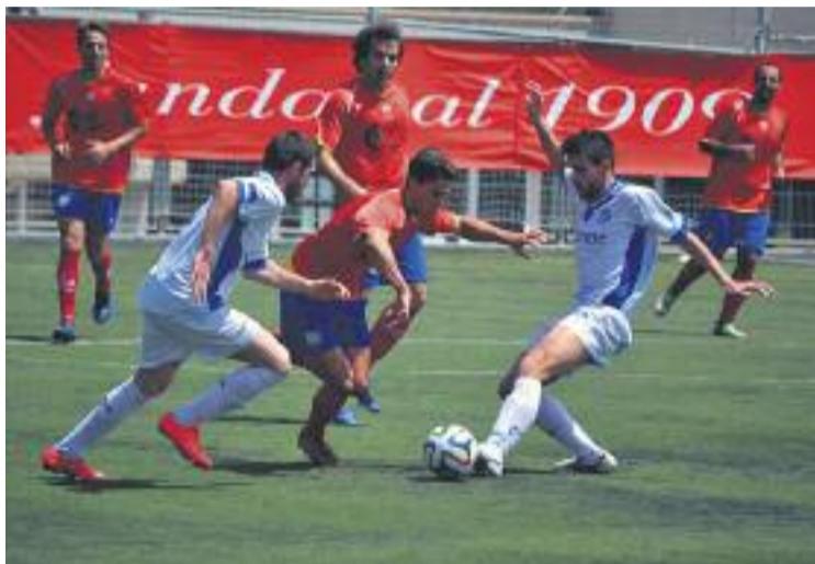
L'Horta va caure al Municipal del Guinardó.

Els d'Agustín Vacas van caure al descens a la jornada 33, i des d'aleshores només han sumat 2 punts dels últims 18, i van consumir el descens aquest passat cap de setmana.