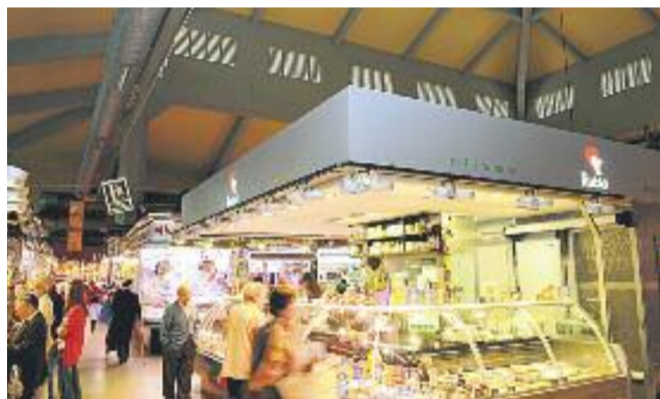
La Setmana dels Mercats començarà aquest divendres.

CAMPANYA ▶ Els mercats de Barcelona tornaran a omplir-se d'activitats festives i lúdiques per atreure-hi visitants i per demostrar que són centres plens de vida amb la Setmana Internacional dels Mercats, que enguany celebra la seva segona edició amb el lema Estima el teu Mercat i que es desenvoluparà del 15 al 31 de maig.