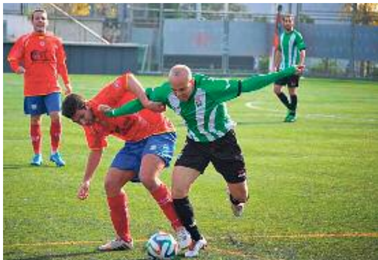
El Peralada serà un dels rivals del Martinenc.

Els homes d'Agustín Vacas tenen per endavant quatre partits vitals de cara a la salvació, ja que es troben a la zona baixa de la taula, lluitant amb equips com el Castelldefels, el Santfeliuenc o el Manlleu. Els hortencs tenen un calendari molt exigent, especialment a casa, on rebran la visita de la Pobla de Mafumet (líder) aquest cap de setmana, mentre que d'aquí dues setmanes disputaran un derbi barceloní contra l'Europa. Els hortencs clouran la temporada amb desplaçaments a Rubí i a Peralada.