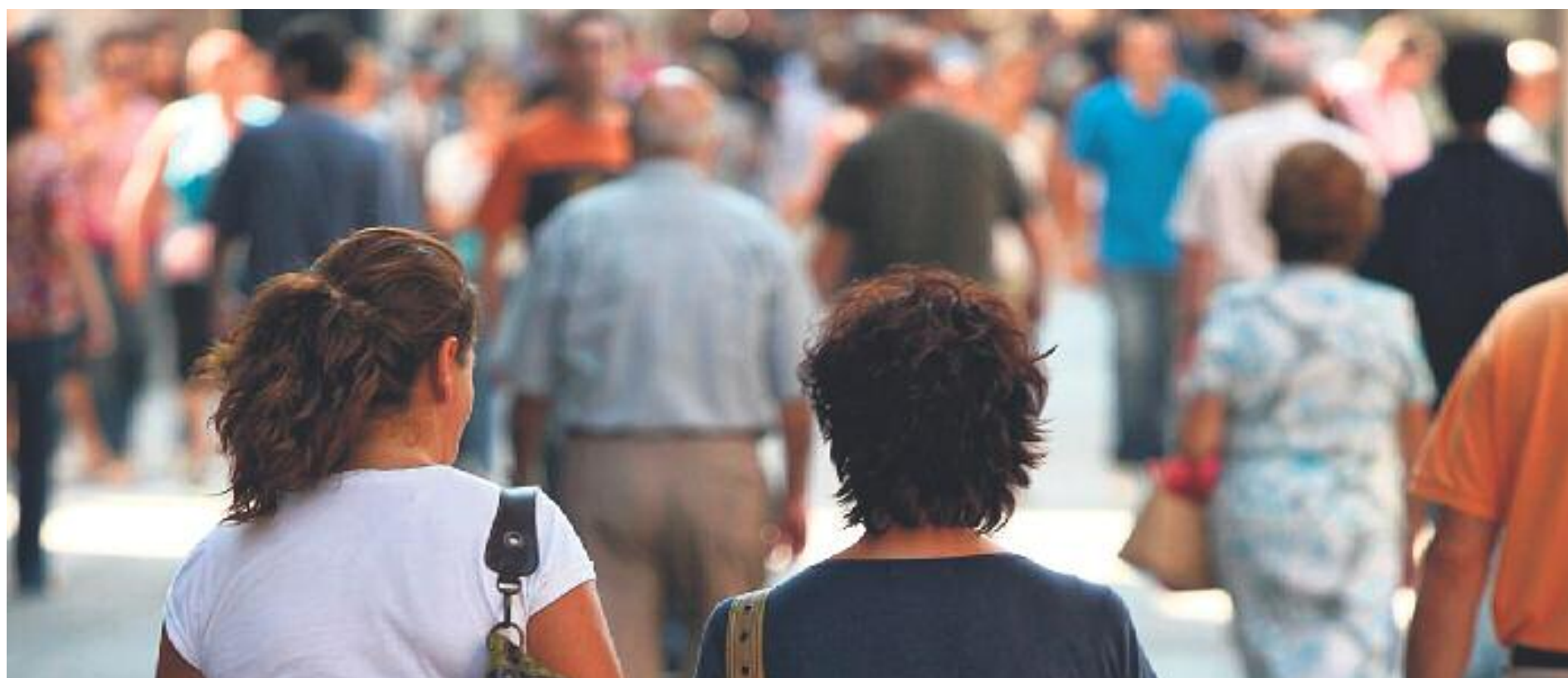
Només quatre de cada deu barcelonins té el català com a llengua habitual.