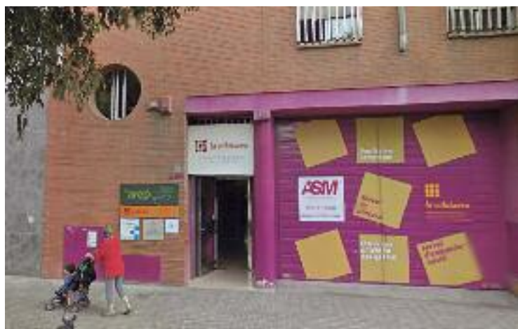
Seu de l'associació l'Arep.

De cara al mes que ve, l'associació participarà en la Festa Major del Guinardó del dia 9 de maig. Una setmana més tard, l'eix celebrarà un dels seus esdeveniments insígnia, la Fira Medieval i Festa del Comerç al passeig Maragall.