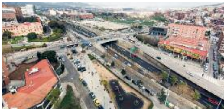
Una imatge aèria de la Ronda de Dalt.