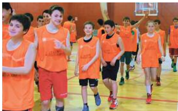
El bon ambient va regnar durant les jornades esportives.