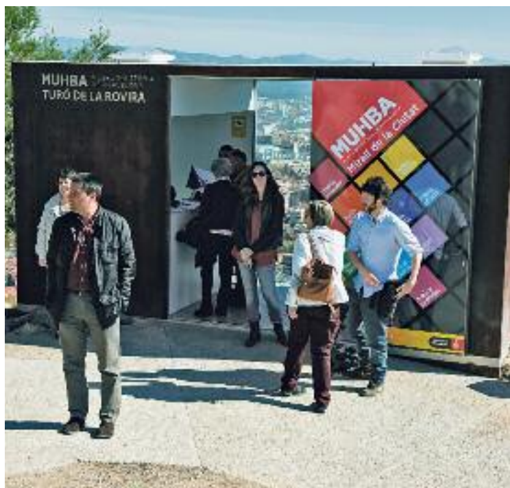
Els visitants poden descobrir la història de la zona.