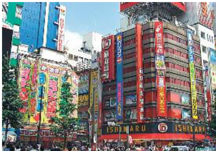
El viatge a Tòquio tindrà lloc del 9 al 16 de maig.