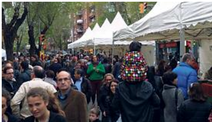
Visitants durant la fira al carrer Tajo.

Des de les 5 de la tarda i fins les 12 de la nit, els visitants a l'esdeveniment van poder gaudir dels articles que oferien els botiguers participants i de les creacions gastronòmiques dels paradistes del mercat. La cita va ocupar l'interior del Mercat d'Horta i també una part del carrer Tajo, on s'hi va instal·lar una