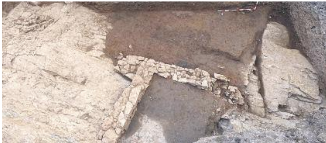
Vista general de les estances del poblat iber.