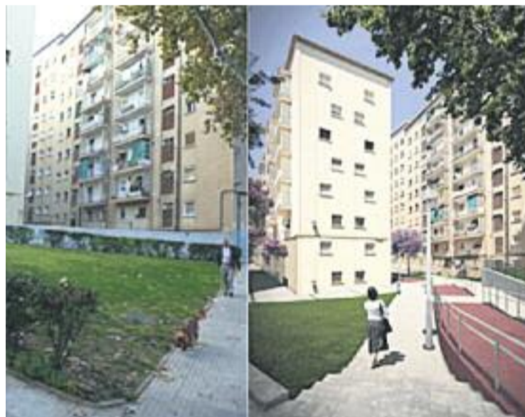
L'illa abans de les obres i una imatge sobre com quedarà.

D'altra banda, a finals de febrer també va començar la segona fase de les obres de millora del clavegueram del barri de la Clota, que preveu la col·locació d'un nou col·lector al pasatge de Feliu i la instal·lació d'una canonada d'aigua potable que anirà des del carrer Alarcón fins al de la Puríssima. Això permetrà donar servei a dues parcel·les que actualment no tenen aigua potable.