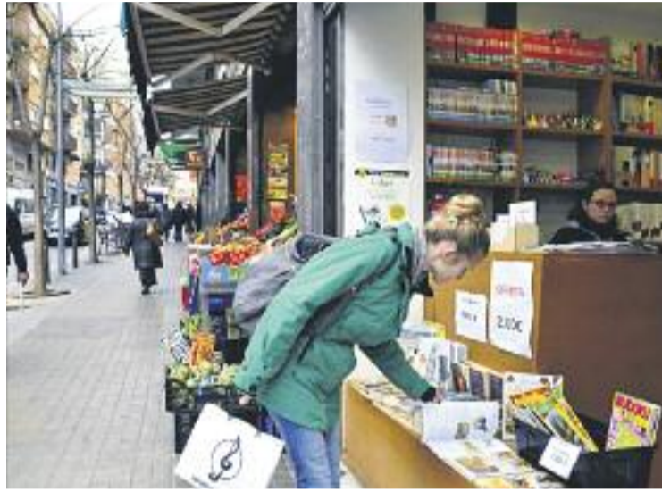
La campanya oficial de rebaixes ja ha arribat a la seva fi.

Des de l'associació de botiguers Carmel Comerç asseguren que "les vendes de les rebaixes d'enguany han estat més o menys com les de l'any passat" i lamen-