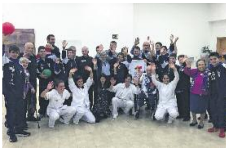
Foto de família dels participants en l'activitat en comú.

SOLIDARITAT ▶ Els dos extrems de l'etapa vital d'un ésser humà, la infantesa i la vellesa, són complementaris i es necessiten per tal d'aprendre mútuament i compartir experiències. En aquest sentit, el passat divendres 25 de febrer l'equip infantil de primer any de la UE Horta va visitar la residència per a gent gran que el Grup Amma –patrocinador de la secció de bàsquet del club hortenc des de fa alguns anys– té al districte, per tal que compartissin una estona