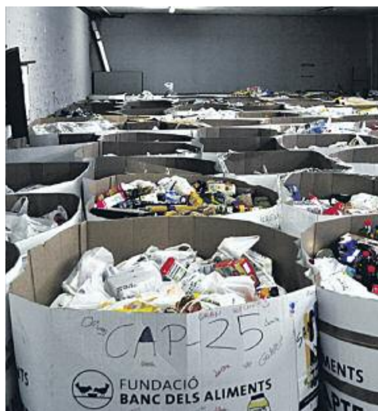
Imatges de la primera edició del Gran Dinar celebrat a Ciutat Vella el passat novembre (esquerra) i del Gran Recapte d'Aliments (dreta).