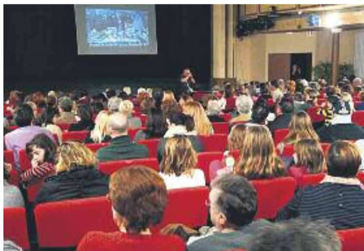
Imatge d'una de les funcions del festival.