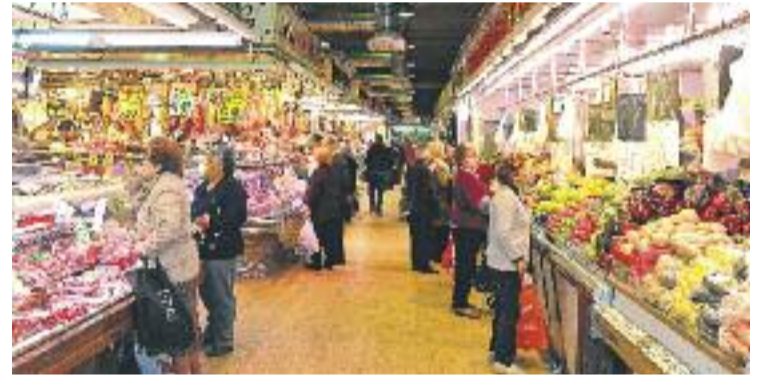
El futur dels mercats serà la temàtica principal del congrés.

El congrés també comptarà amb visites guiades a alguns mercats de la ciutat, com el de Sants, la Boqueria o el nou edifici dels Encants Vells. D'aquesta manera, els mercats també tindran el seu congrés particular a la ciutat.