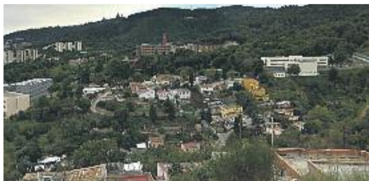
Imatge aèria del barri de la Font del Gos.

Les mobilitzacions dels veïns reclamant un canvi de la seva situació i una millora integral de les infraestructures i equipaments del barri es remunten molt enrere, però tal com denuncien des de l'Associació de Veïns, tot continua igual. El primer pas perquè alguna