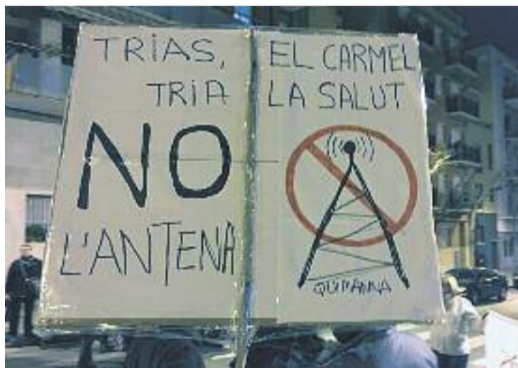
Imatge d'una de les protestes del febrer.

mes de gener quan un grup de veïns del bloc va decidir portar als jutjats la junta veïnal on es va votar favorablement a la instal·lació de l'antena. Els veïns contraris a l'antena van considerar que la decisió no tenia legitimitat, ja que "l'empresa constructora del bloc, Quimanna Hortal SL, té en propietat o gestiona el 80% dels pisos, locals i places d'aparcament". Una situació que, segons ells, suposa "un abús d'autoritat".