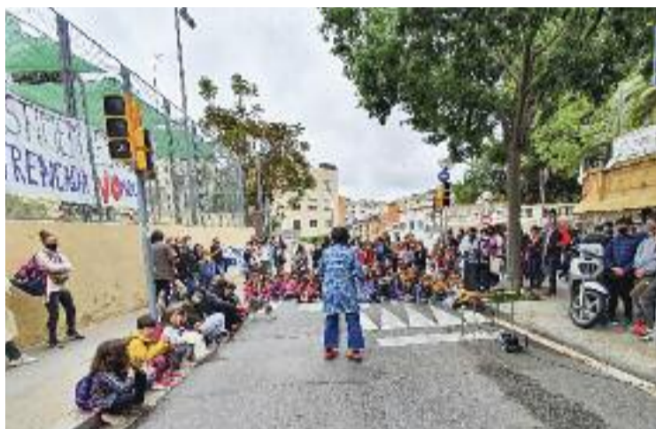
La protesta del passat 7 de maig.

“La reforma és urgent i volem que estigui enllestida abans del