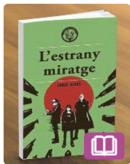
L'estrany miratge Enric Herce

Una recompensa anònima ofereix una quantitat obscena de diners a canvi dels assassins de l'hereu de la megacorp Holloway-Ikeda. La Duna i la Lorelei, autores del crim, podrien sospitar que qui ha posat preu als seus caps són els pares del difunt, si no fos perquè ells mateixos les van contractar per eliminar-lo. Una història d'intriga en un món alhora real i virtual.