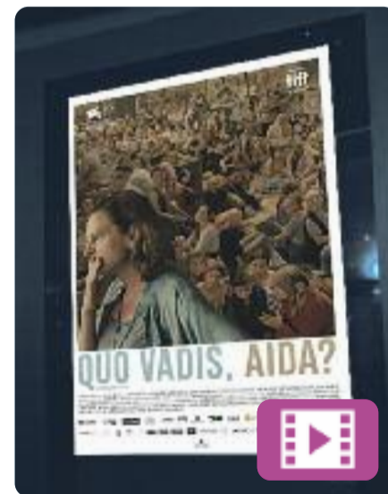
Quo Vadis, Aida? Jasmila Zbanic

Bòsnia, juliol de 1995. L'Aida treballa com a traductora per a l'ONU a una petita ciutat, Srebrenica. Quan l'exèrcit serbi l'ocupa, la seva família es troba entre els milers de persones que busquen refugi als camps de l'ONU. I, en aquest sentit, l'Aida té accés a informació important. Aquest film va estar nominat a millor pel·lícula internacional als Oscars del 2020.