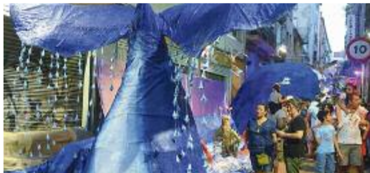
Imatge d'arxiu de la Festa Major de Gràcia.