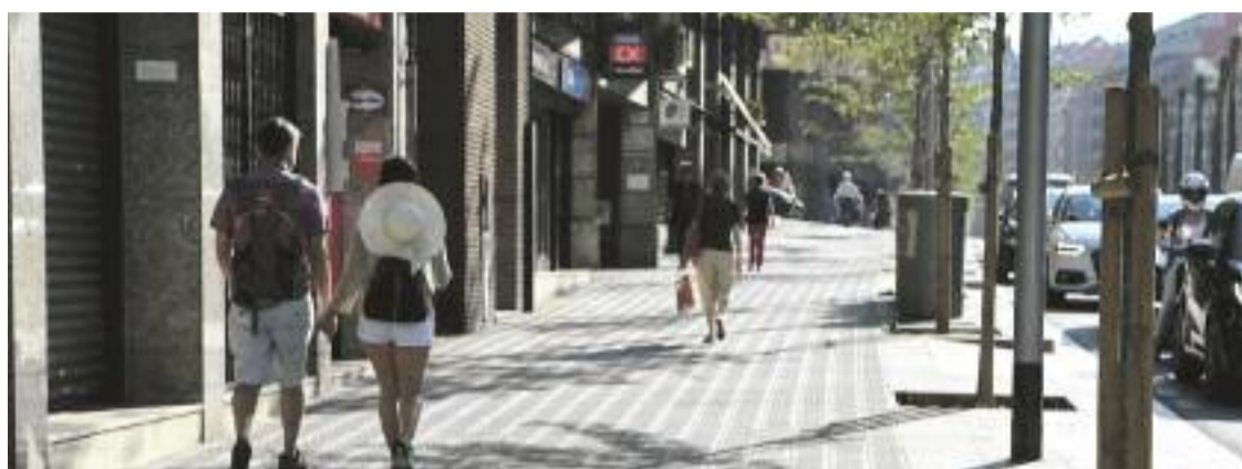
El comerç de la travessera de Dalt fa anys que viu dificultats.

L'altre punt que critiquen els comerciants de la zona és la remodelació de la mateixa travessera de Dalt. “La zona ha quedat totalment deshumanitzada amb les obres. Només durant el temps que van durar vam tenir pèrdues d'un 40%”, lamenta Espada. Altres factors, i posa com a exemples la derivació del turisme cap a Vallcarca i la pandèmia, també han su-