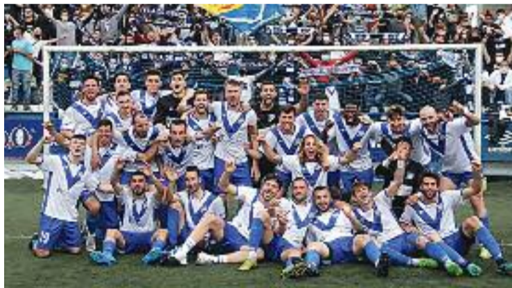
La celebració, després del triomf contra el Girona B.