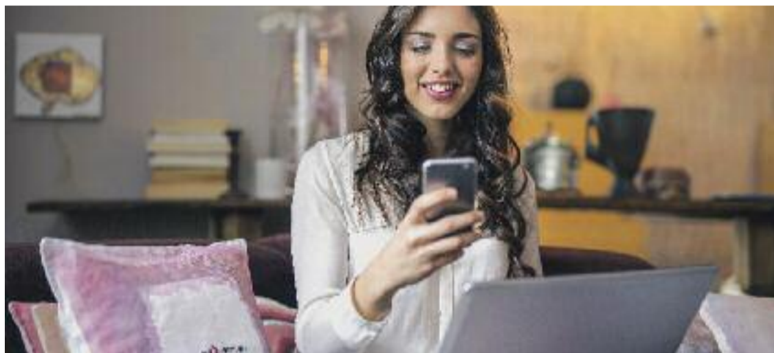
Al nou portal s'hi pot accedir tant des d'ordinadors com des de telèfons mòbils o tauletes.

Si ets autònom, disposes d'una pàgina específica en la qual trobaràs, agrupats, tots els tràmits que puguis necessitar i la informació que et caldrà saber abans de fer servir cap servei. També comptes amb una guia que dona resposta als dubtes que et puguin sor-