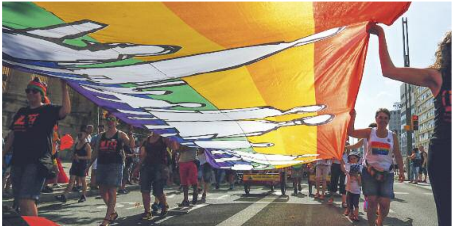
El 17 de maig se celebra el Dia Internacional Contra l'Homofòbia.

Precisament, els problemes de convivència en l'àmbit familiar, accentuats pel confinament domiciliari durant l'etapa més