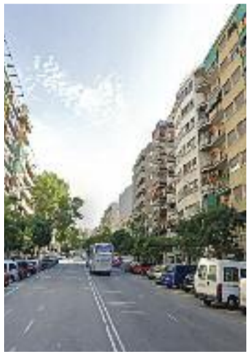
El carrer de Pi i Margall.