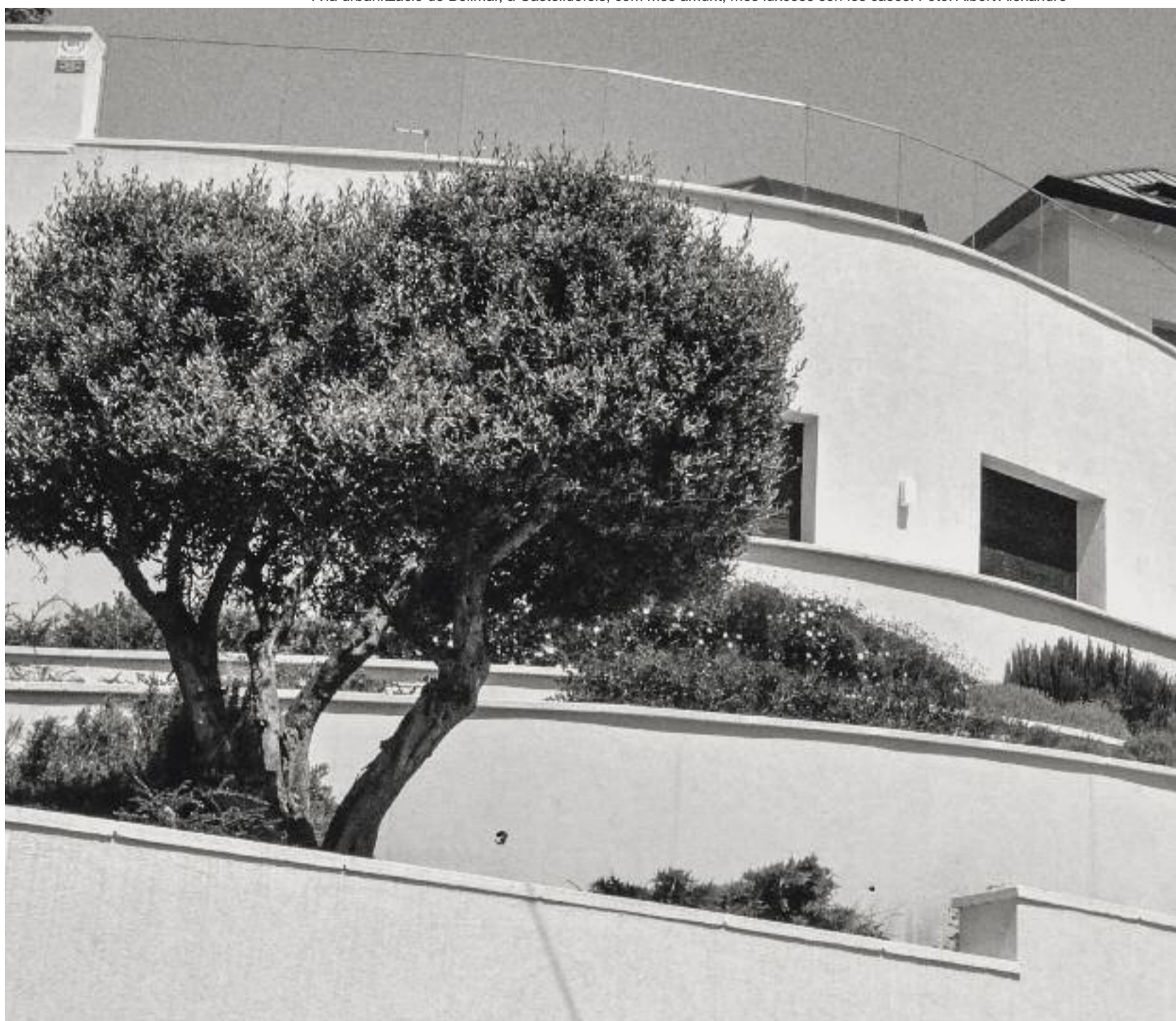
A la urbanització de Bellmar, a Castelldefels, com més amunt, més luxoses són les cases.

Com s'explica que les classes amb més capacitat adquisitiva estiguin tan disperses en el territori? L'historiador i periodista Rafa Burgos parla d'un procés de mobilitat que comença al segle