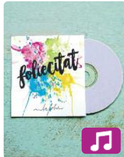
Folietat La Folie

Premi Enderrock a Artista Revelació per la Crítica, amb Folietat el grup La Folie reivindica el somriure, la llum, l'optimisme i la vitalitat, així com les ganes d'agradar i de transmetre bona energia.