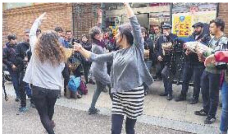
Els mercats tornaran a ser una festa durant el febrer.

El dissabte 24 de febrer, els mercats de l'Abaceria i de la Llibertat acolliran l'actuació d'ARHiDansa, mentre que tancaran el cicle els Violins del Tradicionari el 10 de març als de Lesseps i de l'Estrella.