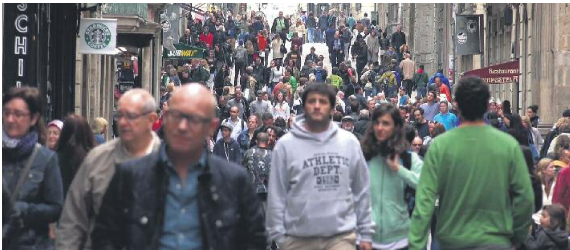
Un 4% més de veïns han passat a formar part del que es considera classe mitjana.