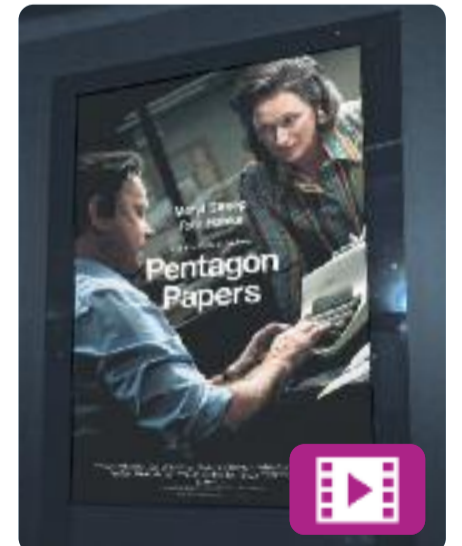
Els arxius del Pentàgon Steven Spielberg

Més d'un mes després de la seva estrena als Estats Units arriba a casa nostra l'últim títol de la factoria d'Steven Spielberg.