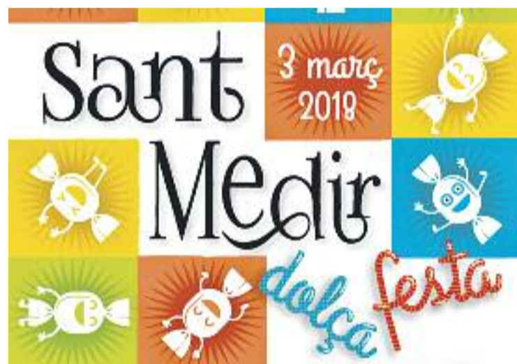
Una imatge del cartell guanyador.

Com cada any, Sant Medir se celebrarà el pròxim dia 3 de març, que enguany cau en dissabte. Durant aquest dia, els carrers i les places de Gràcia s'ompliran de gent per rebre les colles de Sant Medir. La cercavila servirà perquè els romeus i romeves llencin caramels a la gent.