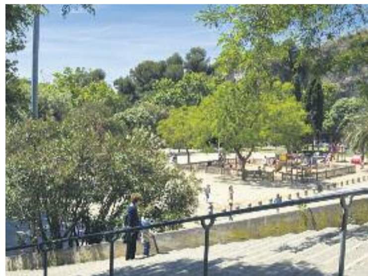
El Parc de la Creueta del Coll és un pulmó verd del barri.

Des del consistori, informa Beteve, els van assegurar que hi ha prevista una reforma integral del parc abans que finalitzi aquesta legislatura.