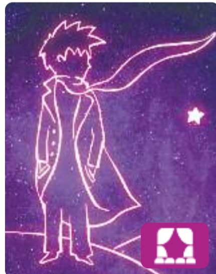
El petit príncep Àngel Llàcer i Manu Guix

Actors reals i personatges virtuals en 3D s'uneixen per explicar el relat sobre l'amistat, l'amor, la responsabilitat i el sentit de la vida escrit per Saint-Exupéry i destinat a nens de totes les edats (dels 4 als 100 anys).