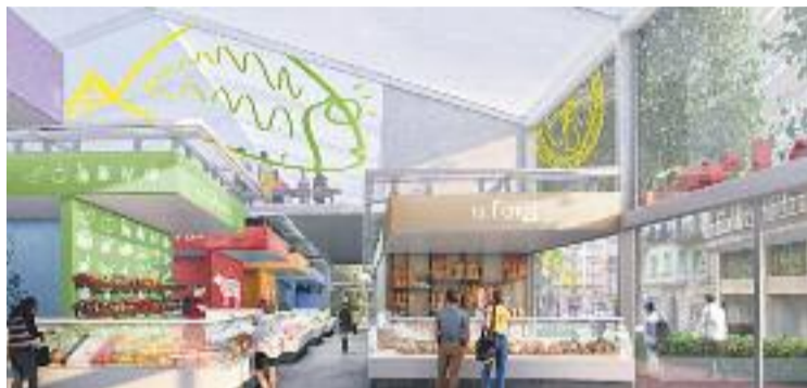
Una imatge virtual de com serà la carpa per dins.

La carpa obrirà les portes al passeig de Sant Joan, entre els carrers Indústria i Sant Antoni Maria Claret. En aquest sentit, Ampolla considera que l'indret