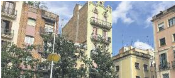
El debat del preu del lloguer segueix molt viu.

Pel que fa a les xifres municipals, tot i que de moment no es coneixen les del quart trimestre de l'any passat, dibuixen un escenari amb més matisos, ja que els preus, entre el segon i el tercer tri-