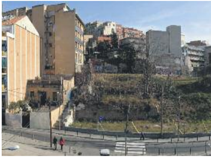
El futur de Vallcarca continua aixecant polèmica.