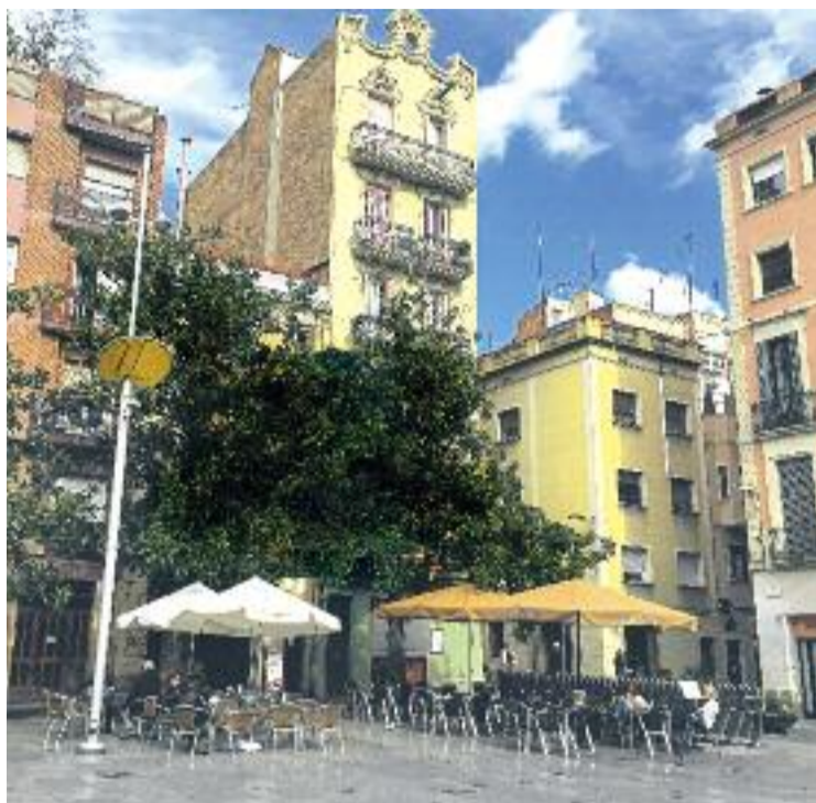
Les terrasses segueixen aixecant polèmica.