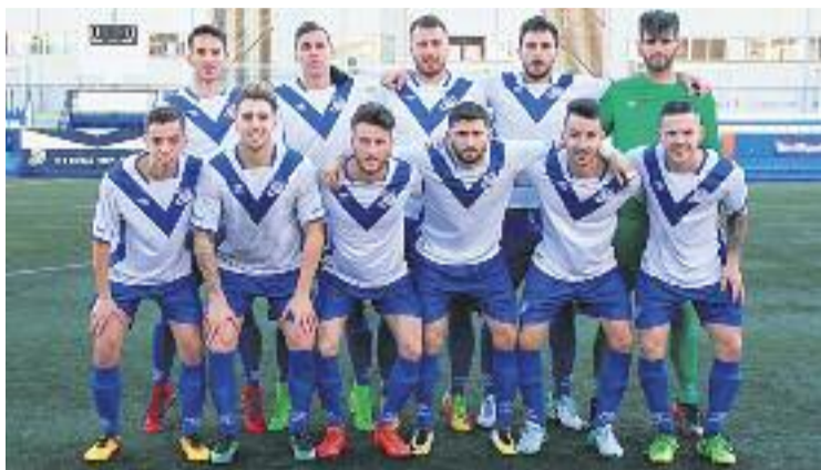
L'onze escapulat del partit contra el Vilassar.

Per la seva banda, el sènior femení continua perdent posicions de mica en mica a la classificació