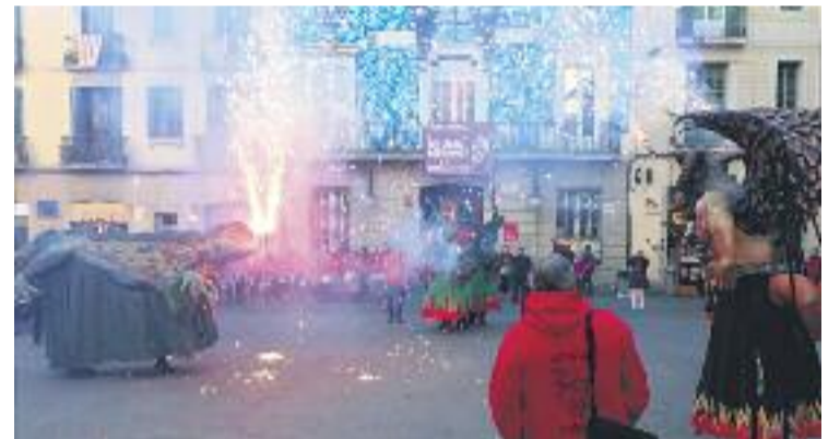
Un moment de la cercavila.