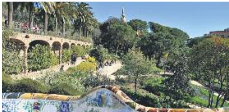
Una imatge recent del Park Güell.