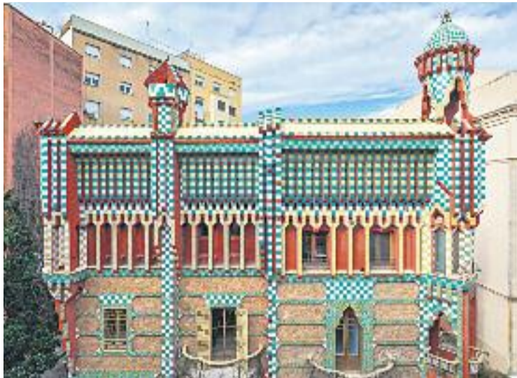
La Casa Vicens va ser construïda entre el 1883 i el 1885.

El 1969 va ser declarada monument històric-artístic amb altres obres de Gaudí; el 1993 va obtenir el reconeixement com a Bé Cultural d'Interès Nacional en la categoria de monument històric i el 2005 va ser declarada Patrimoni Mundial de la Humanitat per la UNESCO. Era l'únic dels vuit edificis de Gaudí de Barcelona declarat Patrimoni Mundial que es mantenia tancat al públic.