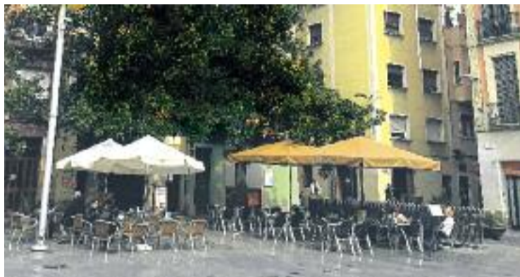
Les terrasses de les places de la Vila tindran set taules menys.

Així doncs, la plaça del Diamant es quedarà igual, mentre que perdran taules la plaça de la Virreina, que passarà de 36 a 30 taules; la de la Vila, que en perdrà sis i passarà de 48 a 40 taules i la de Revolució, que en perdrà cinc i es quedarà amb 30. Guanyaran taules la plaça del Sol, que en guanyarà dues i arribarà a les 60; la de Rovira i Trias, que passarà de 24 a 30 taules i la del Nord, que en tindrà dues més i arribarà fins a 12. A banda de la xifra, les taules es reordenaran per facilitar el pas i l'ús de l'espai públic.