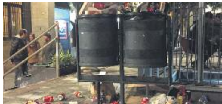
Una imatge recent de la plaça del Sol.

DENÚNCIA ▶ Els veïns de la plaça del Sol continuen denunciant l'incivisme i el soroll que moltes nits els toca patir per culpa de la presència de grups de gent que s'asseuen a la plaça per xerrar, consumir alcohol i, a vegades, tocar la guitarra.