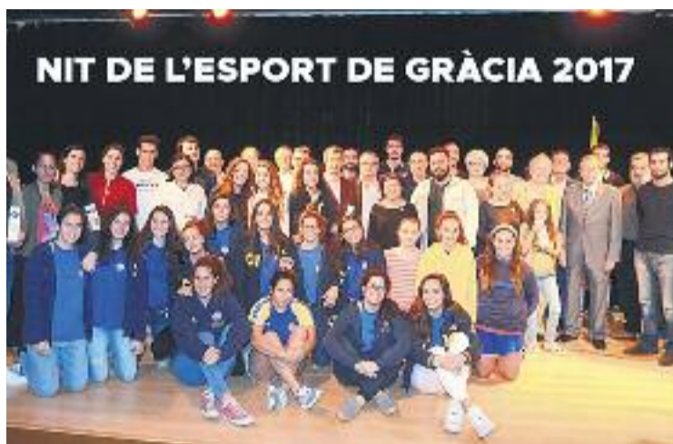
La foto de família amb els premiats.

Pel que fa als guardons col·lectius, el primer equip masculí del Vedruna i el sènior femení del CN Catalunya, van veure com el jurat premiava la seva trajectòria en