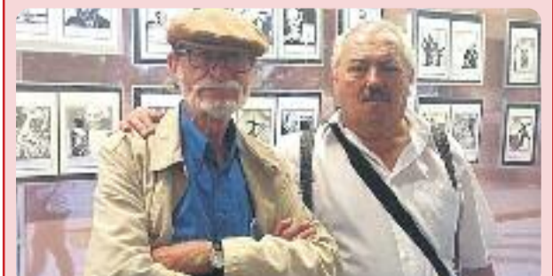
Ferrer, a l'esquerra, en una imatge d'arxiu.

Ferrer també va dirigir la revista juvenil Strong i va ser l'encarregat de descobrir al públic català personatges com Lucky Luke, els Barrufets, Spirou o Jano i Pirluit, entre molts altres.