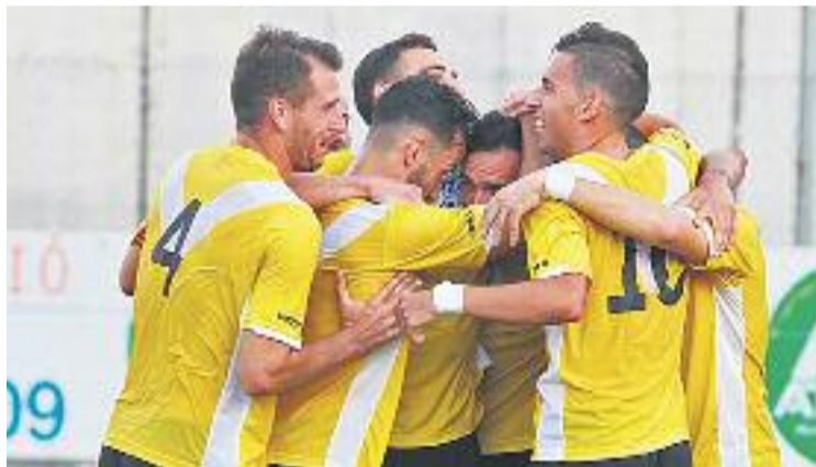
L'equip celebra un gol al camp del Santfeliuenc.

I és que ara que ja s'han jugat les 10 primeres jornades, els es-