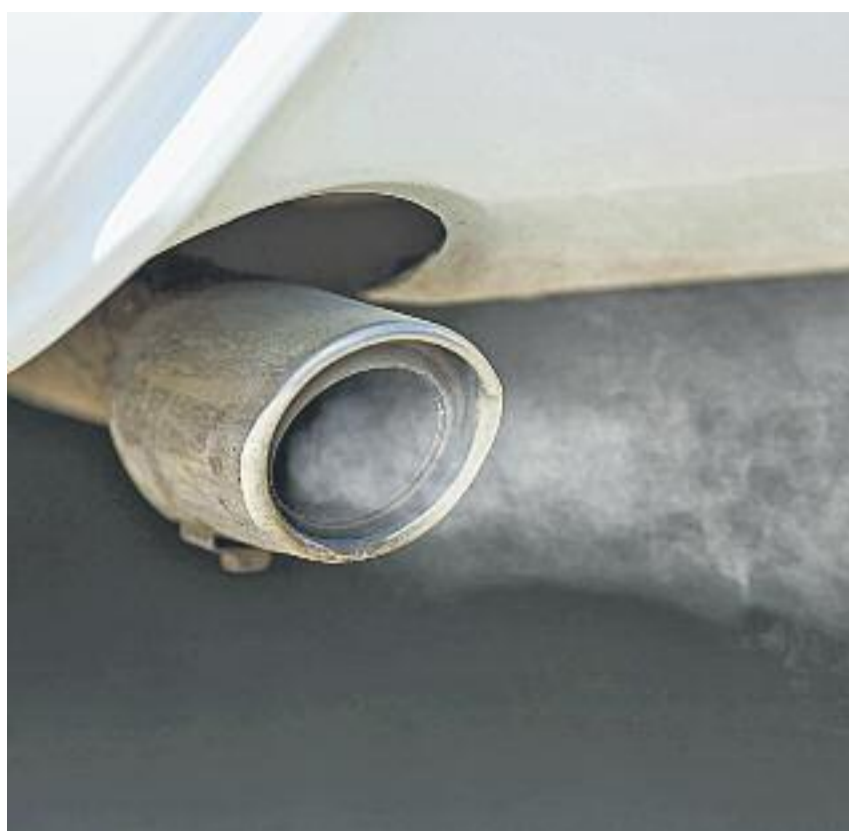
A l'esquerra, una imatge de la presentació de les noves mesures, que tenen com a objectiu reduir la contaminació que provoquen els cotxes.