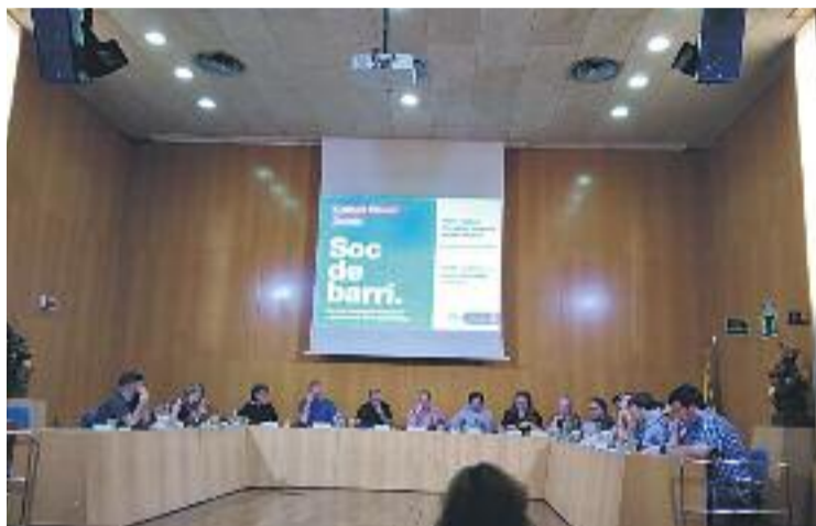
Una imatge del ple de dimecres passat.