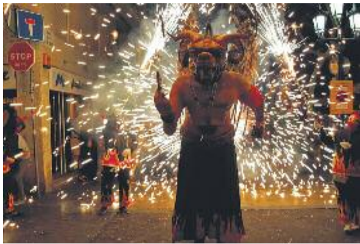
Una imatge del correfoc de dissabte passat.