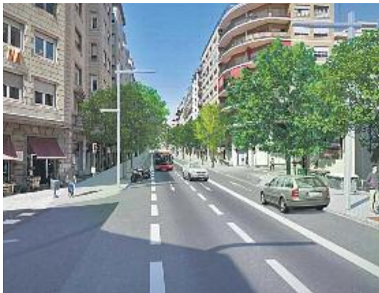
Una imatge virtual de com serà l'avinguda Príncep d'Astúries..

D'altra banda, aquesta reforma també implicarà una millora en la il·luminació de l'a-