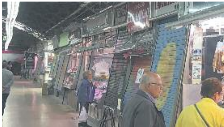
Els paradistes urgeixen a reformar l'Abaceria pel seu "mal estat".

Els paradistes estan tranquils però a l'expectativa. Tanmateix, avisa Magrans, si en uns dies el consistori no es posa en contacte amb ells per explicar els següents passos de la reforma, es