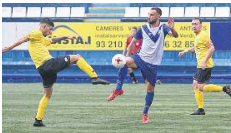
Un moment del partit contra el Castelldefels.

seran la visita a l'Hospitalet de l'Empordà i rebre el Reus B.