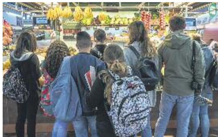
8.000 escolars van visitar els mercats el curs passat.

Aquesta xifra suposa un augment de participants del 20% respecte de l'any anterior.