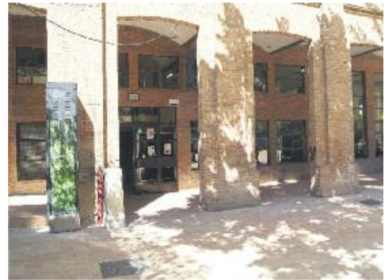
La trobada del Camp d'en Grassot i Gràcia nova és avui a La Sedeta.

L'activitat, que ha estat escollida en el marc del procés participatiu Decidim Gràcia, està dividida en tres moments per poder assolir l'objectiu final: la primera trobada és el moment d'introducció i preparació, el segon serà la passejada pels diferents barris i el moment final serà el taller de tancament de propostes.