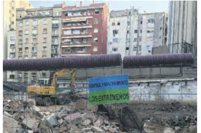
Dos dels casos d'obres amb cartells de vigilància de suposats clans gitanos que apareixen en aquest reportatge.

com ara Badalona, l'Hospitalet o Tiana, entre moltes altres.