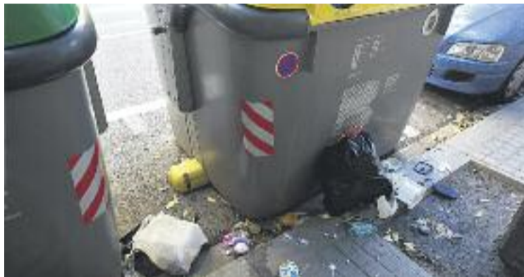
El mal ús dels contenidors, un dels causants dels punts amb brutícia.

Pel que fa a la resta de barris, el Camp d'en Grassot té 12 punts negres, la Salut nou, Vallcarca i els Penitents set i El Coll quatre. D'altra banda, si es miren les xifres per districtes, es pot dir que Gràcia és el quart més net de la ciutat, ja que només tenen menys punts negres les Corts (48), Sarrià-Sant Gervasi (52) i l'Eixample (79). La llista l'encapçala Ciutat Vella amb 107.