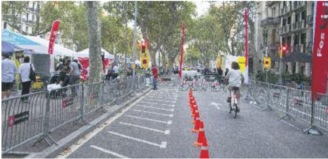
Una imatge del Dia sense cotxes de l'any passat.

MOBILITAT ▶ La celebració del Dia sense cotxes del pròxim 22 de setembre tornarà a tenir el carrer Gran de Gràcia com un dels punts de la ciutat que seran protagonistes.