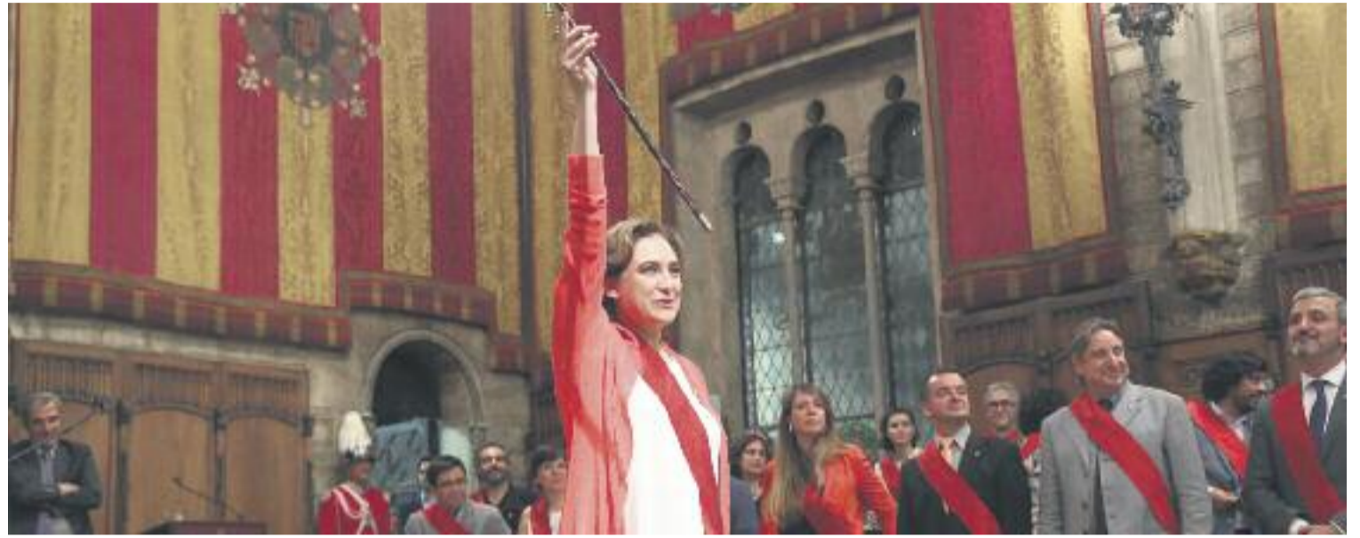
Colau, el dia de la presa de possessió com a alcaldessa.

L'actual alcaldessa, ara de baixa després d'haver estat mare, va iniciar el mandat amb molta ambició. Feia falta començar a complir les múltiples promeses fetes a la ciutadania durant la campanya electoral. Han passat dos anys i, segurament, la gran victòria de Colau i el seu govern –primer en solitari i després amb el PSC– és la d'haver canviat, i dominat, l'agenda política de la ciutat. El turisme i l'habitatge, els dos grans temes on els comuns van posar més èmfasi durant la campanya, ocupen ara la centralitat del debat polític. L'aprovació del Pla Especial Urbanístic d'Allotjaments Turístics (PEUAT), pactat amb ERC, ha