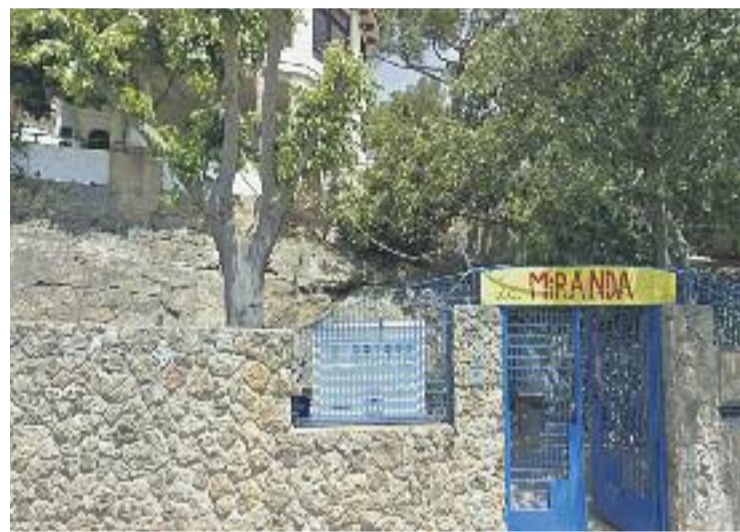
Les reunions es fan a la seu de l'associació la Miranda.

La pròxima trobada a La Miranda per recuperar informació i fotografies tindrà lloc el dilluns dia 3 de juliol.