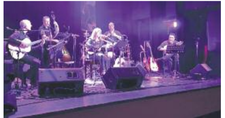
Una imatge del concert de divendres passat.

D'altra banda, avui el CAT acollirà a dos quarts de deu del vespre, coincidint amb el Coprus, el concert de La Banda del Memorial Ricard Cuadra de Berga per presentar les músiques de la Patum.