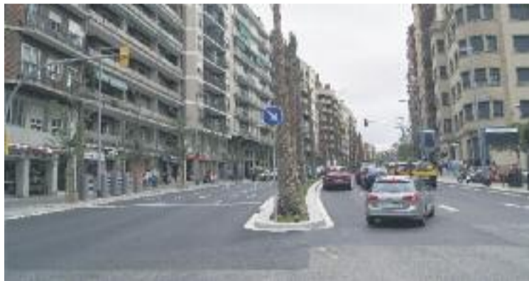
Una imatge de la nova Travessera de Dalt.

Durant la compareixença davant dels mitjans, Sanz va explicar que amb la reforma acabada es "pacifica la zona i es mi-