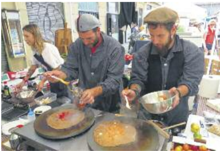
Els mercats es van omplir d'activitats durant el maig.