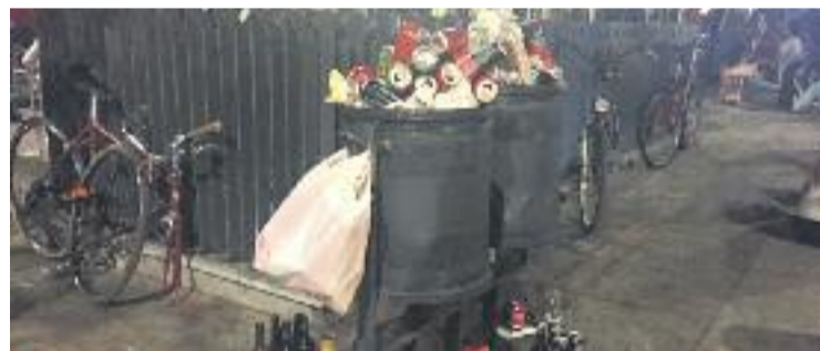
Una imatge recent d'una nit a la plaça del Sol.

QUEIXES VEÏNALS ▶ La problemàtica relacionada amb el soroll a la plaça del Sol, i les molèsties veïnals que causa, ve de molt lluny. Ara però, tal com va avançar l'Independent, gairebé 200 veïns han rebut la resposta del Districte a un manifest de protesta que van entregar a principis d'abril i que implicarà una trobada entre veïns i Districte per tractar la problemàtica.