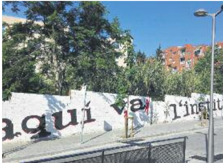
Vallcarca fa anys que reclama el nou institut.