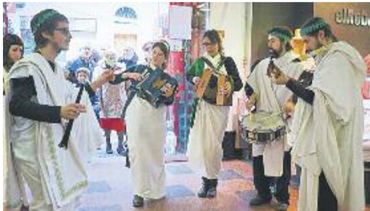
L'Orquestrina Trama a la Llibertat l'any passat.

El cicle continuarà una setmana més tard, coincidint amb Carnestoltes. El 6 de febrer,