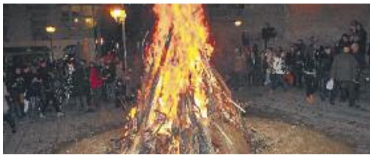
Els Foguerons, una peculiaritat mallorquina a Gràcia.

Divendres el CAT continuarà amb la seva programació de Foguerons amb un taller de ball i el