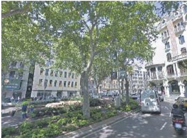
La zona dels Jardinetes acull hotels i apartaments turístics.

Pel que fa al conjunt del districte presenta entre un 5 i un 10% de places turístiques en relació a la població, una xifra que se situa en la mitjana de la ciutat, que és de 6,4%. Si es fa un cop d'ull als barris, la Vila és on la relació en-