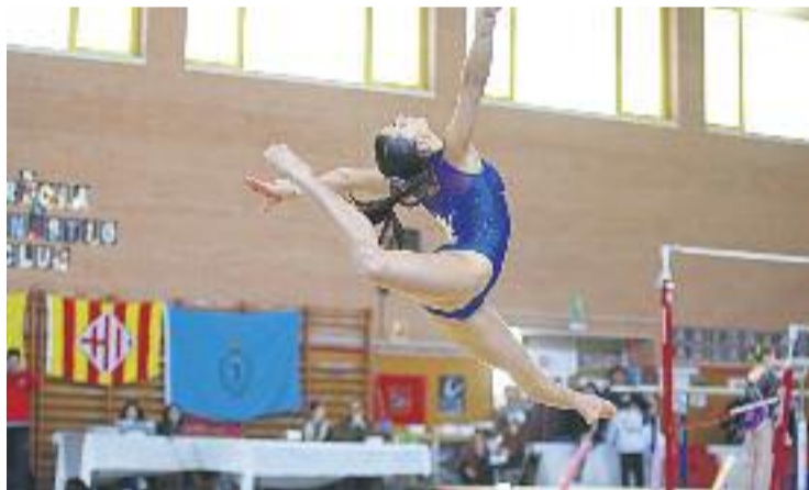
Una imatge de l'edició de 2015.

GIMNÀSTICA ▶ El Trofeu Internacional Vila de Gràcia de gimnàstica es fa major d'edat. Demà al matí, el pavelló del Gràcia Gimnàstic Club serà l'escenari de la divuitena edició del campionat.