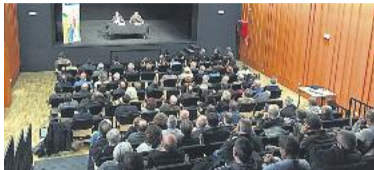
El teatre dels Lluïsos es va omplir per escoltar Rull.

Tot seguit, Rull, una de les veus autoritzades de CDC, va defensar la declaració del Parlament feta els primers dies de la legislatura en assegurar que va arribar després de "guanyar el plebiscit amb vots i escons".