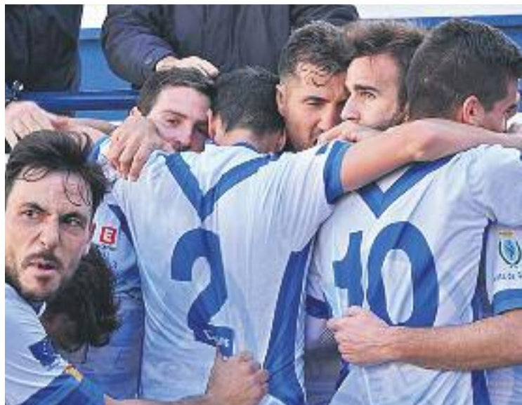
L'Europa va trencar la mala ratxa contra el Palamós.

El trencaclosques pel tècnic escapulat, doncs, serà configurar una línia defensiva prou solvent com per afrontar un partit exigent contra un equip que, si bé encadena dues derrotes conse-