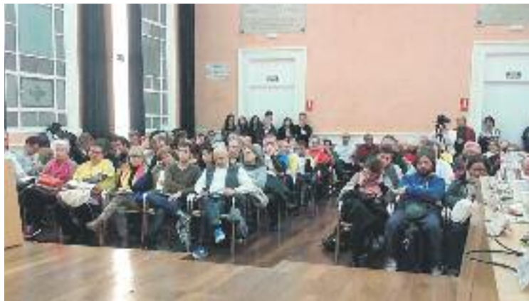
L'expectació durant el Ple va ser alta.

Cuinada juntament amb l'ANC durant setmanes, la declaració recorda com els resultats de les eleccions del passat 27 de setembre legitimen "iniciar el procés cap a la independència". El text fa referència al "dret a l'autodeterminació dels pobles" i afegeix que és "una condició necessària per a la plena llibertat i desenvolupament" d'aquests pobles. El document, que va ser defensat al Ple en nom de les tres formacions per Berta