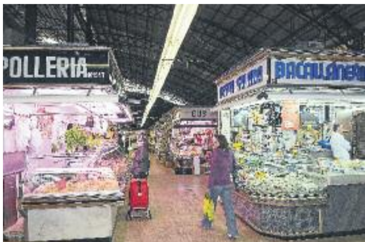
Els botiguers es queixen de l'estat del mercat.

Davant d'aquest anunci, els botiguers de l'Abaceria respiren després d'unes últimes setmanes d'intranquil·litat. "Ara sabem que això tira endavant", asse-