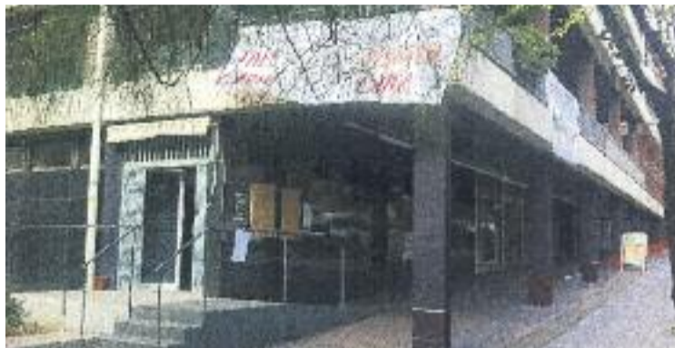
L'assemblea es va celebrar a la nova seu del Tres Lliris.