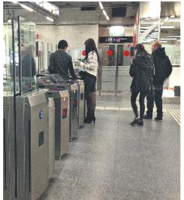
El frau al metro ha anat creixent en els darrers anys, tot i que el rècord es va registrar el 2009.