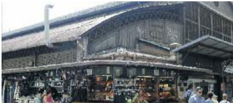
Els botiguers lamenten l'estat del mercat.

Des del govern gracienc també recorden, però, que encara cal establir uns terminis fixos per fer la remodelació, una obra que depèn de l'Institut de Mercats.