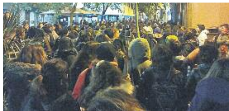
Imatge de la marxa nocturna.

MANIFESTACIÓ ▶ Centenars de persones, la majoria dones, van recórrer la nit de dimarts, la vigília del 25N -Dia Internacional contra la violència masclista-, alguns carrers de la Vila per mostrar el seu rebuig contra la violència masclista.