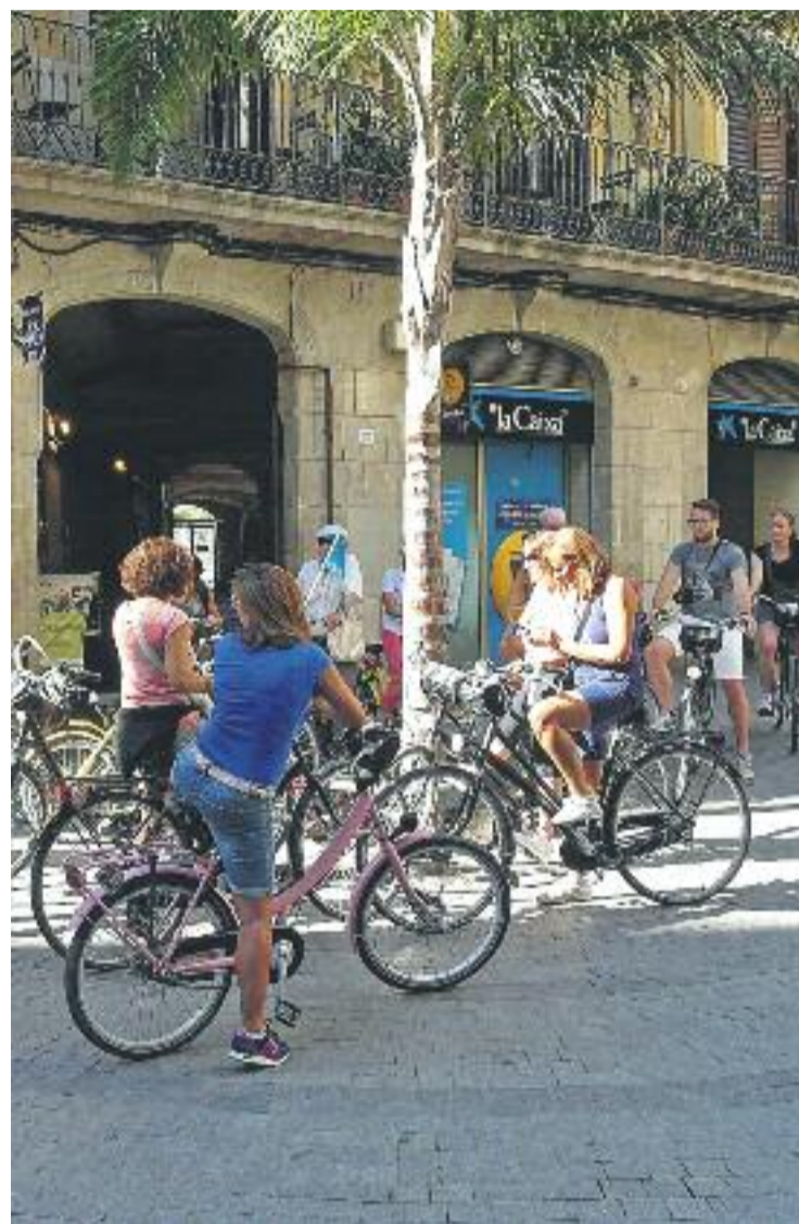
L'Ajuntament vol que d'aquí a tres anys la ciutat sigui molt més accessible per als ciclistes.