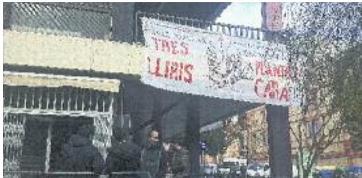
Imatge de l'antiga comissaria ara ocupada.

L'edifici ocupat, que és de propietat municipal, estava, segons els joves ocupants, en desús des de fa dos anys. Des del Districte expliquen a Línia Gràcia que no hi ha cap intenció de desallotjar l'edifici i que es volen "mantenir converses amb el col·lectiu per a veure què volen fer". "Som conscients que a la zona falten equipaments públics i volem fer un intent d'apropament", afegeixen les mateixes fonts. Aquesta voluntat de diàleg i l'ús que s'acabarà do-