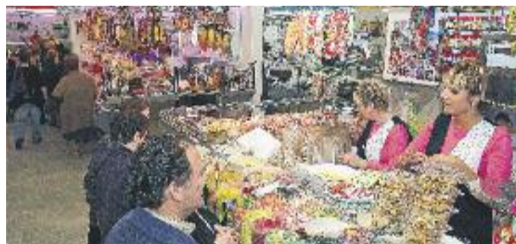
Les vendes nadalenques suposen un terç de la facturació anual.

PREVISIONS ▶ La campanya de Nadal d'enguany podria posar la cirereta del pastís a un 2015 que sembla haver trencat amb la mala ratxa dels últims anys en el sector del comerç –almenys segons les dades a gran escala–. I és que la Confederació de Comerç de Catalunya (CCC) confia que aquesta pròxima campanya de Nadal serà "positiva" per al sector, en la línia de la que es va viure l'any passat. Concretament, la CCC espera que les vendes s'incrementin un 4%, especialment