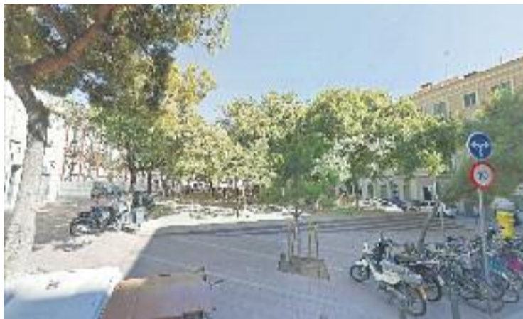
El punt de sortida de les curses serà la plaça del Nord.

ATLETISME ▶ Aquest diumenge se celebrarà la quarta edició de la Cursa d'orientació popular que organitzen els Lluïsos amb la col·laboració de GoExtrem.