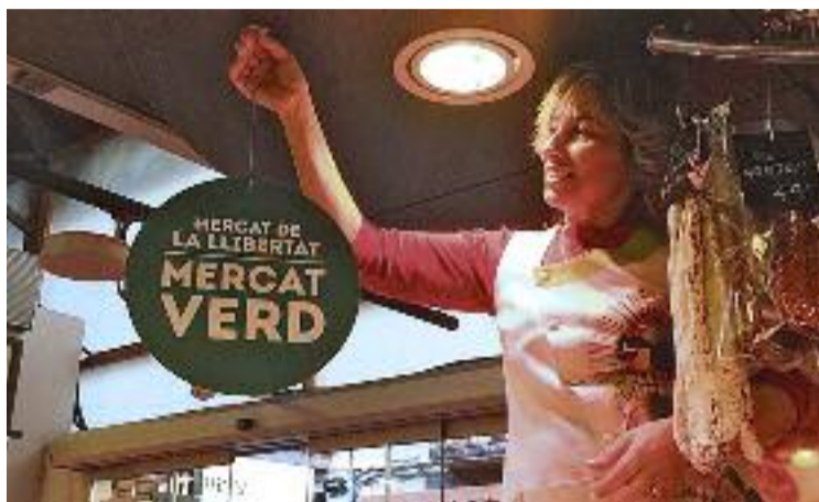
Cartells promocionals a l'equipament.