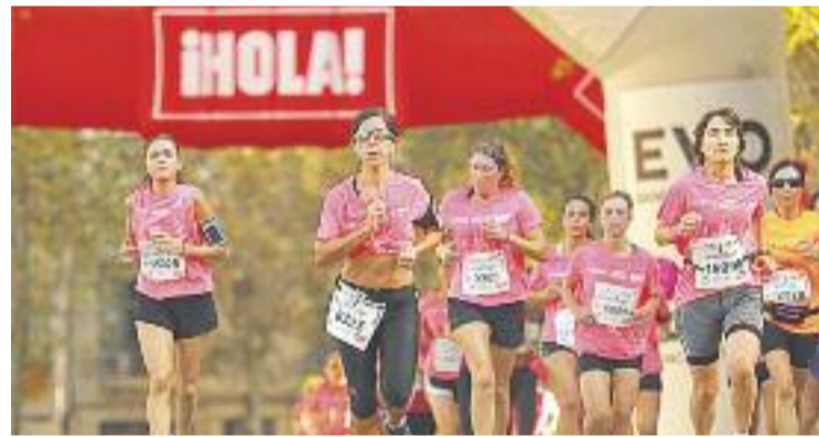
Barcelona es va tenir de rosa durant un dia.

ATLETISME ▶ Un any més, la Cursa de la Dona va aplegar un bon nombre de participants que van córrer contra el càncer de mama diumenge passat. Segons els organitzadors, es van recaptar 130.000 euros per a la causa.