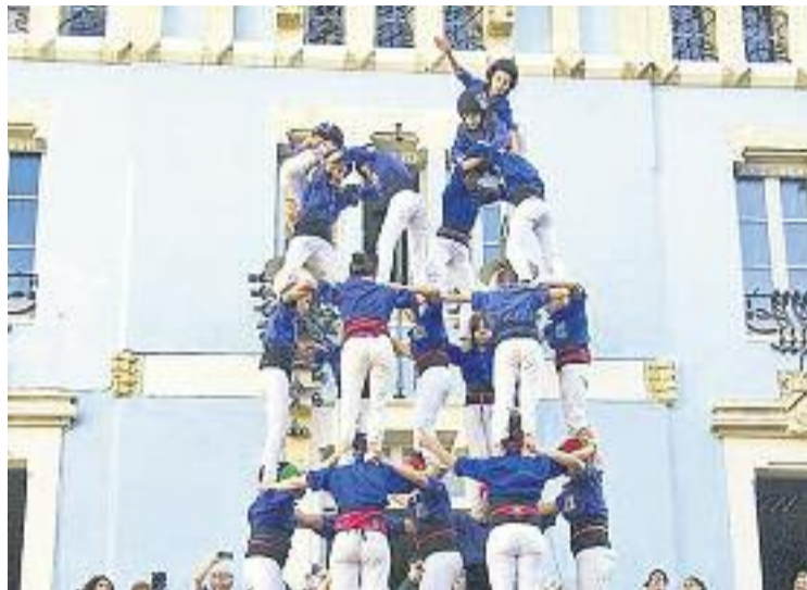
Els castells de 9, protagonistes de la Diada.

Sobre la Diada de diumenge, el cap de colla blau destaca que va ser "molt bona" i va elogiar