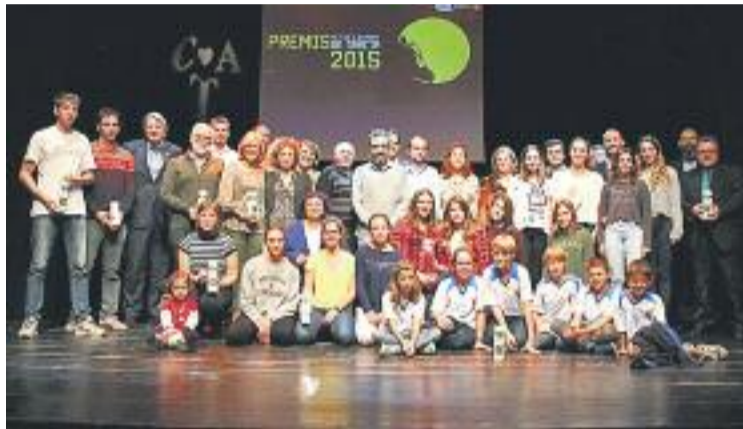
La foto de família dels premiats.

Per altra banda, la Copa Catalunya que l'Europa va guanyar el passat mes de març va servir als escapulats per assegurar-se el tí-