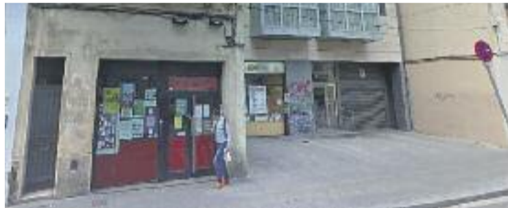
El casal Tres Liris és a la travessera de Gràcia.

Els integrants del casal Tres Liris ja han deixat clar que quan es produeixi el desallotjament, el mateix dia organitzaran una concentració de protesta a la plaça Joanic. Durant les darreres setmanes els mateixos integrants del casal també han demanat al govern de Colau que s'hi posi en contra. Dilluns Gràcia en Comú va