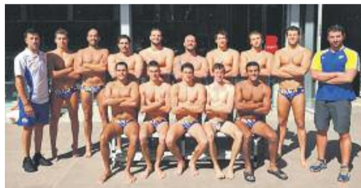
La foto d'equip dels graciencs.

WATERPOLO ▶ La Divisió d'Honor va començar molt bé per al CN Catalunya, amb una victòria per 9 a 8 contra el Waterpolo Navarra, però d'aleshores ençà els graciencs han encadenat tres jornades sense guanyar, un empat i dues derrotes, la darrera dissabte passat a la piscina Carles Ibars contra el CN Sabadell (15-7).