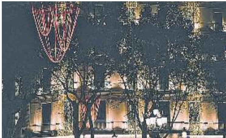
El consistori ha cedit i encendrà els llums de Nadal abans.

Una setmana més tard, el consistori ha hagut de cedir i ha decidit fixar la data d'encesa del Nadal per al dia 27 de novembre. De totes maneres, segueix insistint en el fet que enguany els llums "s'endarrereixen respecte d'anys anteriors" i remarca que responen a la petició dels botiguers per tenir enllumenat nadalenc durant el Black Friday , el mateix dia 27, una jornada de descomptes importada dels països anglosaxons.