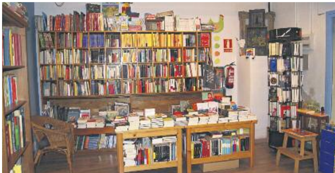
Imatge interior de la llibreria Casa Anita.