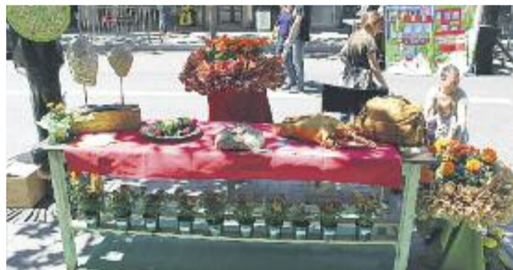
Els botiguers de Gràcia estan satisfets amb la jornada.

MOSTRA ▶ Els comerciants de la Vila van treure les seves botigues al carrer el passat dissabte dia 17 amb motiu del Dia del Comerç, que va coincidir també amb el Dia sense cotxes. Diversos carrers de Gràcia van quedar tallats a la circulació i ocupats per paradetes de botiguers i una munió de visitants que van descobrir l'oferta comercial de la zona. "Creiem que vam triplicar l'afluència de visitants de la mostra del mes de maig", expliquen des de l'associació co-