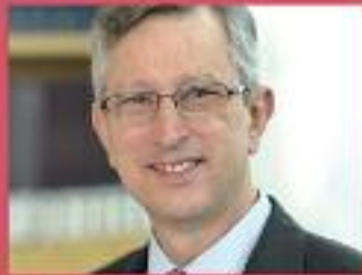
Joan Massagué Director del Sloan Kettering Institute de Nova York (EUA). Una de les màximes autoritats mundials en investigació del càncer

JUNTS TENIM LA MÀXIMA GARANTIA D'UN PAÍS MILLOR