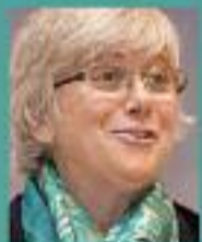
Clara Ponsati Professora de la University of St. Andrews (Gran Bretanya), exinvestigadora de l'Institut d'Anàlisi Econòmica CSIC, Ph.D. per la University of Minnesota

Professor de la Barcelona GSE. Ph.D pel MIT. Investigador associat del National Bureau of Economic Research i del CEPR. Exprofessor a Columbia University i New York University. President de l'European Economic Association