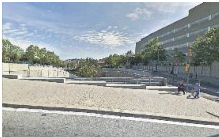
La Ronda de Dalt, al seu pas per la plaça Alfons Comín.