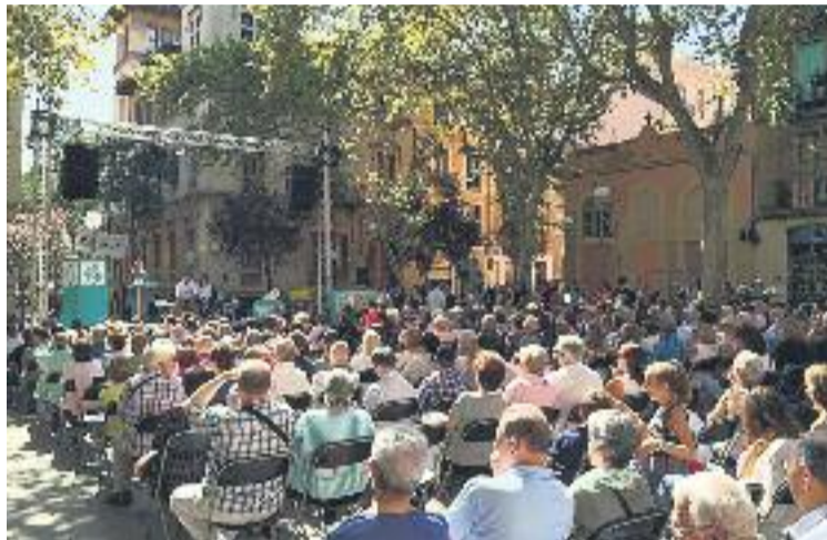
La plaça de la Virreina plena durant l'acte de Junts pel Sí.