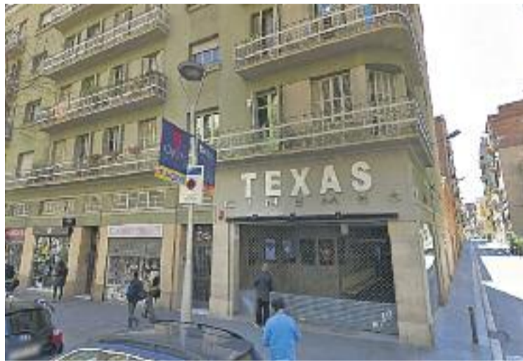
La reobertura dels Cinemes Texas ha estat tot un èxit.