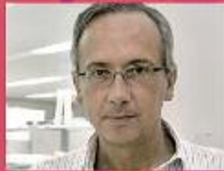
Bonaventura Clotet Cap de la Unitat de VIH de l'Hospital Universitari Germans Trias i Pujol, reconegut mundialment per les seves aportacions a la recerca d'una vacuna contra la sida