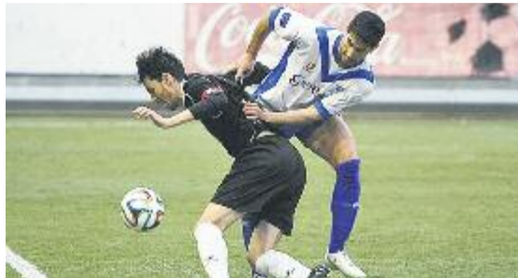
Una imatge de l'Europa-Rubí de l'any passat.

Amb tot, la setmana passada els graciencs van golejar a domicili el Manlleu per un gol a quatre, un partit que va tenir com a protagonista el davanter escapulat Poves, que amb dos gols –un d'ells de xilena– va sentenciar les opcions del Manlleu. Després del partit, Poch va