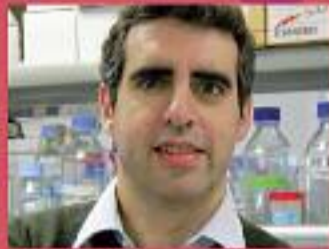
Manel Esteller Investigador de l'Institut d'Investigació Biomèdica de Bellvitge. Un dels grans experts mundials en epigenètica del càncer