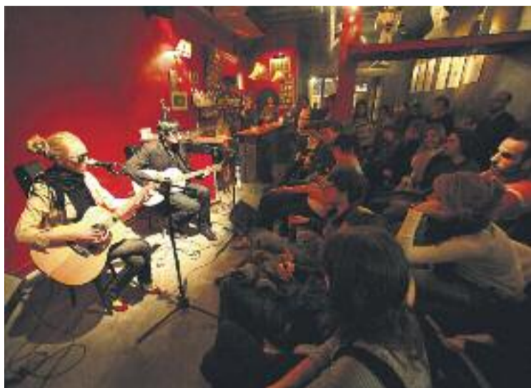
L'Heliogàbal ha acollit 1.600 concerts al llarg dels seus 20 anys.