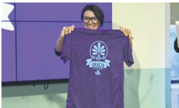
Sílvia Abril, a la presentació de la cursa.

ATLETISME ▶ Queda poc més d'una setmana perquè torni la cursa dels districtes de Barcelona, el Correbarri, on enguany Gràcia estarà representada per l'actriu Sílvia Abril. "M'estimo molt el meu districte", va afirmar Abril durant la presentació de la prova a principis de setmana. L'actriu també va declarar la seva devoció a l'esport. "Vaig corrent a tot arreu, és genètic", va dir.