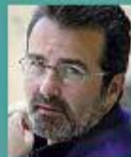
Xavier Sala i Martín Catedràtic de Desenvolupament Econòmic de la Universitat de Columbia. Ph.D a

Barcelona GSE. Ph.D a Harvard. Investigador associat del National Bureau of Economic Research i del CEPR. Ha estat professor al Massachusetts Institute of Technology i a la Universitat de Chicago