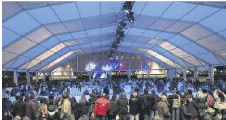
Barcelona, la pista de gel, ja és història.

D'aquesta manera, cada eix comercial s'encarregaria de celebrar activitats sota la coordinació