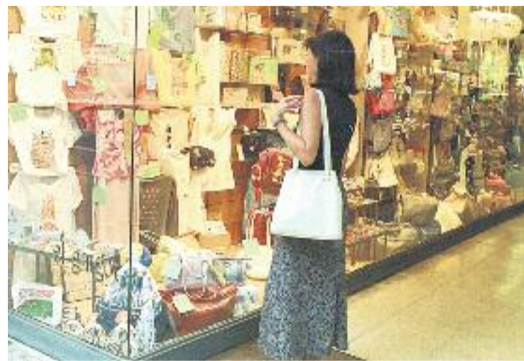
Els premis consten de 8 modalitats.